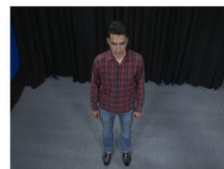
Top shot, Aerial Shot (TS or AS)