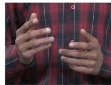
Detail Shot or Sequence