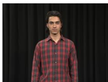
Medium Shot (MS)