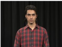
Medium Close up (MCU)