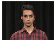
Close up (CU)