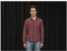
Medium Long Shot (MLS)