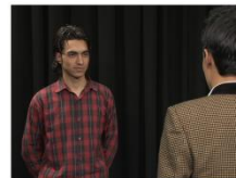
Over the Shoulder Shot (OS)