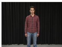
Knee Shot (NS)