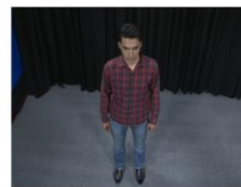
Top shot, Aerial Shot (TS or AS)