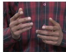
Detail Shot or Sequence