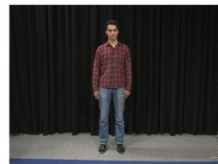
Long Shot (LS)