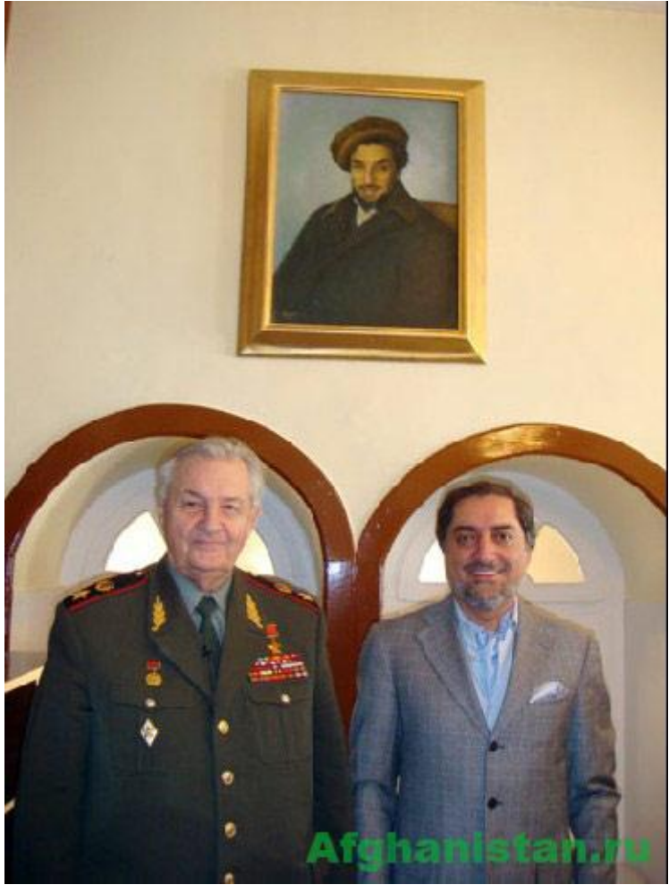
روسی جنرال وارپنیکوف په کابل کې له عبدالله عبدالله سره، ۲۰۰۸ ز کال. دی د مسعود تر عکس لاندې عکس اخیستل د خان لپاره یو ویار بولي.