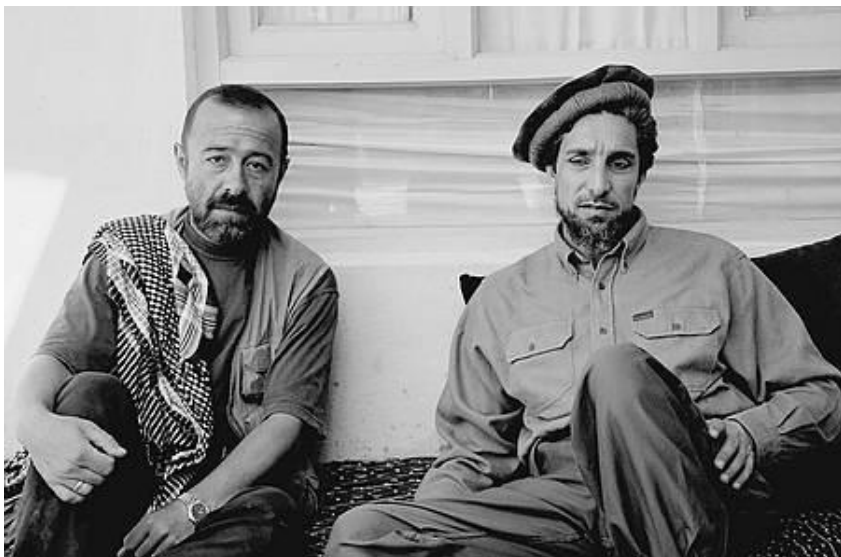
د احمد شاه مسعود او روسي پوځي څارگر «الېکساندر کنيازېف» يو بل گډ انځور. ۱۹۹۹ز کال.