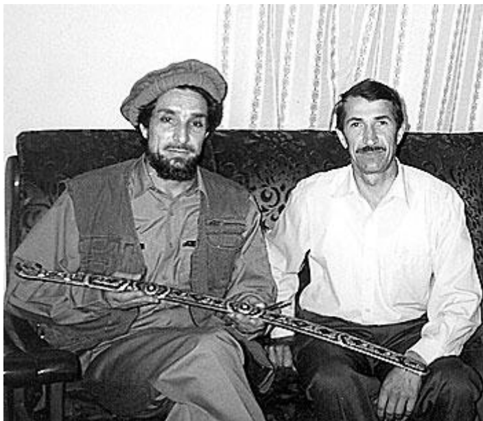
احمد شاه مسعود او د روسي څارگری (کې.جي.بي) ډگروال رينات تيمبروويچ امينوف، د ۱۹۹۸ ز کال د جولای میاشت.