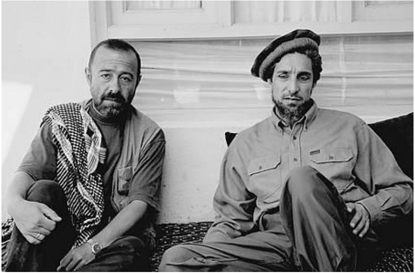
د احمد شاه مسعود او روسي پوځي څارگر «الېکساندر کنيازېف» يو بل گډ انځور. ۱۹۹۹ز کال.