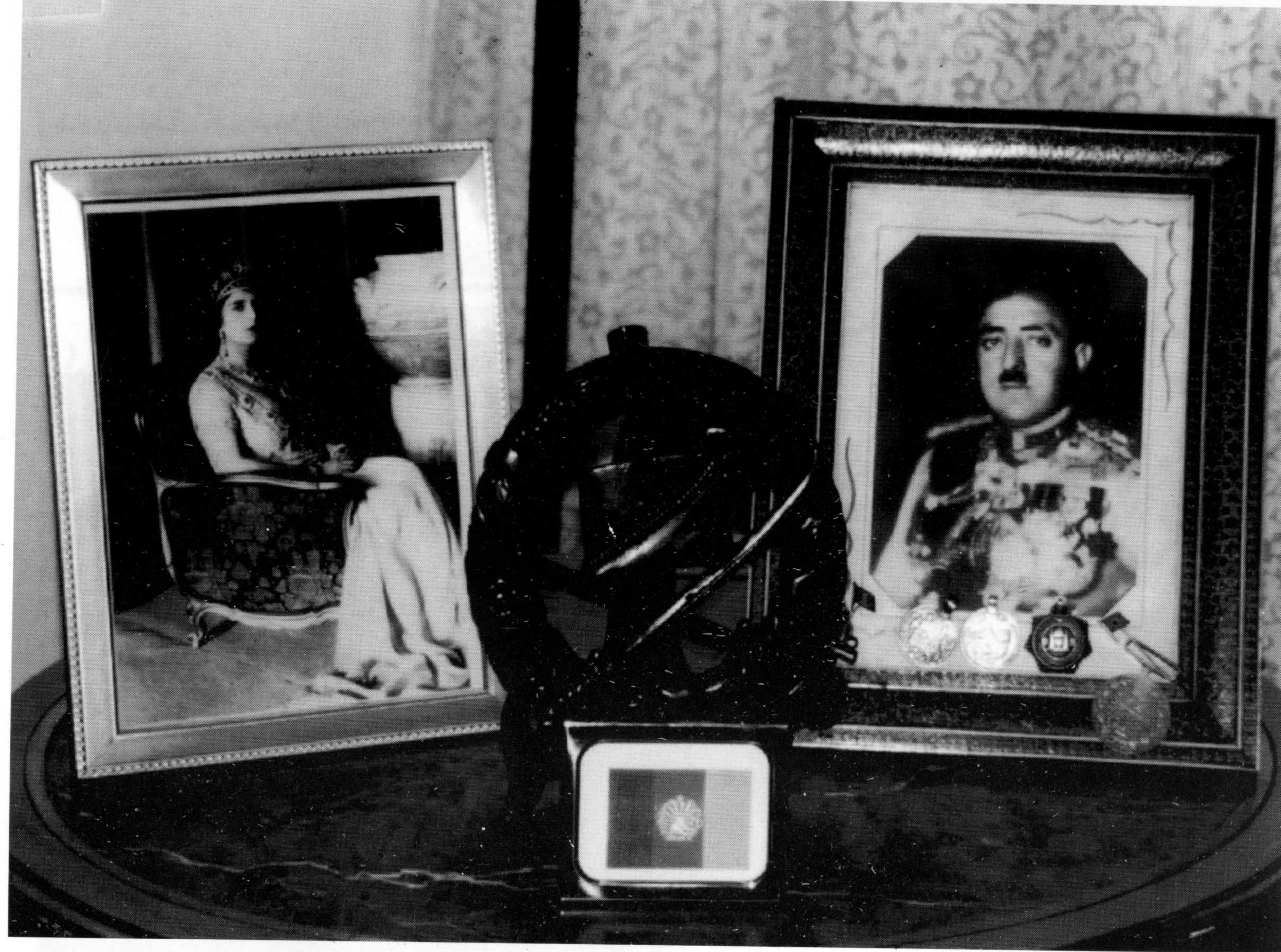
د امير امان اله خان او ملکه ثريا عکسونه د هغې د زوی د مېر پر سر