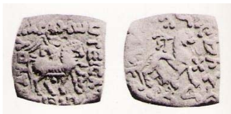
پر سكو باندي د خروشتي الفبې نمونې:

د معاصر افغانستان او هغه ته په ورڅېرمه (خصوصاً لوېديځو) بيلو بيلو سيمو كښي د موندل شوو كتيبو (ليكنو) او سكو له مخي څخه د تاريخ پوهان وايي چي د دغو سيمو د بيلو بيلو ژبو له پاره خروشتي الفبې رواج وه. خروشتي د يو ډول لرغوني الفبې نوم دى نه د يوې ژبې. دلته لاندي د خروشتي الفبې نمونه وگورئ: