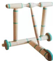
تصویری از پای روانک چوبی قدیمی

در خانه برادران و خواهر با او کمک مینمودند تا او راه رفتن را یاد گیرد.