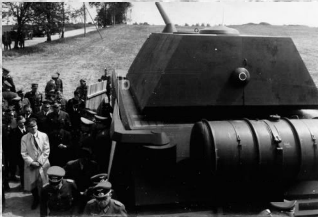
پیشوا در حال دیدن از پیش نمونه ماوس

ارسال سنگ آهن از سوئد به آلمان، با مشکل مواجه شد. آلمان ها برای تولید ماوس و تولید برنامه ریزی شده بدنه با تنها ۲ دستگاه در نوامبر ۱۹۴۳، ۴ دستگاه در دسامبر، ۶ دستگاه و در ژانویه ۱۹۴۴، ۸ دستگاه در فوریه و پس از آن ۱۰ دستگاه در ماه بسیار کند بود اما در عوض تولید برجک به دلیل نیاز کم به فولاد، یک ماه جلوتر بود. هنگامی که جنگ پایان یافت، جمعا حدود ۹ دستگاه ماوس در مراحل مختلف و تنها دو دستگاه به طور کامل تکمیل شده بودند.