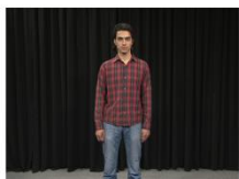
Knee Shot (NS)