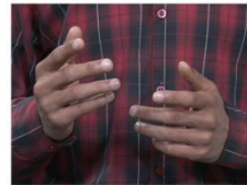
Detail Shot or Sequence