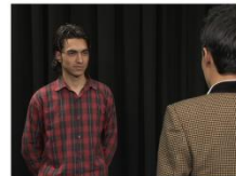
Over the Shoulder Shot (OS)