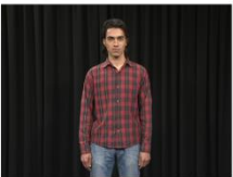
Medium Long Shot (MLS)