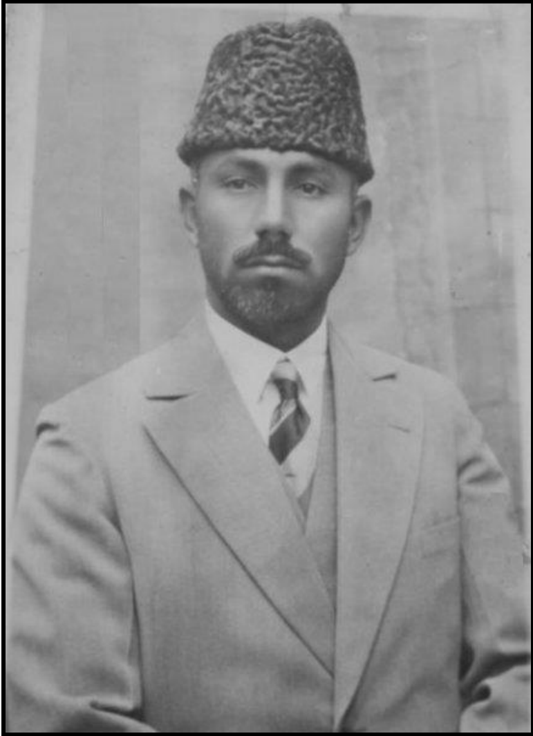
جنرال وزیر محمد گل خان مومند