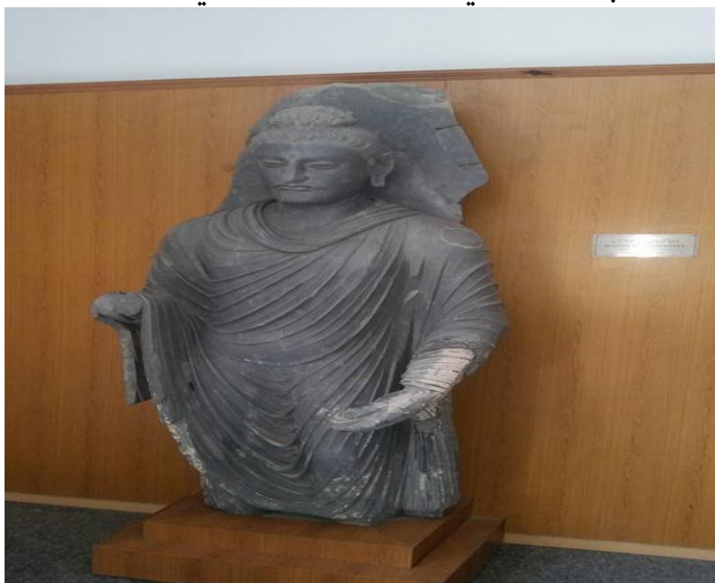
په میوزیم کې پرته د گوتېم بده لرغونې مجسمه