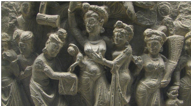
په ټېکسلا کې تر لاسه شوي بودهي دور ډېريني مجسمې