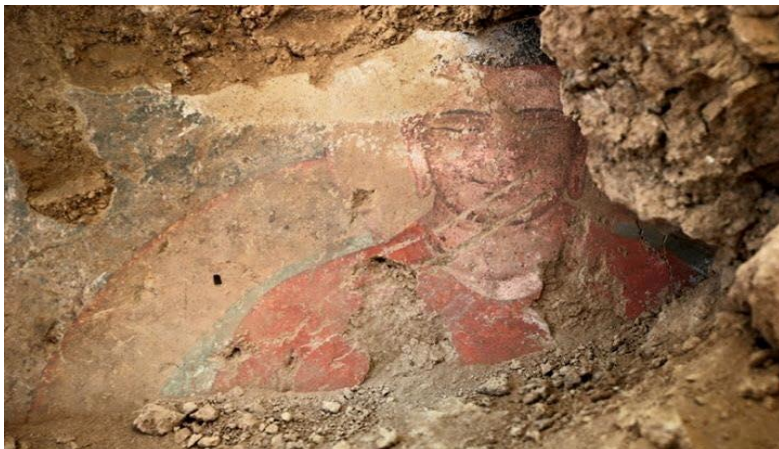
په افغانستان کې موندل شوی یو رنگین بودهي عکس