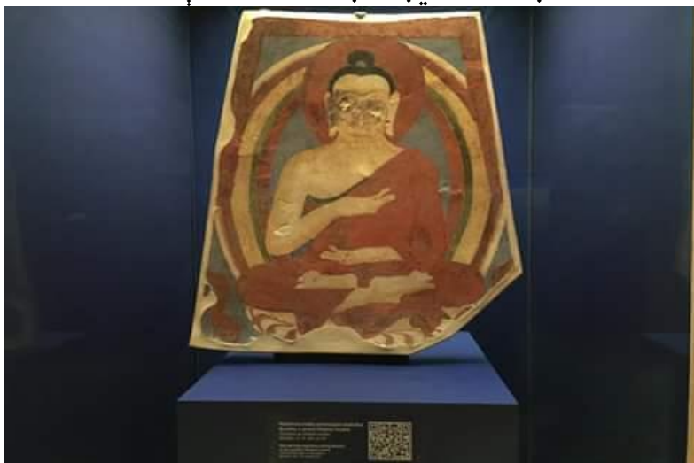
په کابل میوزیم کې پروت په لوگر کې موندل شوی رنگین بودهي عکس