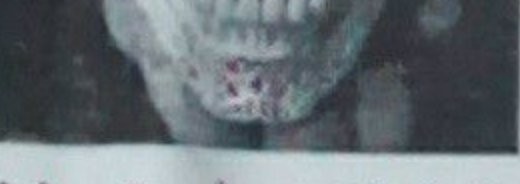
د درې بعدی چاپ د سر کوپړۍ د جوړولو لپاره

عملیات کېږي ددې نجلۍ د سر د کوپړۍ د جوړولو په څېر موادو وده د دې سبب شوي وه چې د هغې پر مازغو فشار راشي، پر له پسې سردېږي ولري او د سترګو نظر یې په تدریجي ډول کمزوری شي جراحانو د دې د سر کوپړۍ تېري کړې او پر ځای یې پلاستيکي کوپړۍ وربښودلې چې ده دا کوپړۍ د درې بعدی چاپ یا اضافي تولید په شوه جوړه شوې ده ددې نجلۍ په تادای کې د شاملو ډاکټرانو د ډلې مشر ډاکټر بن ویرېج د جراحی عملیاتو په اړه وویل «د هغې د سر د کوپړۍ مخکښې برخه په خاص ډول جوړه شوې ده مور په پیل کې د ناروغې د سر کوپړۍ لري کړه، بیا مو د هغې پر ځای لوي پلاستيکي کوپړۍ کېږده چې مازغو ته کافي ځای وي» ډاکټر بن ویرېج وايي، د جراحی کار چې ۲۳ ساعته یې دوام وکړ، بریالی و، د ناروغ وضعیت یخې به شوی، د سترګو نظر یې هم