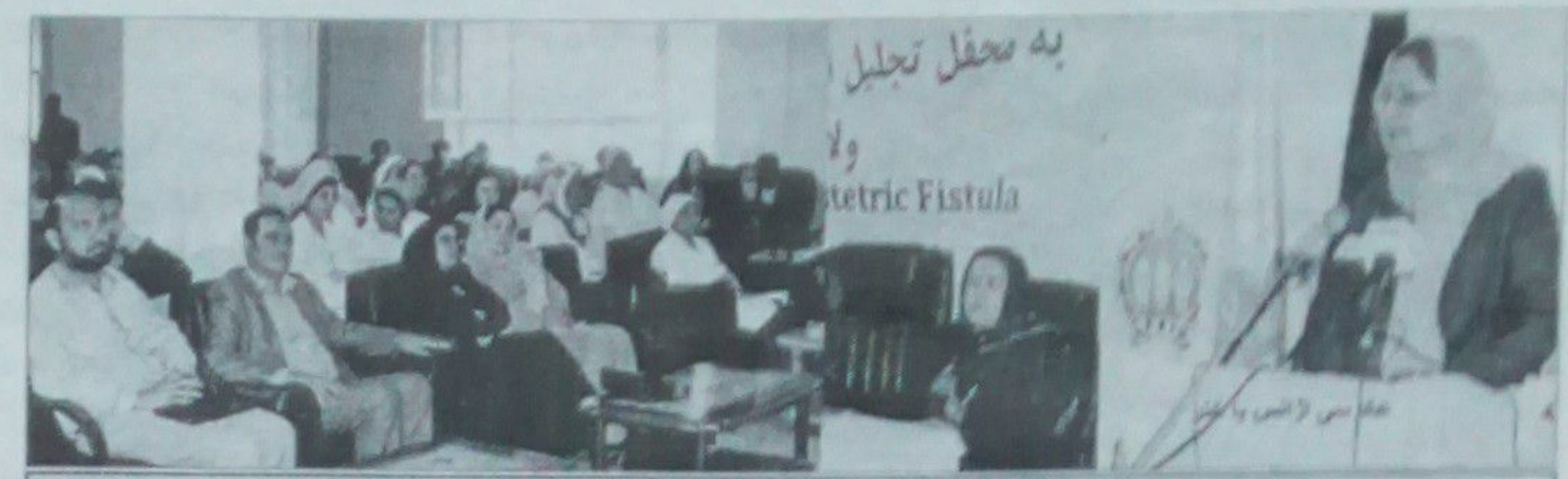
د عامې روغتیا وزیره ډاکټره لریا دلیل غونډې ته د وینا پر مهال

د ولادې فیستولا د له منځه وړلو لپاره ورځ ونمانځل شوه په همدې غونډه کې چې له همدې امله د صفايي روغتیا په وزارت د روغتیا پال نه لاسرسي ولري د ماشوم د زېږون په وخت کې د ملګرو ملتو د وګړو صندوق طبي د ملای په روغتون کې د فیستولا د درملنې د لومړي ملي مرکز د ماسټر کوي چې د ملګرو ملتو سازمان د وګړو صندوق طبي