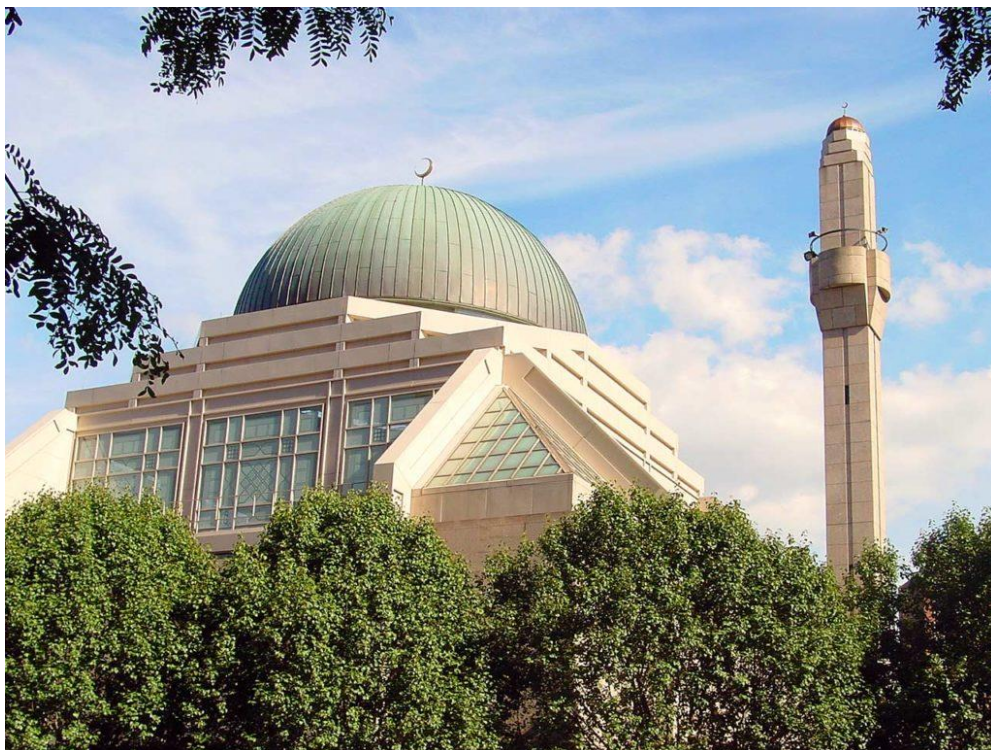
۶. انځور: شاه فيصل اسلامي مرکز، نيويارک.