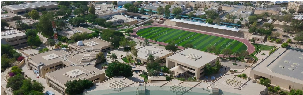
۶. انځور: شاه فيصل مدرسه، عمان.