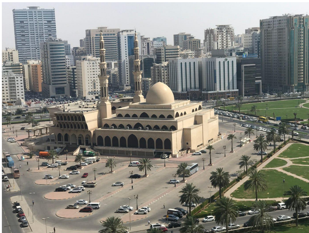
۱. انځور: شاه فيصل جومات، ریاض