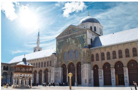
۷. انځور: شاه فيصل اسلامي فرهنگي مرکز، دمشق.