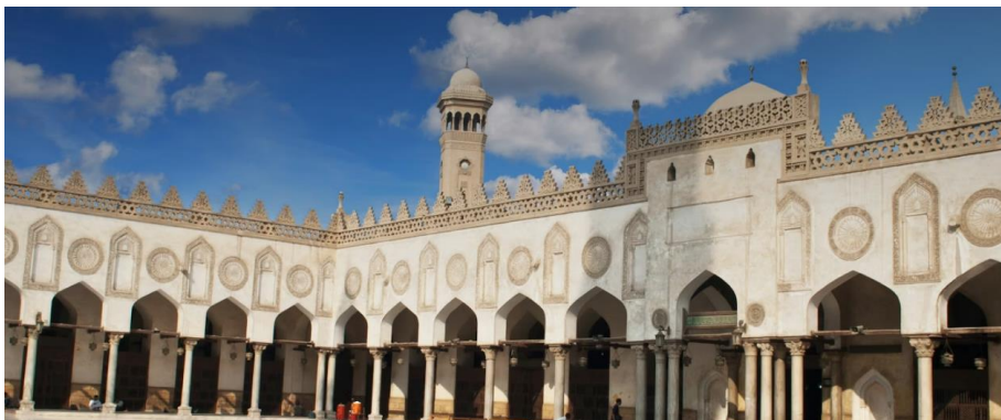
۴. انځور: شاه فیصل اسلامي مرکز، قاهره.