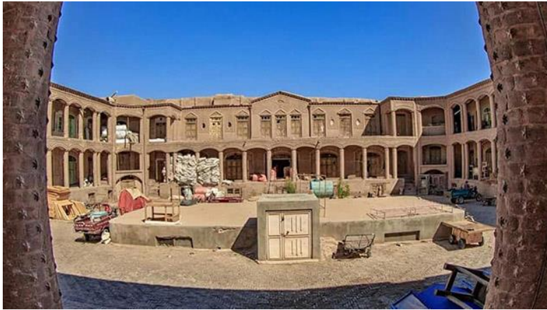
د هرات کاروان سراي انخور د مفکورې ورکولو په اړه

د صفویانو په دوره کې د کاروانسرایونو په منځ کې د شاه عباسي کراچ کاروانسرای دی چې د شاه سلیمان صفوي په وخت کې د ۱۰۷۸ او ۹۱۱۰ ترمنځ جوړ شوی و.