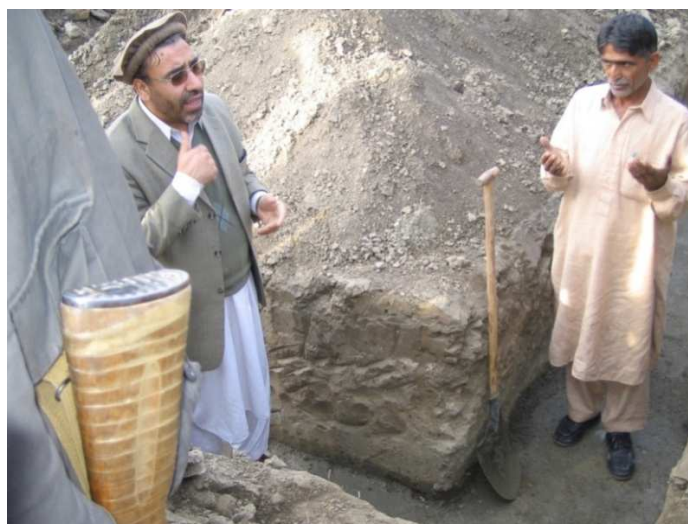
شاه محمود میاخیل د کنړ ولایت د نورگل ولسوالۍ دنوې ودانۍ د بنسټ ډبرې داینبودلو پر مهال