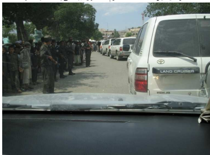
شمالي ولايتونو ته د کاري سفر د موټرو د کاروان یوه بیلگه