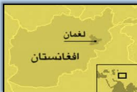
تصویر: از دریای الینگار