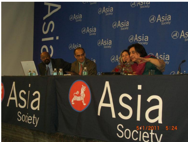
فهمیده ریاض د وینا کولو پر مهال