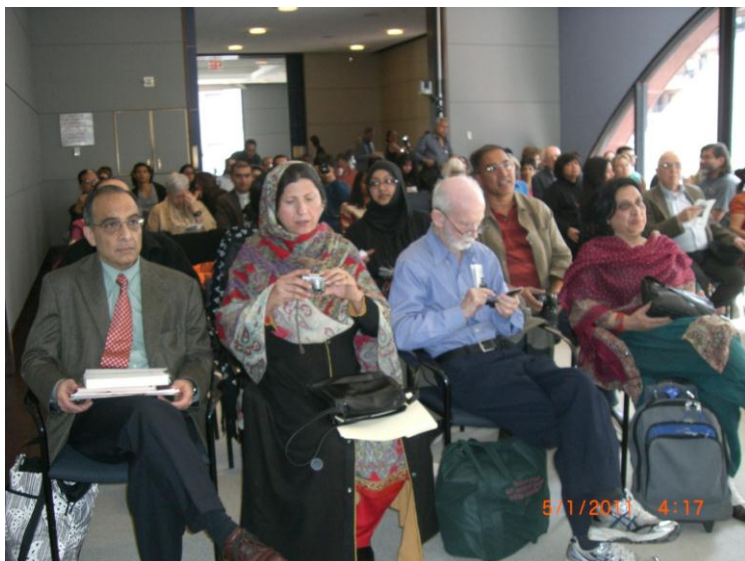
په نیو یارک کې د دستوري پر مهال