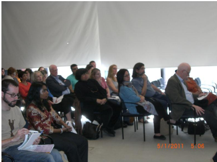
د غونډی نور گډونوال