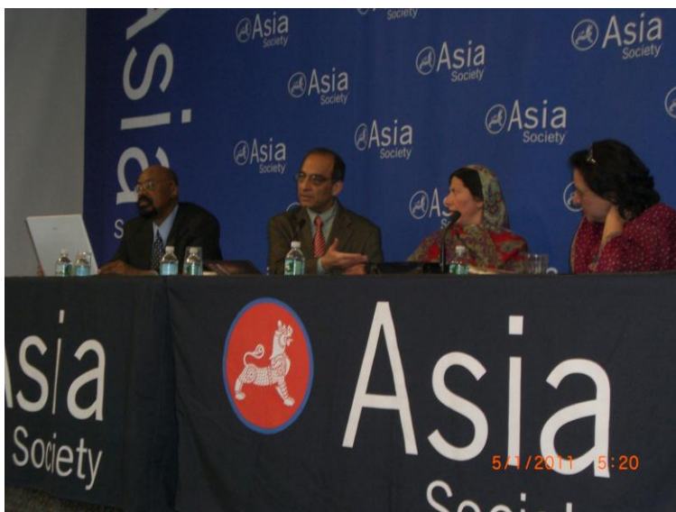
د ایشیاء سوسائیتی یو رابطه کار، وقاص خواجه حسینه گل او فهمیده ریاض