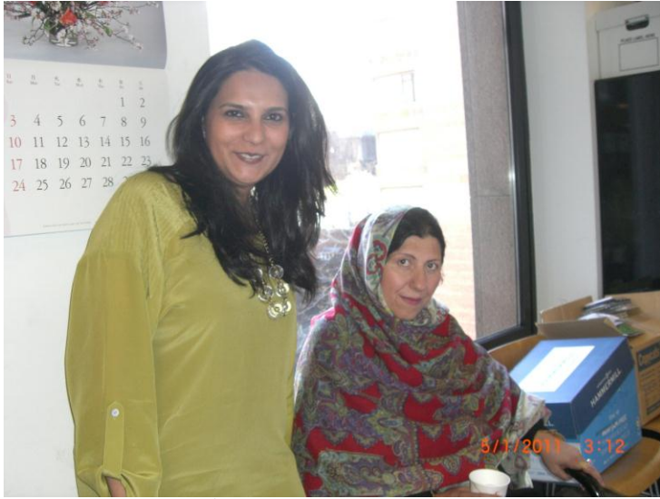
د ایشیاء سوسایٹی نیو یارک په دفتر کې