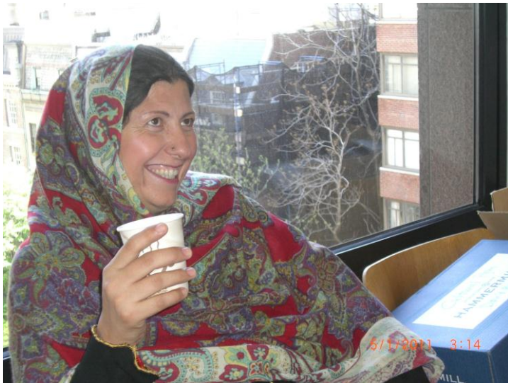
د ایشیاء سوسایټی دفتر