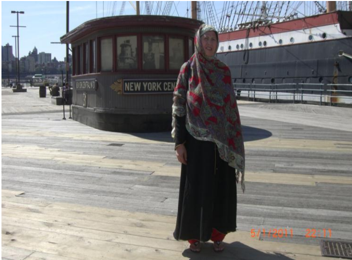
نيو يارک کي د سمندر د سيل پر مهال