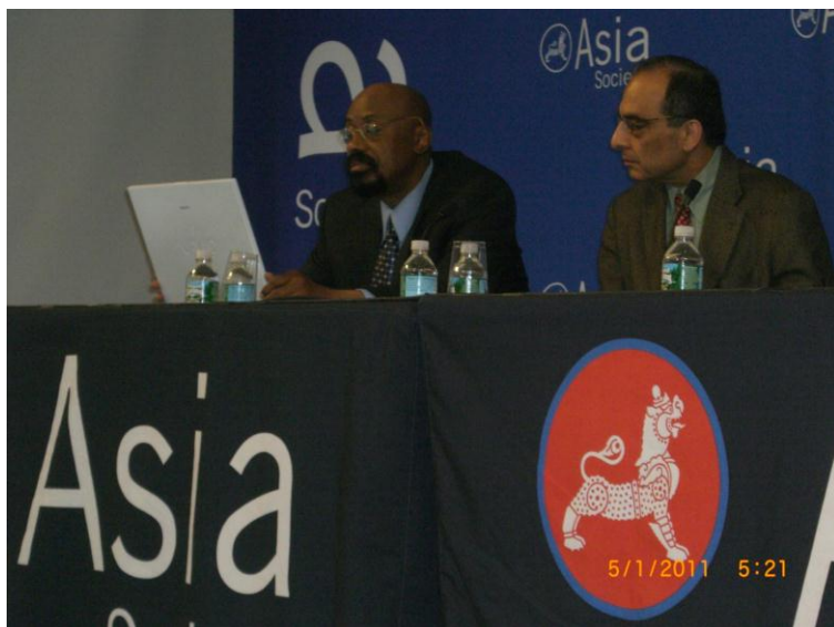
ددي دستوري يو بل عكس