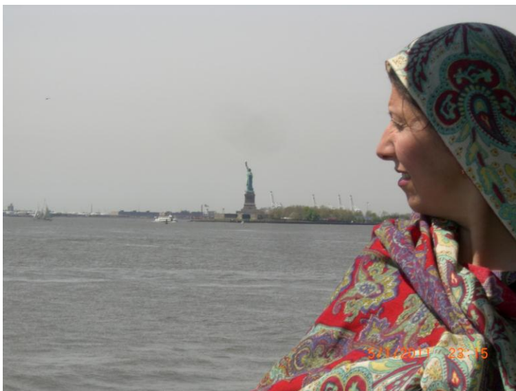
يو بل عکس د سمندر د غاړې