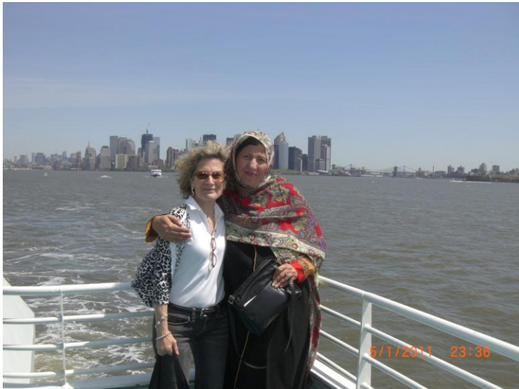
زه او پيني اوجيده