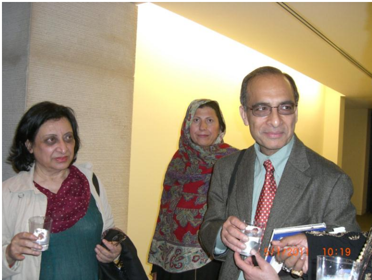
فهمیده ریاض وقاص خواجه او حسینہ گل، پہ نیو یارک