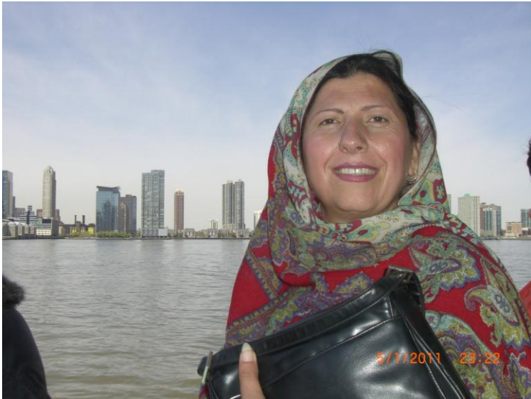
د بلي غاري سيل