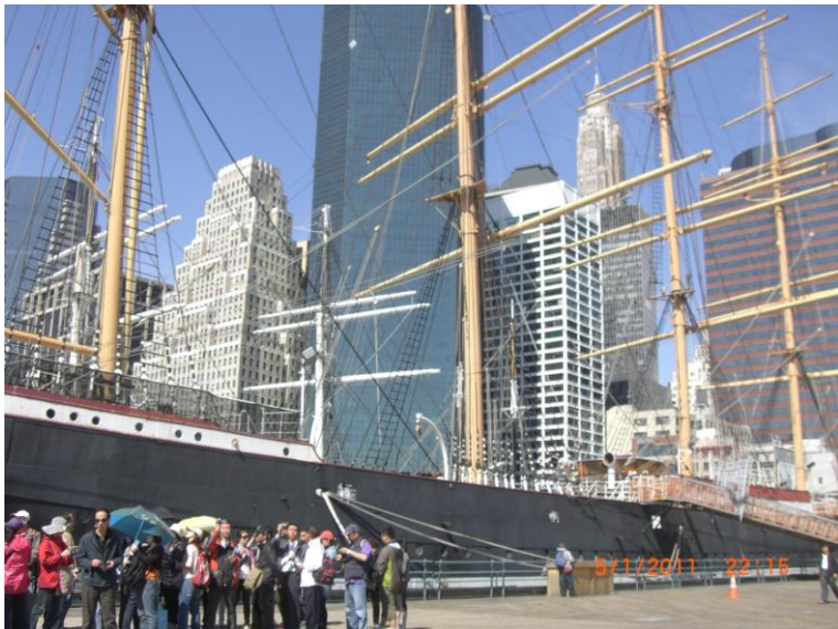
د سمندر د غاړي يو بل عکس