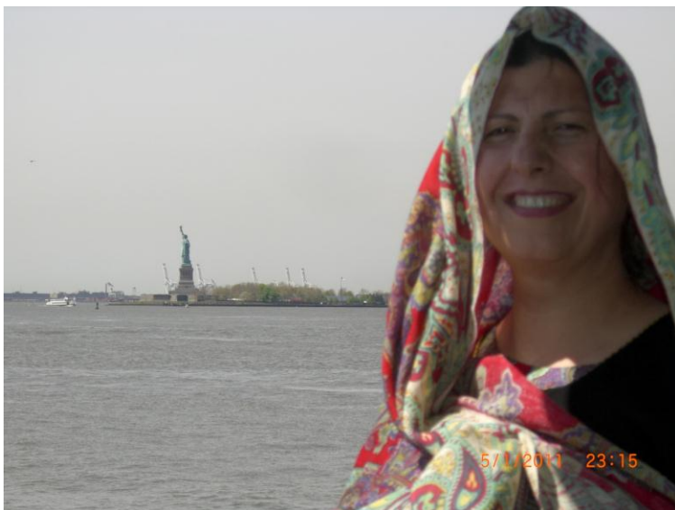
د سمندري هواگانو په ټيل نا ټيل کې