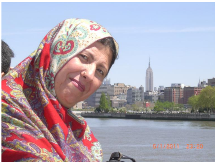
نیو یارک بنار د کشتی سیل او سمندر غاره