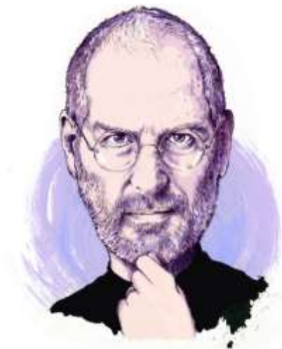
Steve Jobs 1955-2011

نن زه ډېر خوښ یم، چې تاسې د نړۍ په یوه غوره پوهنتون کې درس وایئ او نن مو د فراغت ورځ ده. زه له پوهنتون څخه نه یم فارغ شوی. نن غواړم تاسې ته د خپل ژوند کیسه وکړم، ډېره اوږده نه ده، یوازې درې کیسې دي.