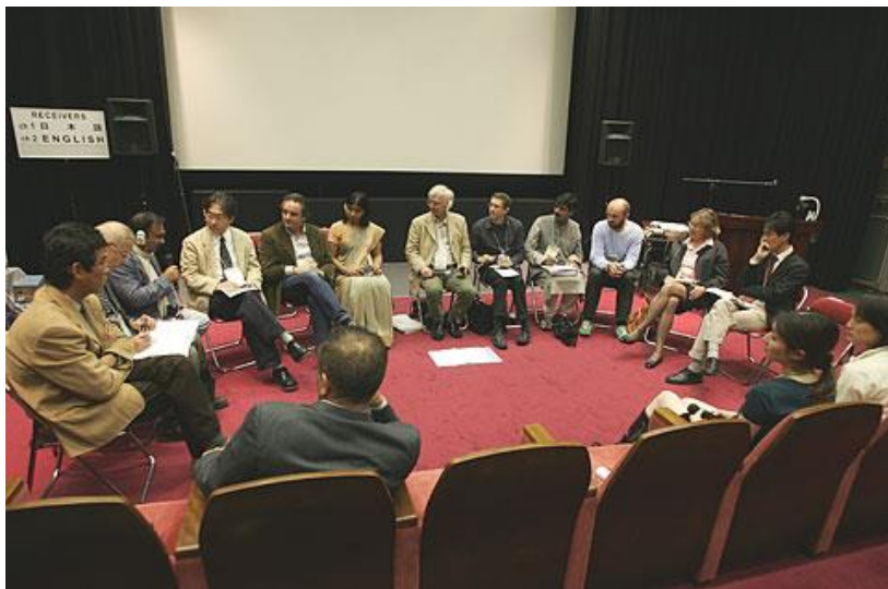
د NHK په تالار کې د اولاد او نورو فلمونو تر نندارې وروسته پر فلم باندې د بحث په دوران کې