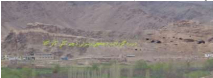
عکاس: محسنسیم رسا د اطلاعاتو او فرهنگ ریاست د فرهنگي میراثونو د ساتنې مدیر

نوموړې کافر کلا د چتو په کلي کې موقعیت لري له دې امله یې خلک د چتو د کافر کلا په نوم یادوي دا لرغونې کلا د یوې اوږدې او لوړې غونډۍ په سر ودانه شوې ده، د دې کافر کلا جنوب لوري ته د جلگې ولسوالۍ عمومي سړک پروت دی په عمومي توګه د نوموړي کافر کلا درېیو اړخونو ته زرغونه سیمې او باغونه دي یوازې دا غونډۍ د لویدیځ لور ته له لوی غره سره تړلې ده.