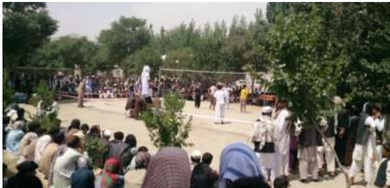
په وردگو کې د والیبال یو انځور

د دواړو ستنو تر منځ یو جال تړي د جال لور والی او ټیټوالی د دوی په خپل لاس کې دې خو د دوو مترو نه یې په پورته هوا کې تړي جال او سپینیز نه وي او د نرمو تارونو څخه جوړیږي.