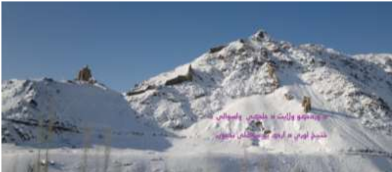
د وردگو ولايت د جلگې ولسوالۍ د کنج لويې د ادا خېلو کلي ښارگوټي

دا لرغونې ښارگوټي د وردگو ولايت د جلگې ولسوالۍ د کنج د کلي په ساحه کې د عمومي سرک په سر پورت د دې لرغوني ښارگوټي ختيځ ته د موکې کلي، لوېديځ ته يې د ادا خېلو کلي، شمال ته يې د لوی غر او دښته او جنوب ته يې د کنج کلي پروت دی.