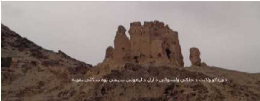
د وردگو ولايت د جلگې ولسوالۍ د ارگ د لرغونې ښارگوټي يوه ښکلې لويه