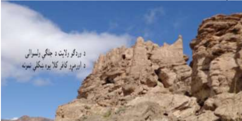
عکاس: محمد نسیم رسا د اطلاعاتو او فرهنگ ریاست د فرهنگي میراثونو د ساتنې مدیر

کړي دي. د نوموړې کافر کلا په داخل کې په دېوالونو باندې داسې نقشې او رسمونه کارېل شوي چې په لیدو یې خلک هک پک پاتې کېږي او د پخوانۍ زمانې په نقاشانو او معمارانو باندې آفرنی وايي.