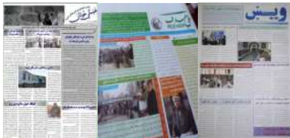
د وردگو اطلاعاتو او فرهنگ ریاست له آرشیف