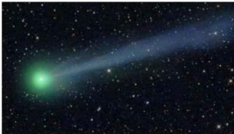
« وَالنَّجْمِ إِذَا هَوَىٰ * مَا ضَلَّ صَاحِبُكُمْ وَمَا غَوَىٰ . » ( النجم ، ۵۳ / ۱ - ۲ )