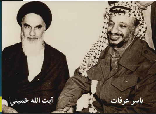
آيت الله خميني