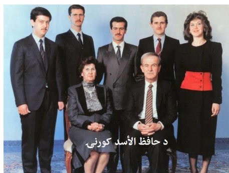
د حافظ الأسد کورنۍ