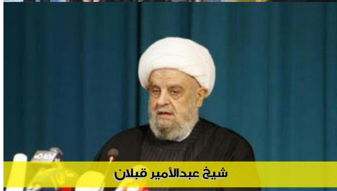
شيخ عبدالامير قبلان