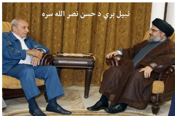
نبيل بري د حسن نصر الله سره