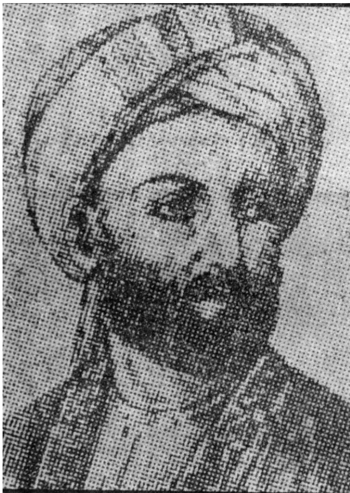
Prince Ayub son of Timur Shah شہزادہ ایوب فرزند تیمورشاه