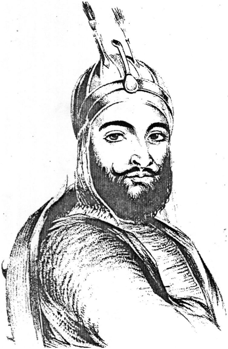
Sardar MAHOMED AKBER KHAN وزیر محمد اکبر خان