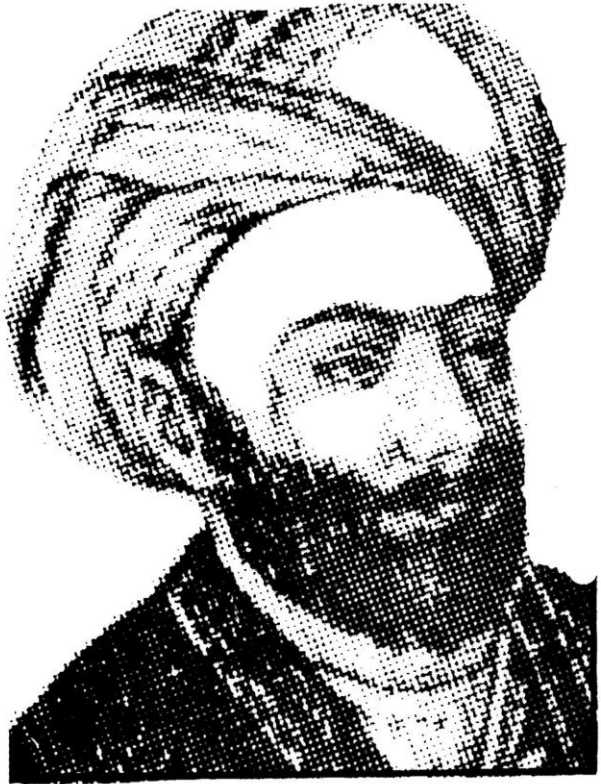
سردار پردل خان Sardar Pur Dil Khan Ruler of Kankahar