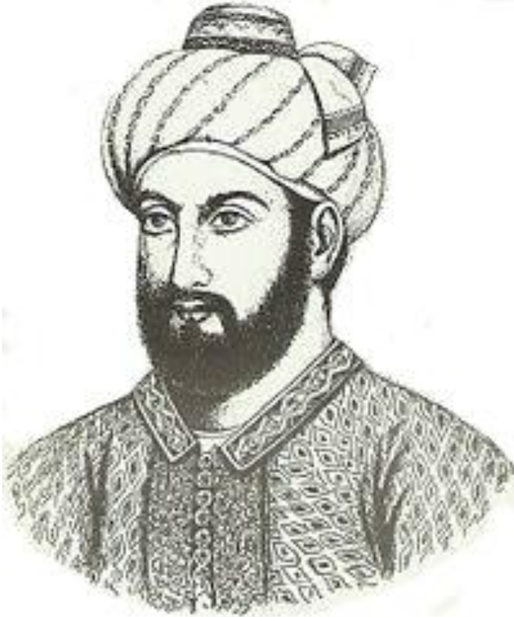
Timur Shah Durrani