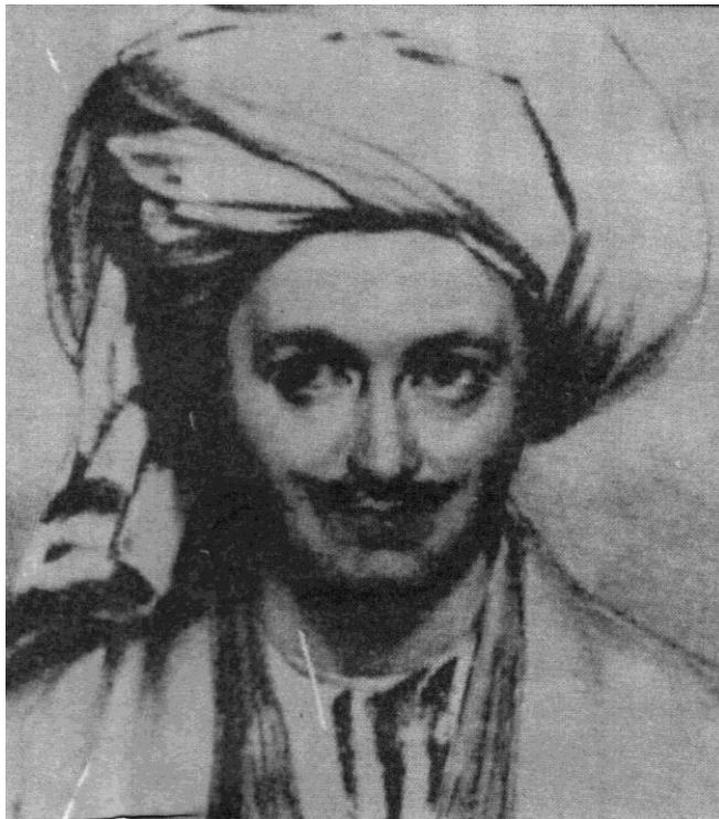
Sir Alexander Burnes British political agent in Kabul in Afgan dress