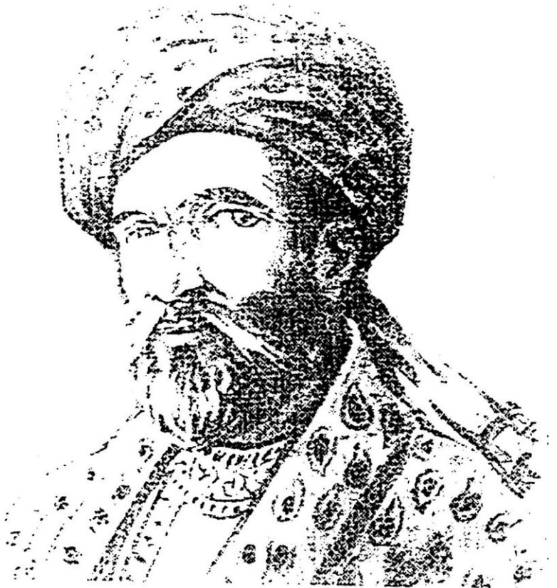
Sardar Kohan Dil Khan سردار كهنديل خان