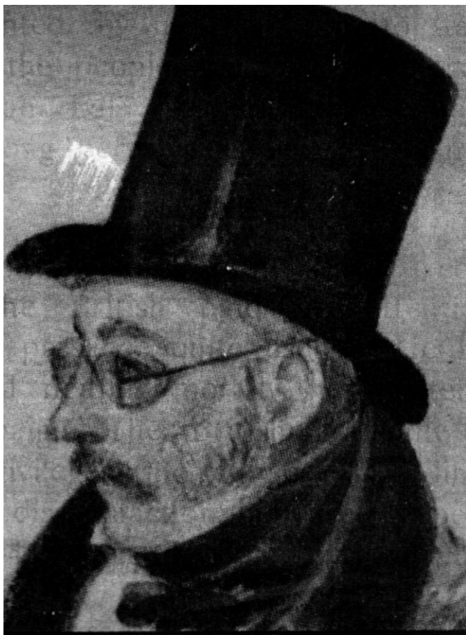
Sir William McNaughten سر ویلیام مکناٹن