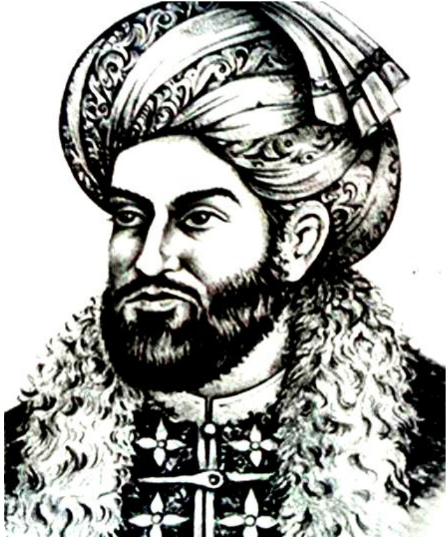
Ahmad Shah Durrani Founder of Modern Afghanistan لوی احمد شاه بابا