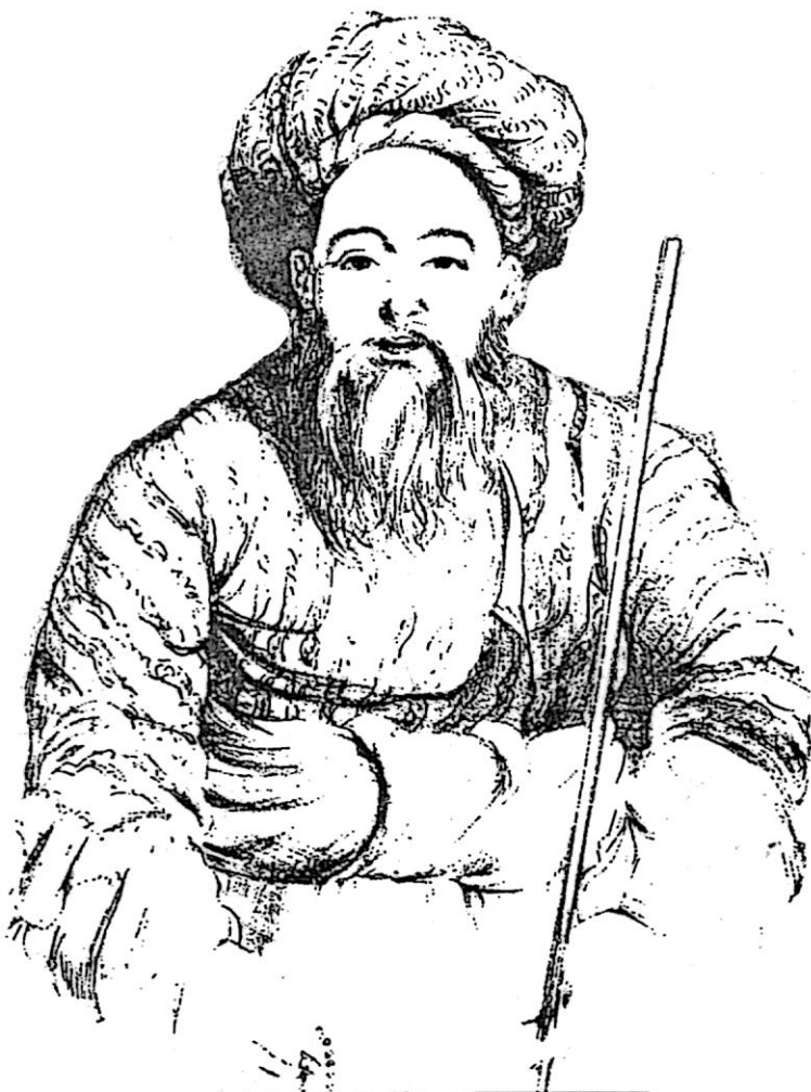
قاضی محمد حسین (نمایندهء شاه شجاع) QUAZI MAHOMED KHAN