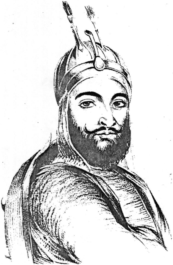
Sardar MAHOMED AKBER KHAN وزير محمد اکبر خان