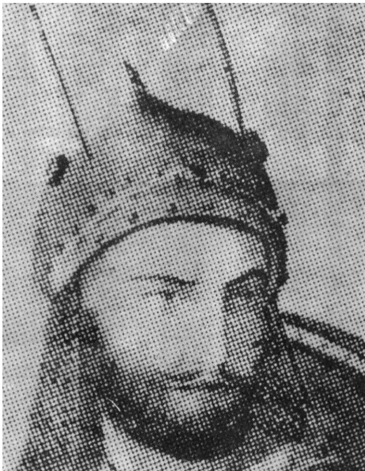
Sardar Sher Dil khan Ruler of Kandahar سردار شیردل خان