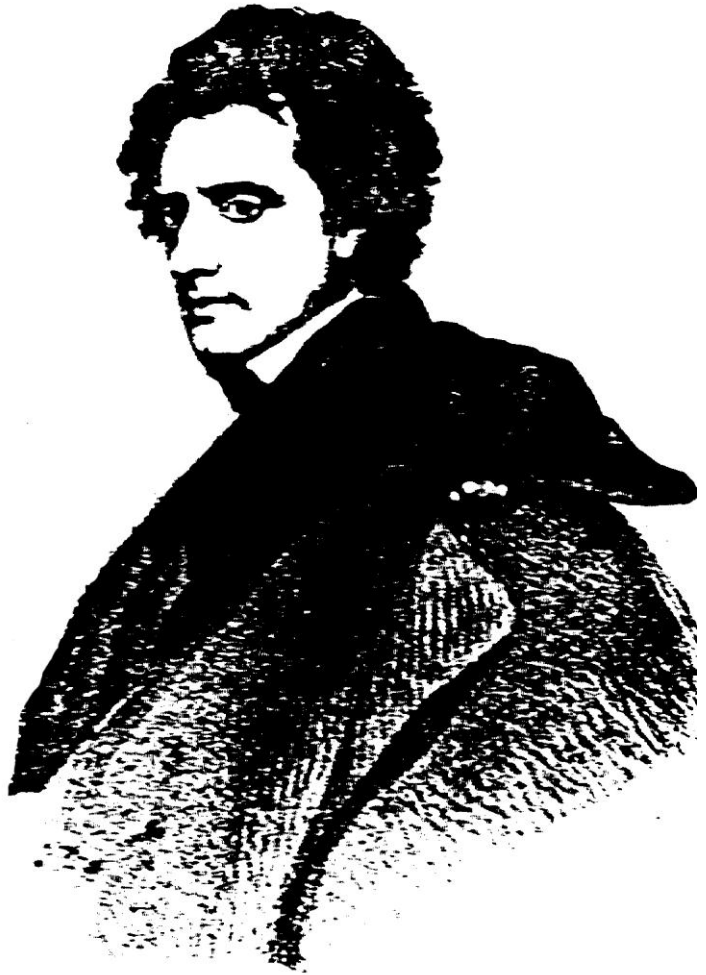
SIR JOHN McNEIL BART سر جان مکنیل بارت