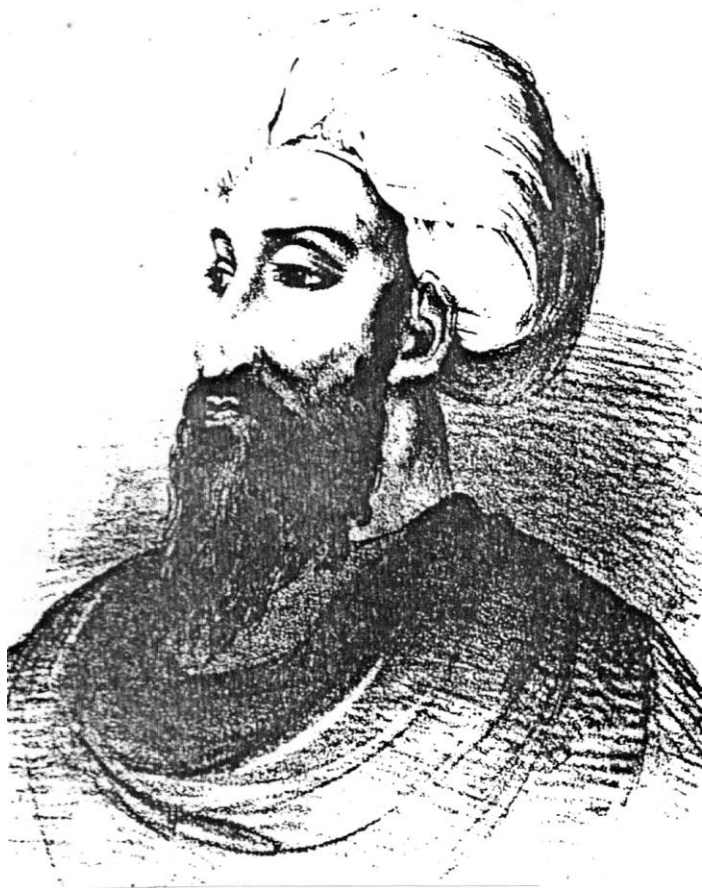
Amir Dost Mahammad Khan 1836-1839---1842-1863 امير دوست محمد خان