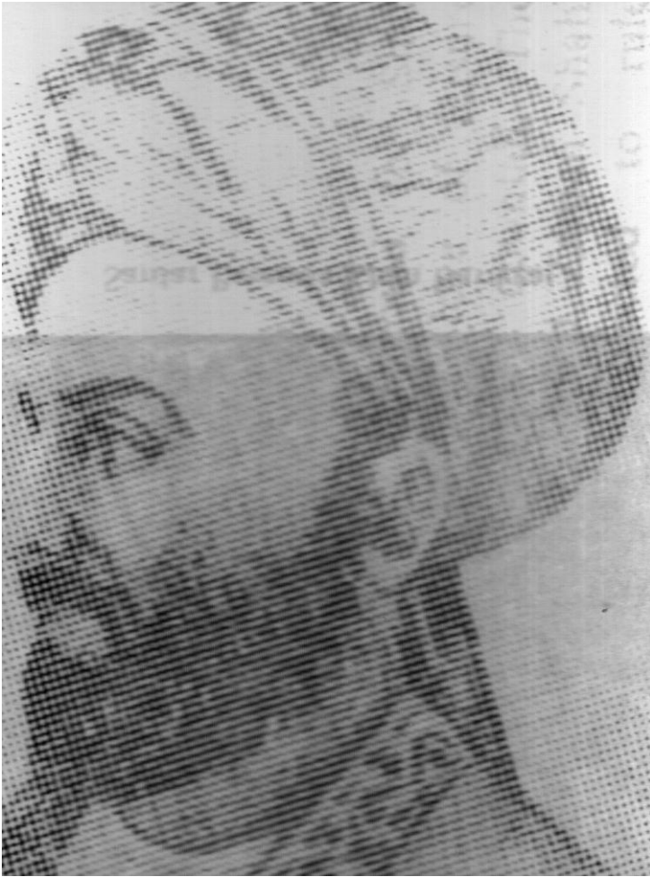
سردار محمد عظیم خان ولد سردار محمد پاینده خان Sardar Mohammad Azim Khan