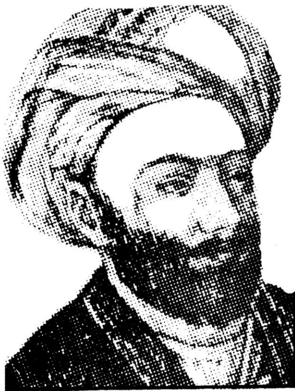
سردار پردل خان Sardar Pur Dil Khan Ruler of Kankahar