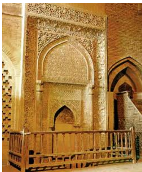
محراب مسجد جامع اصفهان

در مورد محراب این مسجد اوضاع بسیار خنده دار است چون کپی برابر اصل محراب مسجد جامع اصفهان را در اینجا می بینیم که دقیقا ثبت با سند مطابقت دارد .