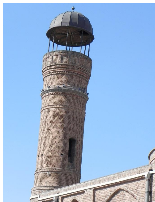
عکس بالا مربوط به مناره سمت راست بنا می باشد