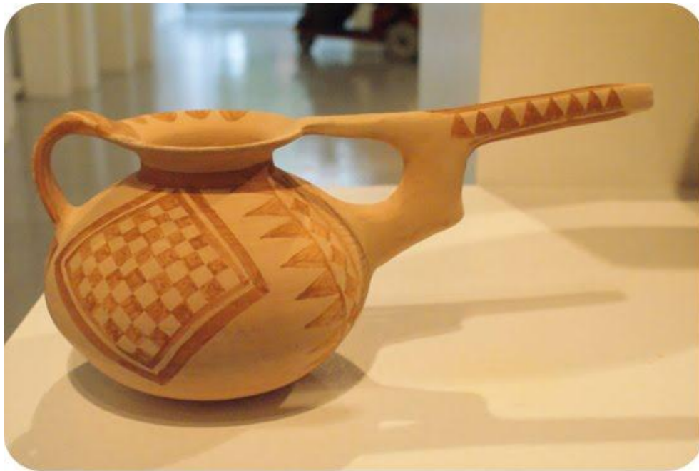
«سفال مربوط به تپه سیلک»