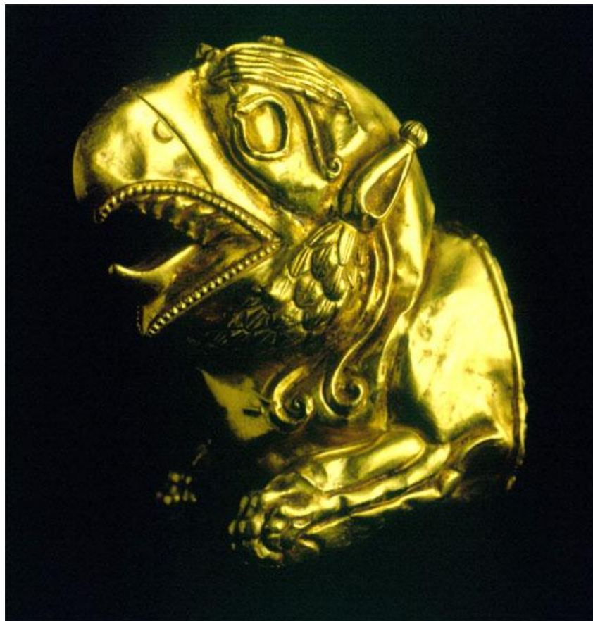
«قدحی زرین مربوط به زیویه»

آیا سرزمینی را می شناسید که تمامی شهرهای باستانی اش به آتش کشیده شده باشد و جنازه های مردمانش بدون دفن پراکنده و آثار هنری شان نظیر آنچه در بالا آمد بدون مدعا رها شده باشند !!!؟؟؟ به شهادت تاریخ چنین قتل عامی در هیچ زمانی و در هیچ جغرافیایی تا کنون اتفاق نیفتاده و نخواهد افتاد به طوری که 2200 سال در سکوت محض فرو رود!