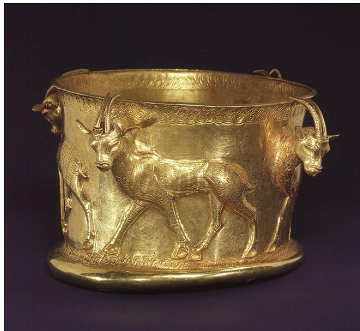
«قدحی زرین مربوط به مارلیک»