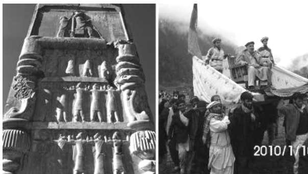
تخت روان والی ولایت نورستان (ننگرهار) در افغانستان بر دوش مردم، روایتی زنده از سنگ‌نگاره‌های هخامنشی تخت جمشید

ظلم و بهره‌کشی از مردم حتی در ظاهر خود نیز تغییری نکرده است. شباهت‌ها بسا در جزئیات حیرت‌انگیزند، چنانکه ظلم در طول تاریخ تفاوت چندانی نکرده است. کلاه، لباس و فرش‌هایی که حاکمان زیر خود انداخته‌اند، و کلاه، دستار و دامن مردمی که در هر دو تصویر حامل تخت هستند.