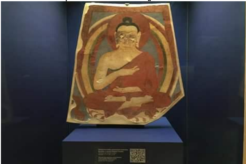
په کابل میوزیم کې پروت په لوگر کې موندل شوی رنگین بودهي عکس