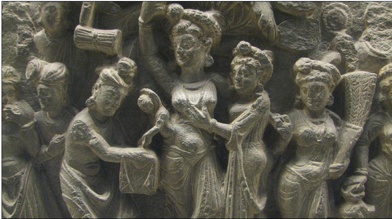
په ټېکسلا کې تر لاسه شوي بودهي دور ډبريني مجسمې