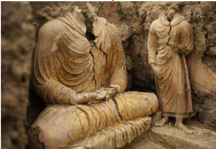
د افغانستان په لوگر ولایت کې د مس عینک په کیندنې کې موندل شوي د بده لرغوني خاوريني مجسمې