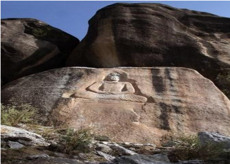
د سوات په جان آباد کې پریوه پر شه د بدها لرغونې مجسمه