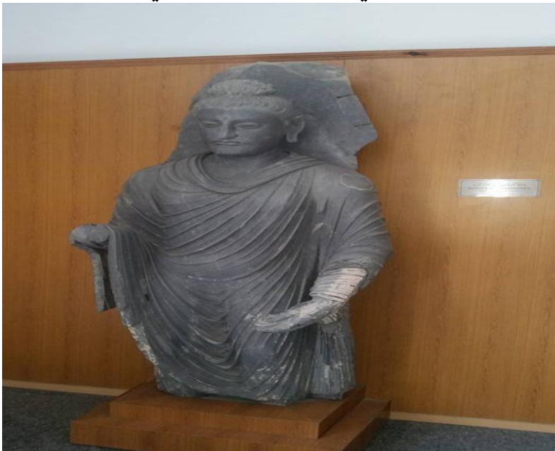
په میوزیم کې پرته د گوتېم بده لرغونې مجسمه