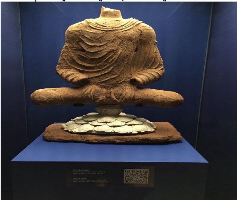
په کابل میوزیم کې پروت په لوګر کې نني موندل شوي بودهي مجسمه