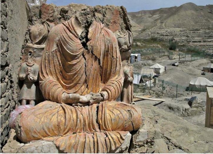
د افغانستان په لوگر ولایت کې د مس عینک په کیندنې کې موندل شوي د بده لرغونې خاورینه مجسمه