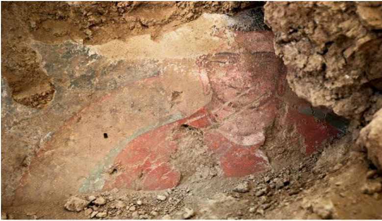
په افغانستان کې موندل شوی یو رنگین بودهي عکس