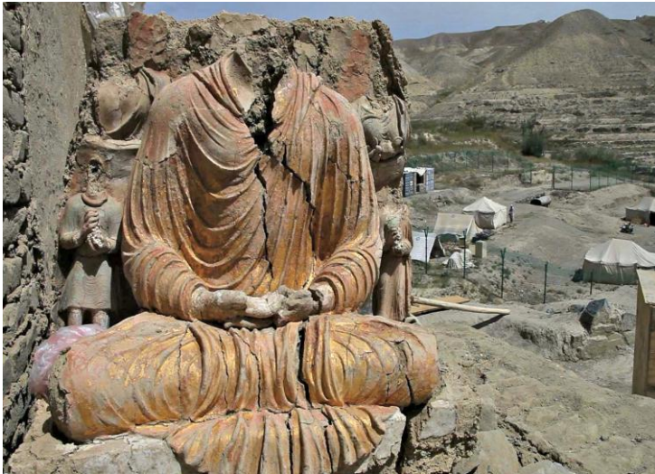
د افغانستان په لوگر ولایت کې د مس عینک په کیندنې کې موندل شوي د بده لرغوني خاورينه مجسمه