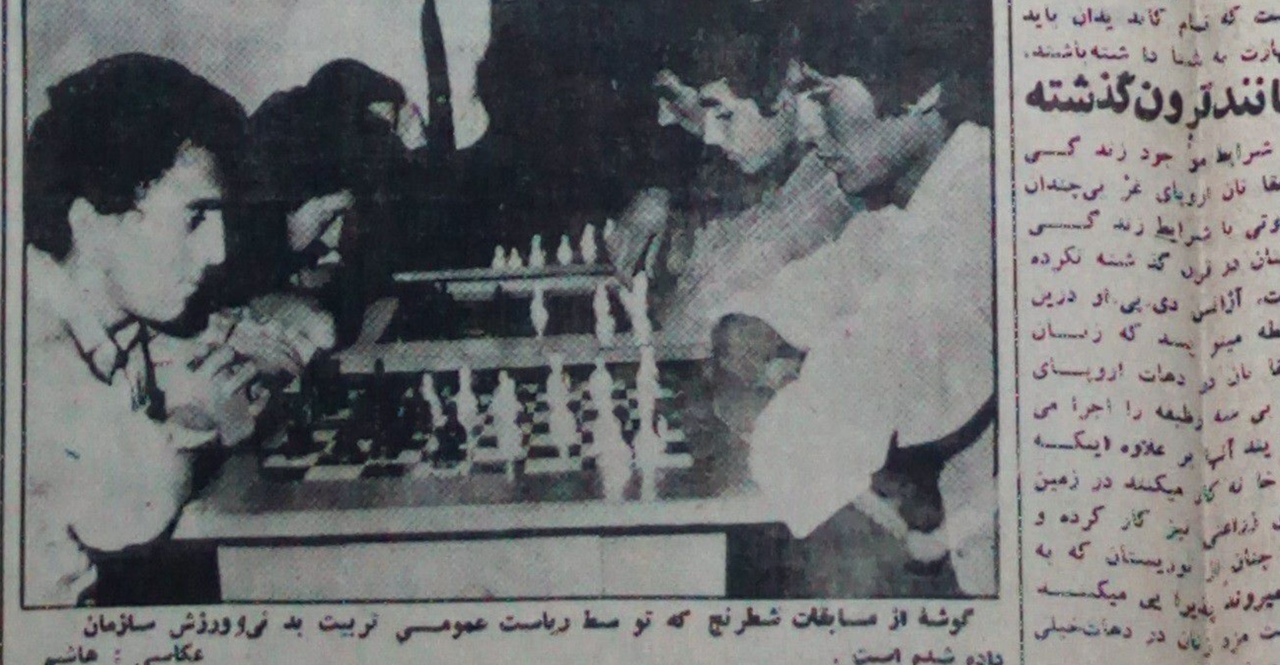
گوشه از مسابقات شطرنج که توسط ریاست عمومی تربیت بدنی و ورزش سازمان داده شده است.

روزنامه ((اکسون)) چاپ تونس اعلان عجیبی را نشر کرده که موجب نگرانی خوانندگان آنرا فراهم نموده است. روزنامه مذکور نوشته است که کمپنی هواپیماهای بحرین به استیوردیست های ما هر در خطوط پرواز خود خارج ضرورت دارد شرط کمپنی مذکور این است که تمام کابین باید مهارت به شما داشته باشند. ماند درون گذشته شرایط موجود زندگی دهقانان اروپای غربی چندین تفاوتی با شرایط زندگی ایشان در قرن گذشته نکرده است. آژانس دی بی او درین رابطه میگوید که در دهان اروپای غربی سه رطبه را اجرا می نمایند آنها بر علاوه اینکه در خانه کار میکنند در زمین های آرزایی نیز کار کرده و هم چنان در یورپستان که به ده میروند پذیرا می میکنند دست مزد دهان در دهان خیلی کم میباشند.