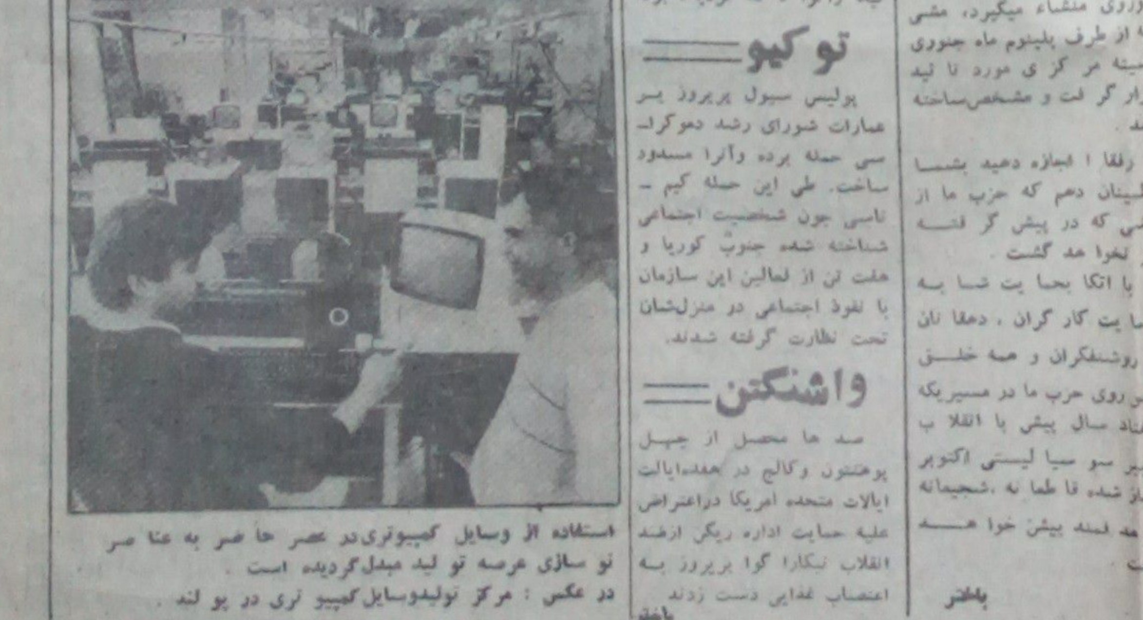
استفاده از وسایل کمپیوتری در عصر حاضر به عا ضر نو سازی عرصه تولید مینماید گردیده است. دو عکس: مرکز تولید وسایل کمپیوتری در پو لنه

متحد امریکا موسوم به عول قب کشتار دسته جنسی برای صلح بین المللی به نشر رسیده پاکستان تمام رسایل و تجهیزات لازم را جهت تولید اسلحه ذروی قلا آماده کرده است.