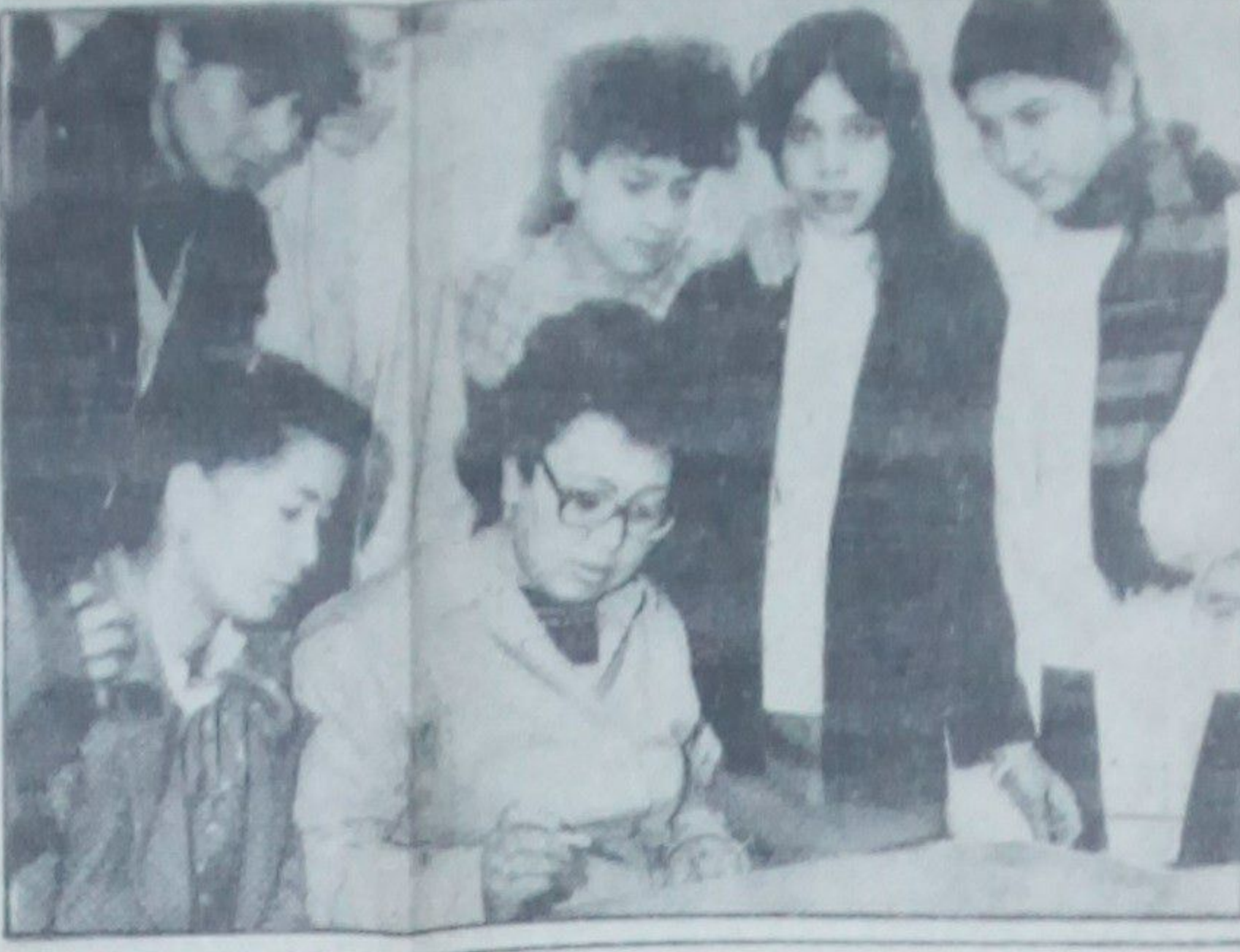
جلسه کمیته خبری بیروت...