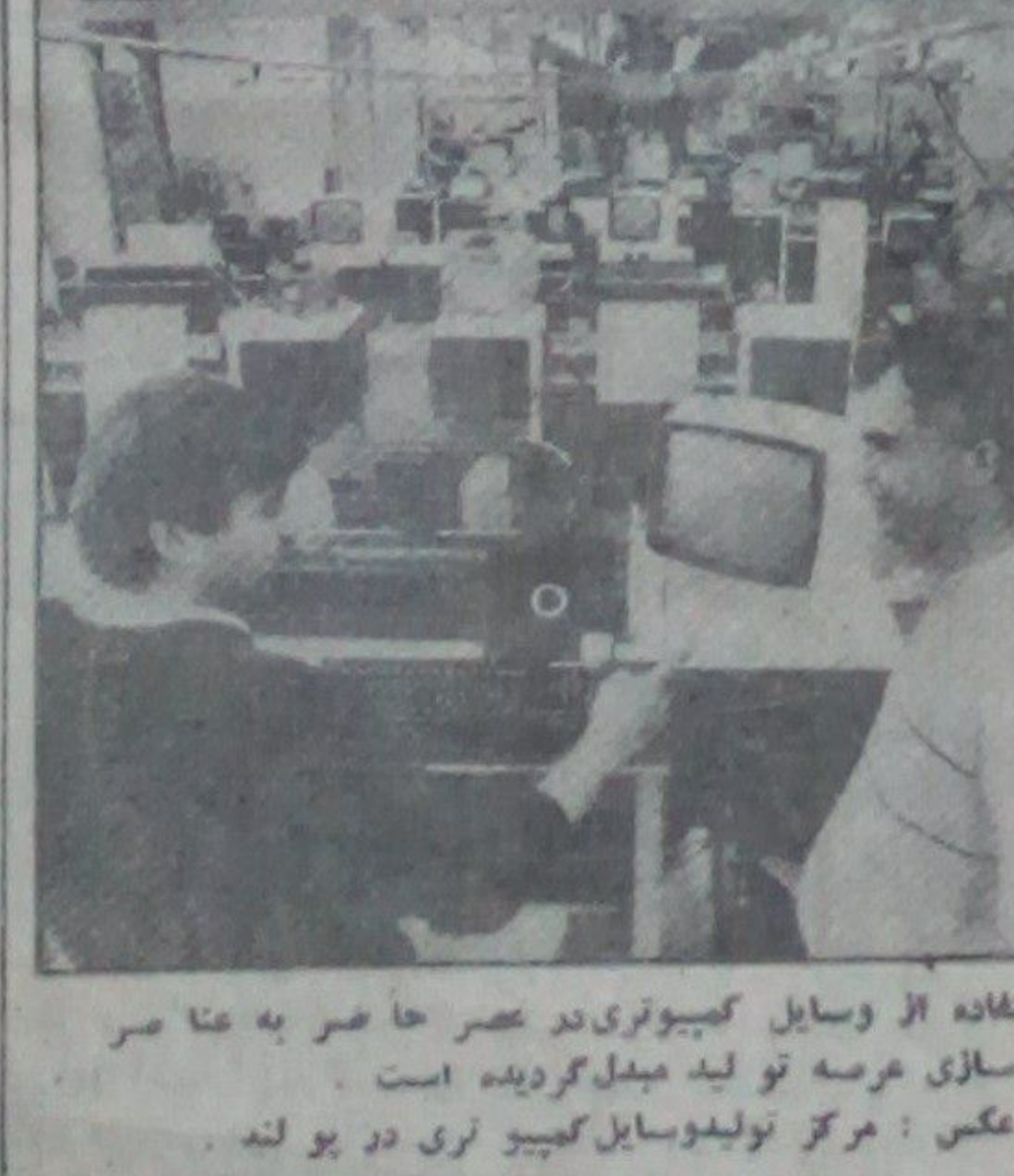
استفاده از وسایل کمپیوتری در عصر حاضر به عا صر نو سازی عرصه تولید مینماید گردیده است. دو عکس: مرکز تولید وسایل کمپیوتری در یو لنه

مجلس ملی لیکا راگسوا اعلامیه حکومت آن کشور را دایر بر تنهید حالت اضطراری سراسری لیکاراگوا تصویب نمود حالت اضطراری پار لمنت در رابطه با تو سهه اعمال ترور یستی ایالات متحده امریکا در سال ۱۹۸۲ نیکا راگوا را لغو گردیده بود.