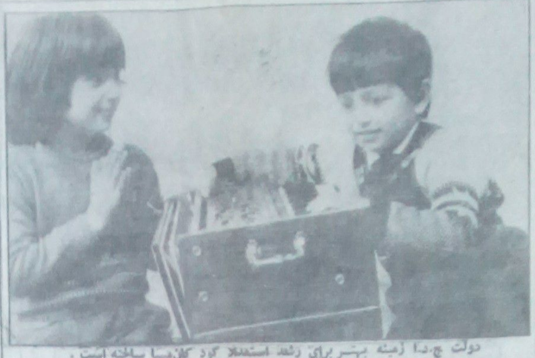
دولت چ.دا زمینه پیشرو برای رشد استفاده کرد کلمه میا ساخته است. دو عکس: افلاک کودستان وزیر ابر خان، عکاسی پایه خان

خدا شده پدر میسازد که این تا شی از شنا پ پیشی در لبه آن است و فلم در ۱۴ روز شوت گردیده اینجا و آنجا درین آفرینش هنری سبب ل ها و نداد ما تیسز پیشم میاید که بجای حرف ویا تو که پیا ن - تصویر صریحی دارد - مثلا چهره و لاکه بر لفل و کلبه دالبر این امر و پیاگر امر صبا منته است. فللی که باز میشود به منا به مشکلات نا شسی از جنگ و کلیدی که آزا باز بکنند تلویحی است برای