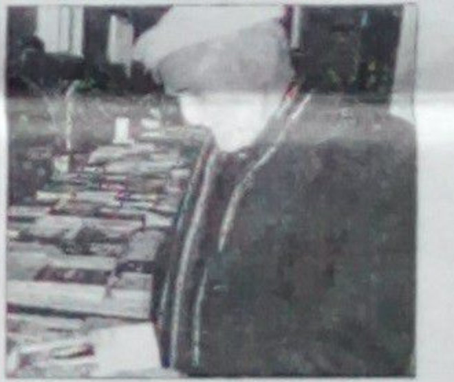
سمع الله تاره

در این نمایشگاه تعداد زیادی از ناشران خصوصی غرغه ها را ایجاد نموده و کتابهایی را که چاپ کرده اند در معرض نمایش گذاشته اند تا مردم از این کتابها