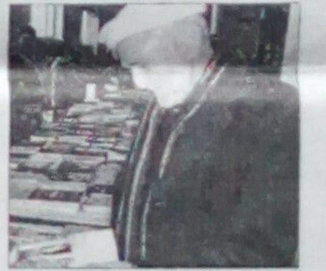
سمع الله تاره

در این نمایشگاه تعداد زیادی از ناشران خصوصی غرقه ها را ایجاد نموده و کتابهایی را که چاپ کرده اند در معرض نمایش گذاشته اند تا مردم از این کتابها