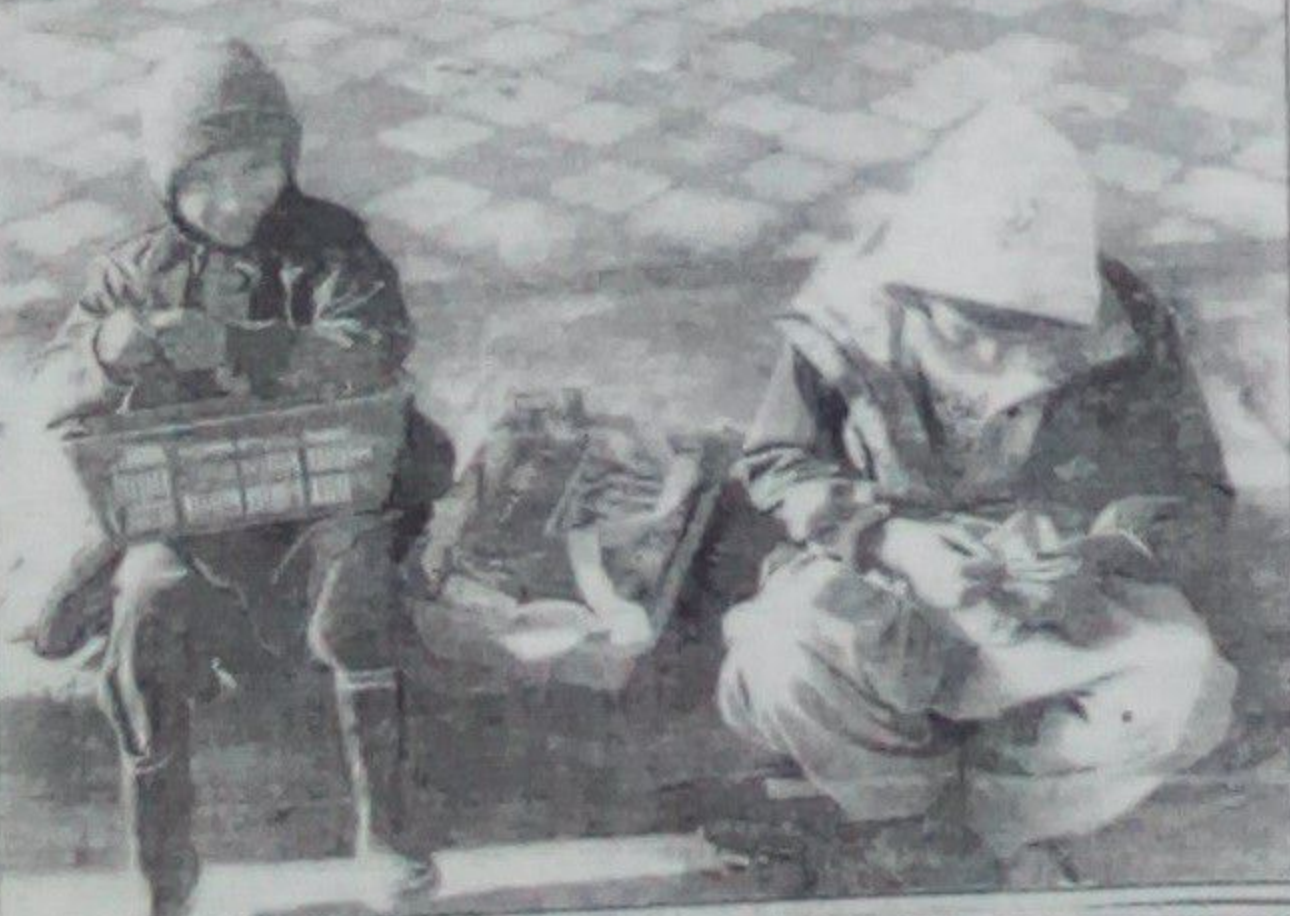
خبر داده می شود. ■