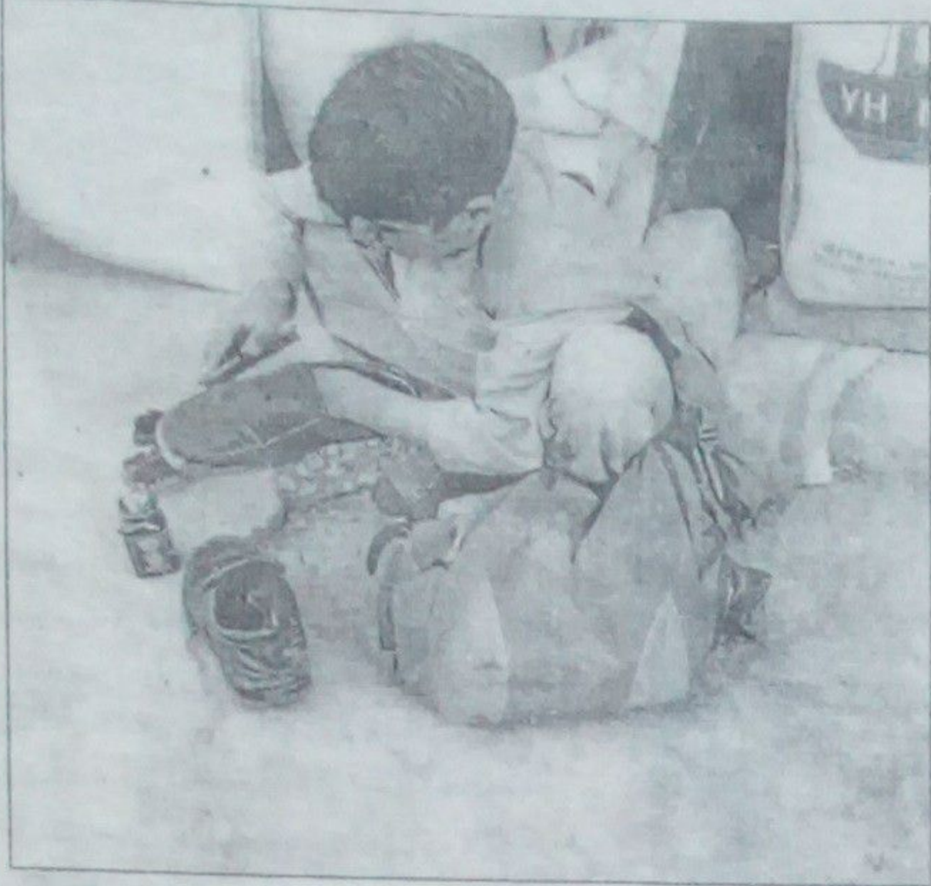
تهیه کننده: یوسف پرسی