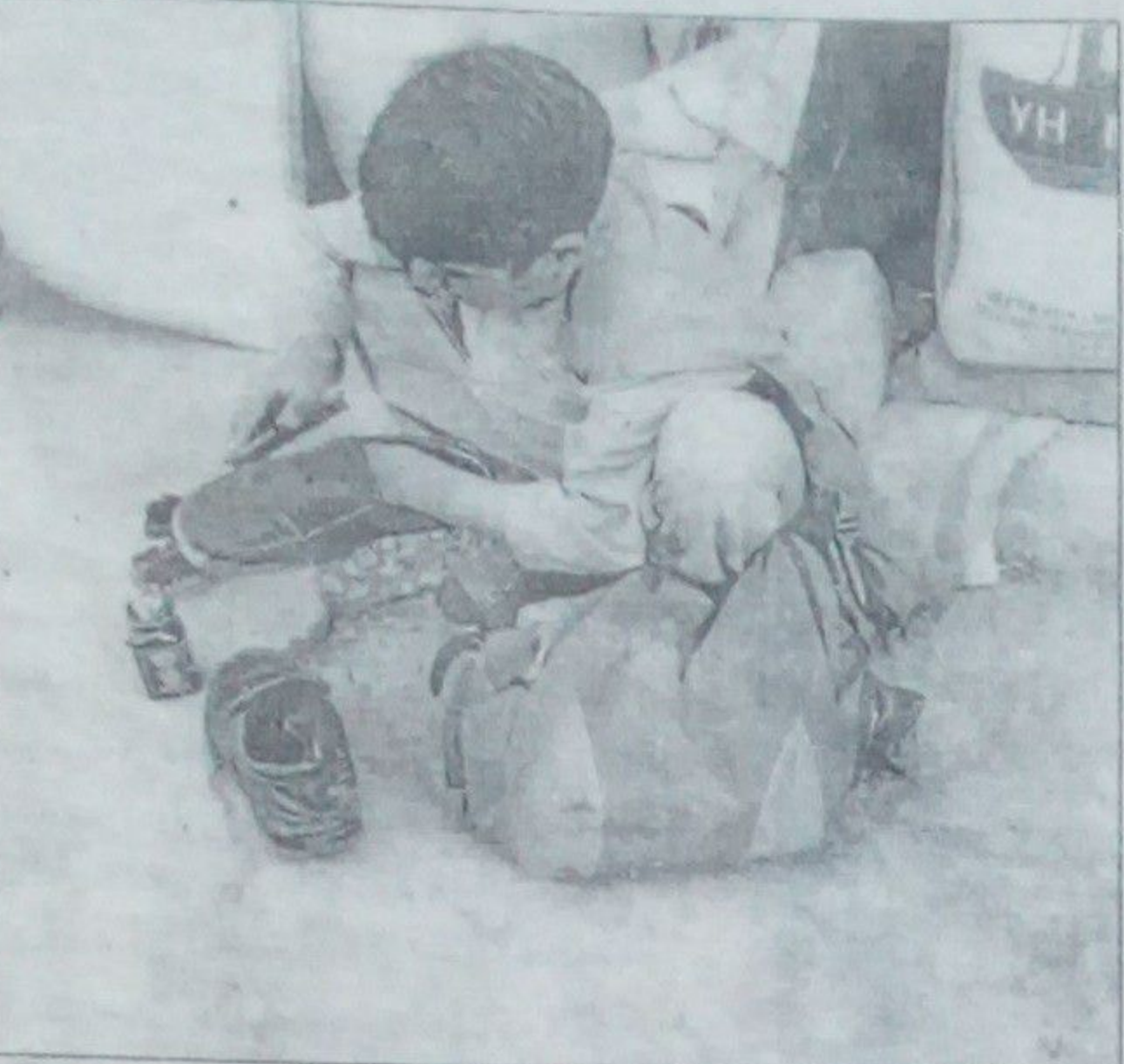
تهیه کننده: یوسف پوسی