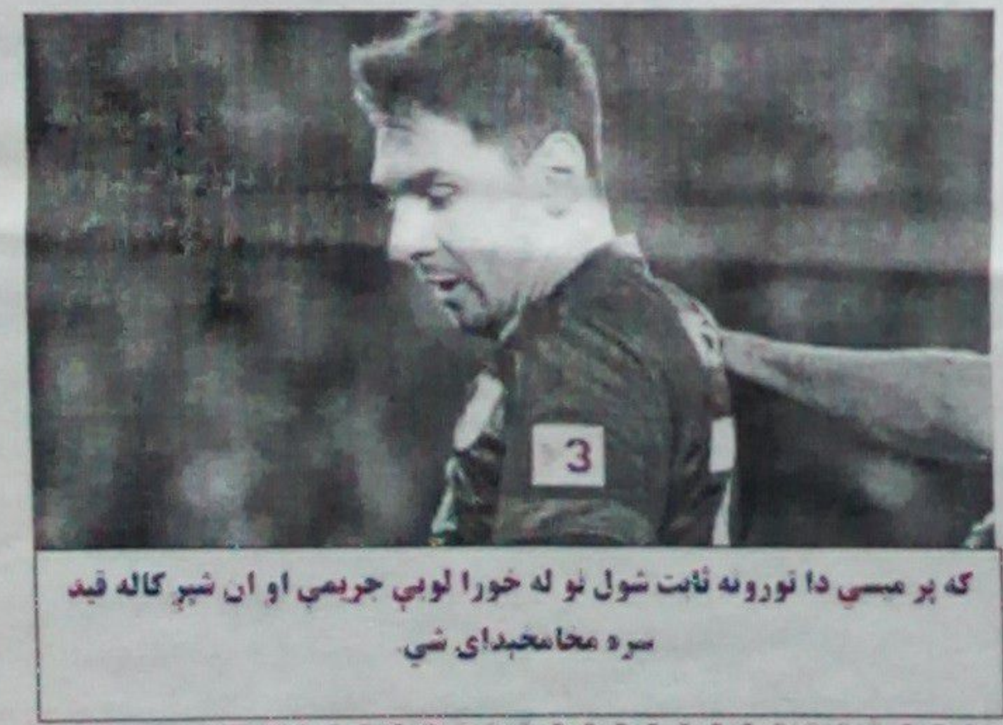
که پر ميسي دا نورو نه ثابت شول نو له حورا لوبې حريمې او ان شپږ کاله قيد سره مخامخېدای شي.

دغه کالني معاش دومره دی چې د نړۍ له حورا شتمنو لوبغاړو يې بولي څو ورځې وړاندې بارسلونا ته نږدې يوه څارنوال په محکمه کې د ميسي پر ضد شکايت ثبت کړ. رپوټونه وايي چې که چېرې قاضيانو دا شکايت ومانه نو له هغه وروسته به پر ميسي رسمي تور پورې کېږي پر ميسي او پلار يې دا شکايت شوی چې د