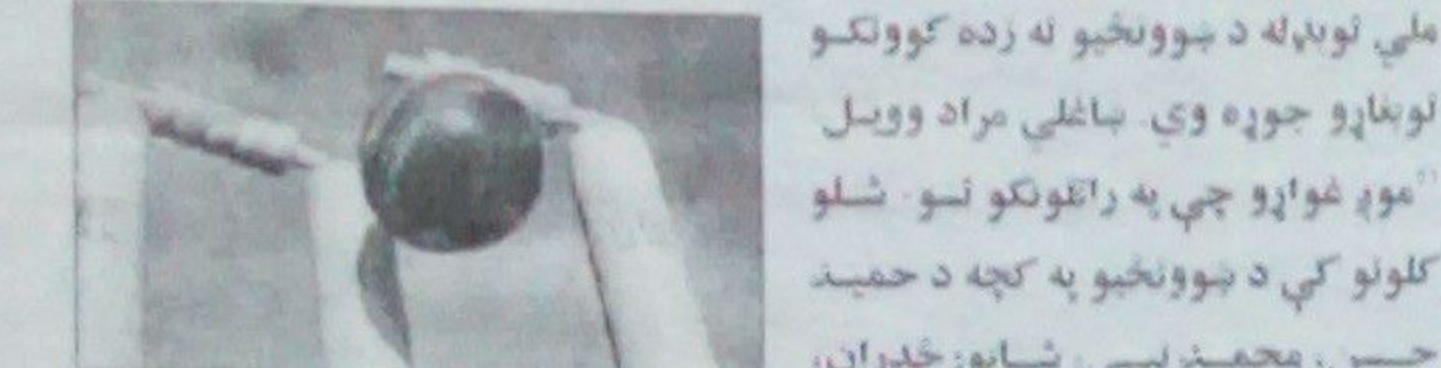
د افغانستان په اوسني ملي لوبډله کې ډیرو لوبغاړو له هیواده د باندې په خاص ډول په پاکستان کې د کډوالۍ پر مهال دغه لوبه زده کړې ده

کرېکټ په راتلونکي تعلیمي کال کې په کابل کې په ځینو بنوونځیو کې لندرس شي او وروسته به یو لوی لوبغالی وایي. د افغانستان په اوسني ملي لوبډله کې ډیرو لوبغاړو له هیواده د باندې په خاص ډول په پاکستان کې د کډوالۍ پر مهال دغه لوبه زده کړې دي. افغانستان هغه هیواد دی چې په نړۍ یو لسیزې کې د کرېکټ په برخه کې د پام وړ او خپرونکي لاس ته راوړلي لري، افغانانو دوه واري په نړیوالو شل اوریزو سیالیو کې لوبه وکړه او و خپلندل. د دې برخه یې په ۲۰۰۹ کال کې د کرېکټ د یو ورځنیو نړیوالو لوبو کولو امتیاز هم ترلاسه کړ، افغانستان په ۲۰۱۵ کال کې د کرېکټ یو ورځنی نړیوال جام ته د لار موندلو په موخه دراتلونکي اګست میاشت کې لیبیا ته ځي چې له دغه هیواد سره خپل بخت وازموي.