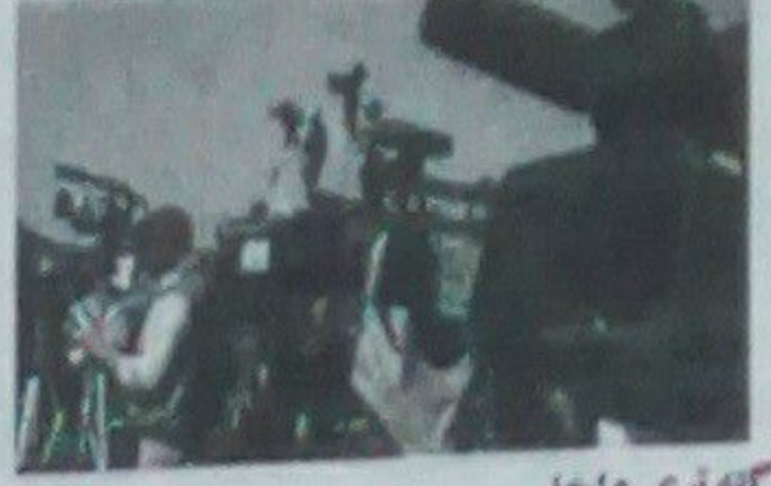
کله چې رښتني واخلې ۱- د معلوماتو وړاندي کول: رښتني هغه وسيلې دي چې خلک په ډله ييز ډول له پېښو څخه خبروي، پدې رښتني کولاي شي په پوره وخت کې په زرگونو او آن په ميلونونو خلکو ته معلومات ورسوي.

رښتني، ښو او زيارتالو، ښه وسيلې دي چې د جاني سختو فتنو لرونکو زمخ اړينې ټينگوي. اړه لري چې هر ازاد او بېلابېلو اکتشافاتو، کشفاتو، اختراعاتو او نوو پېښو په اړه د خلکو د پوهاوي او خبرواري له پاره زمينه برابروي. پاړسې هغه وسيلې دي چې د جاني دښمنو او خاصو خلکو زمخ اړينې ټينگوي په بل عبارت رښتني هغه کله چې رښتني دي چې د ټولني ټول فتنو په رښتني ډول کې رښتني ډول دي. ۱- د معلوماتو وړاندي کول: رښتني هغه وسيلې دي چې خلک په ډله ييز ډول له پېښو څخه خبروي، پدې رښتني کولاي شي په پوره وخت کې په زرگونو او آن په ميلونونو خلکو ته معلومات ورسوي. ۲- ډله ييزه زده کړه: رښتني ډوله ييزي زده کړې کولاي چې له هغو څخه کولاي شوې شي په عام لرونکي وسيلې، دي چې کولاي شي په عام ډول، چې د مختلفو وسيلو په واسطه خلک ته