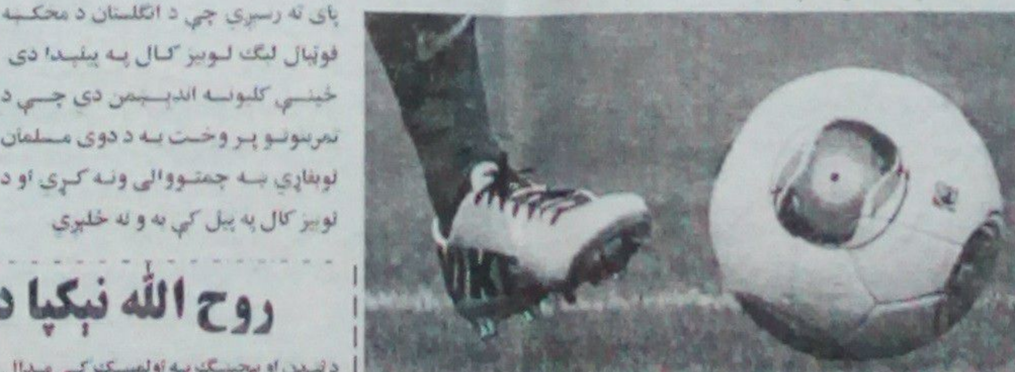
اوس ۲۰ مسلمان لوبغاړي دننه لوبه کوي چې د نړۍ له بېلابېلو هېوادونو راغلي دي.

تړون ته په لارښوونې سره یې ورسېد چې د لوی ځین مسلمانین وکړي دوی دواړه د سینګال مسلمانان دي چې یو یې تری اوس د لندن چلې کلب ته راغلي دي. دیمیا یا وایي دی د خپل مذهب په پل چلې فکر کوي او هرولې یې نه شي پنځه وخته لمونځ او روژه د ځینو فوټبال روزونکو په ګومان چې خپله مسلمان نه دي حورا سخت کار دی خو د لوبغاړو استعداد دغه روزونکي اړتیا چې څه و نه