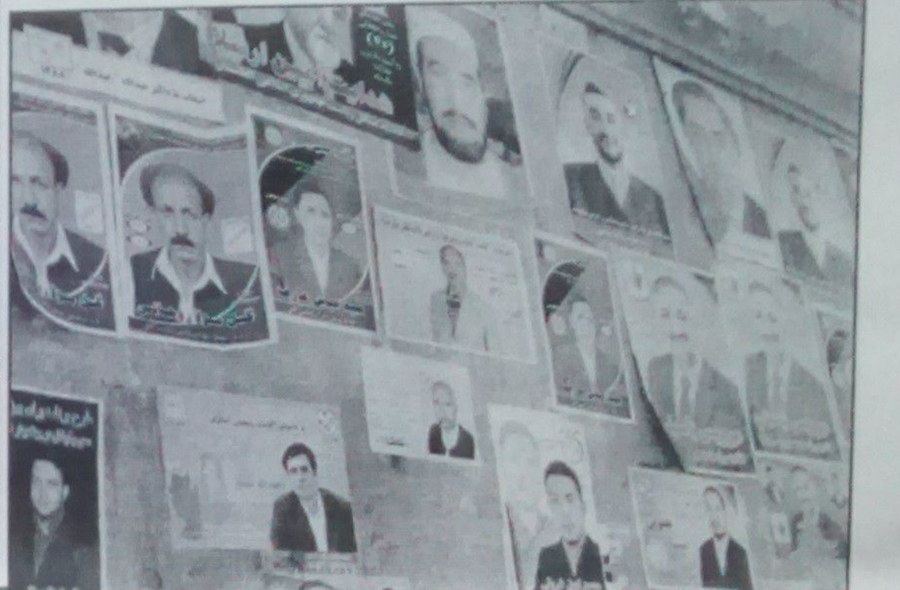
شکم نان شدیم، حالی جایشه

نیمه روز بود، با استفاده از بس شهری ملی بس روانه خانه بودم، در بس چند تا آدمهای که ابزار کار در دست داشتند و فهمیده میشد که گلکار و یا مرد کار باشند، نیز سوار موتر بودند و در یک ردیف جوکی نشسته بودند، یکی از آنها گفت: خدا روزی رسان اس، اگر کار غربی پیدا نشد، اما صاحب یک