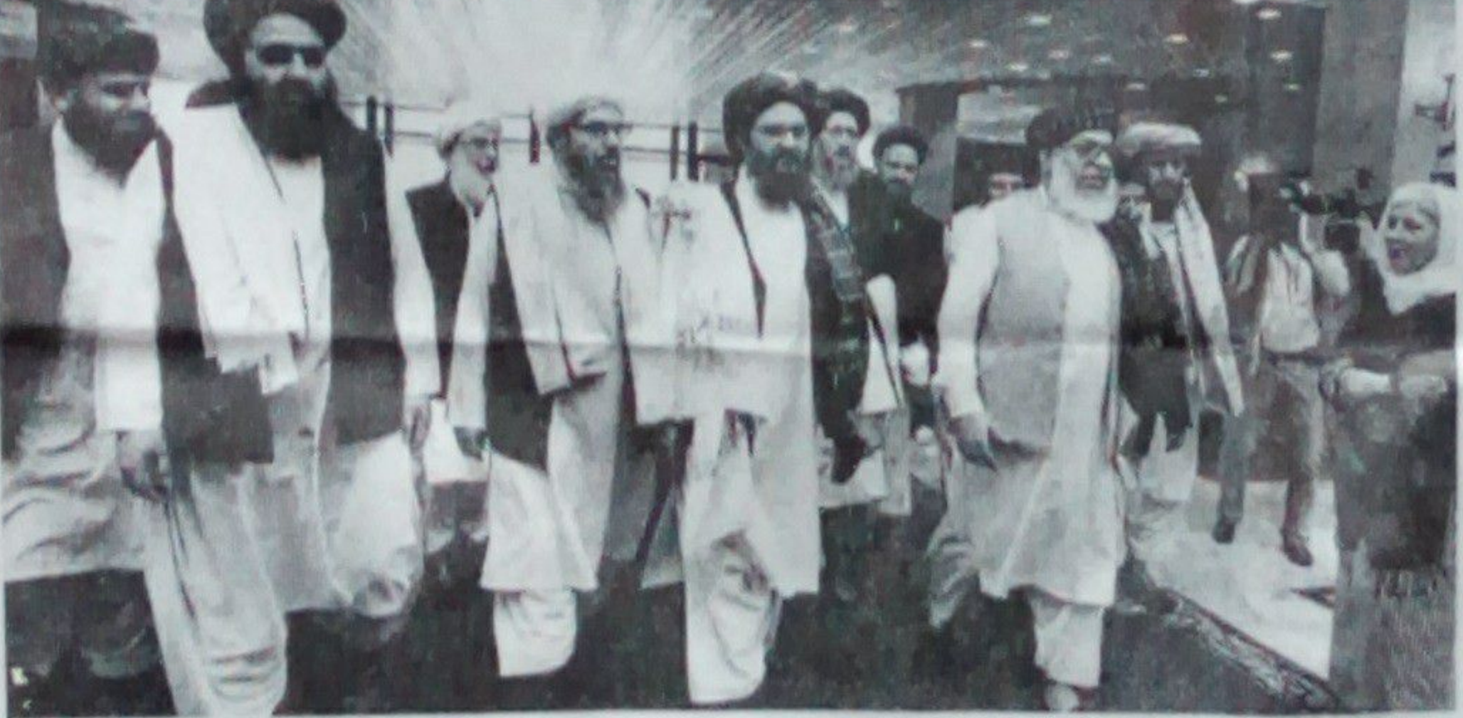
متخصص او مسلکي کسان شامل دي اندونيزيانه د طالب پلاوي سر:

يو شمېر رسنيو خبرو ورکړې، چې د زمري په ۴ مه طالب پلاوي د ملا عبدالغني برادر په مشري اندونيزيا ته سترگو، په دغه سفر کې طالب پلاوي د اندونيزيا له دولتي چارواکو سره د افغان سولې په اړه خبرې وکړې. اندونيزيا يو ستر اسلامي هېواد دی چې تېر کال په پسرلي کې د افغانستان سولې په اړه د پاکستان، افغان او اندونيزيا، نښي عالمانو کوربه وو او د افغان سولې په اړه مهم رول لوبولی شي. د طالب پلاوي په خبره شوې خبر يانه ۳ مخ