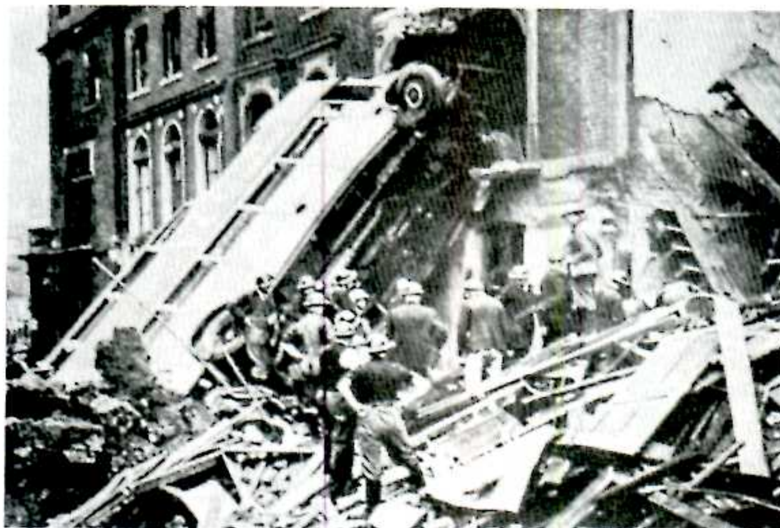
- اگوست ۱۹۴۰: جنگ هوایی بر فراز انگلستان شروع می شود. جنگنده های آلمانی مراکز صنعتی و مناطق مسکونی را بمباران میکنند اما بی نتیجه: نیروی مقاومت انگلستان شکست ناپذیر می نماید.