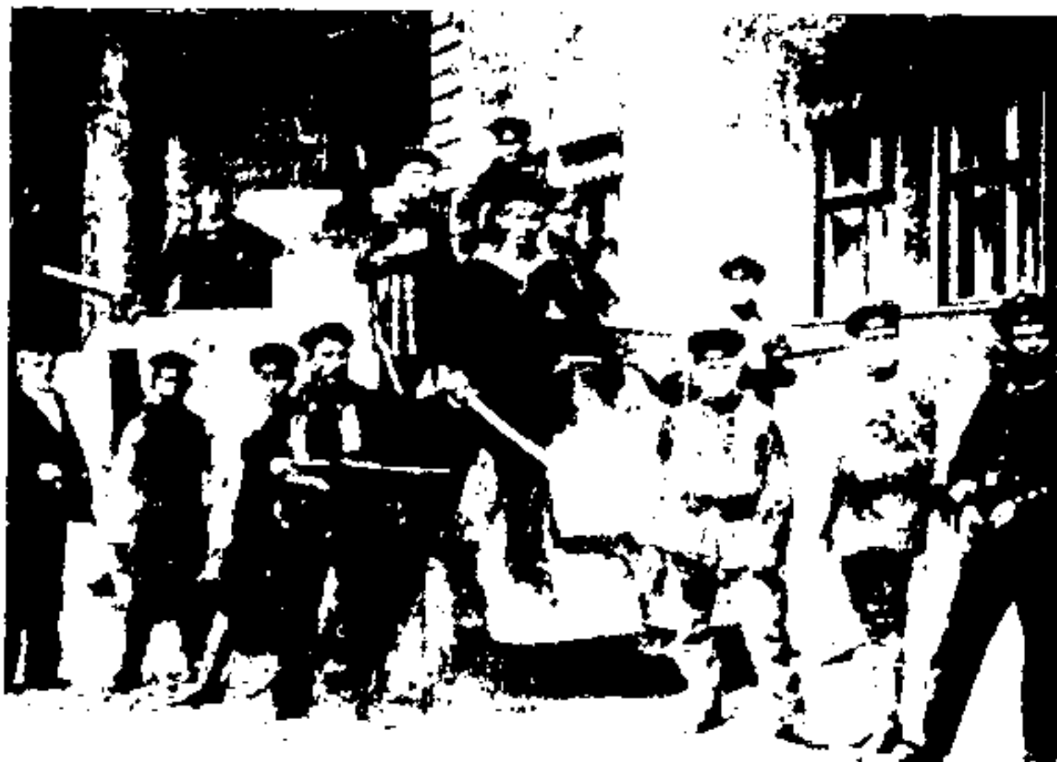
- انقلاب در برلن، نوامبر ۱۹۱۸: گروه اسپارتناتوس - سوسیالیست‌ان بود که اتحادیه‌های کارگری و سربازی قدرت را در دست بگیرند دولت مونت به رهبری فریدریش ایبرت (Friedrich Ebert) خواهان یک دموکراسی پارلمانی است. او در مقابل نیروی دریائی مردمی که در قصر شاه (شاهانه) مستقر شده بود، بقیه ارتش و سربازان داوطلب را گمارده است. (پایین) بعدها اولین طرفداران هیتلر را سربازان داوطلب تشکیل دادند.