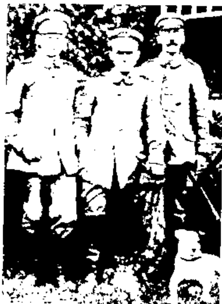
- هم‌دوره‌ای ششمورشو (Schürstroh) یک اتریشی در ارتش آلمان. هیتلر به عنوان خبرنگار هنگ (سمت راست) با هم‌دوره‌ای در فیلاندر (Hindler) ۱۹۱۶ تریر (Trier) نام سگی است که از جانب دشمن به سوی آنها فرار کرده بود. علیرغم تمام سختی‌ها هیتلر تا به انتها خوشحال بود. وطن او هنگ ۱۶ بود. حس وطن‌پرستی و اطاعت بی‌چون و چرا را از همان زمان خصوصیات (ایده‌آلهای) مقدسی برمی‌شمرد.