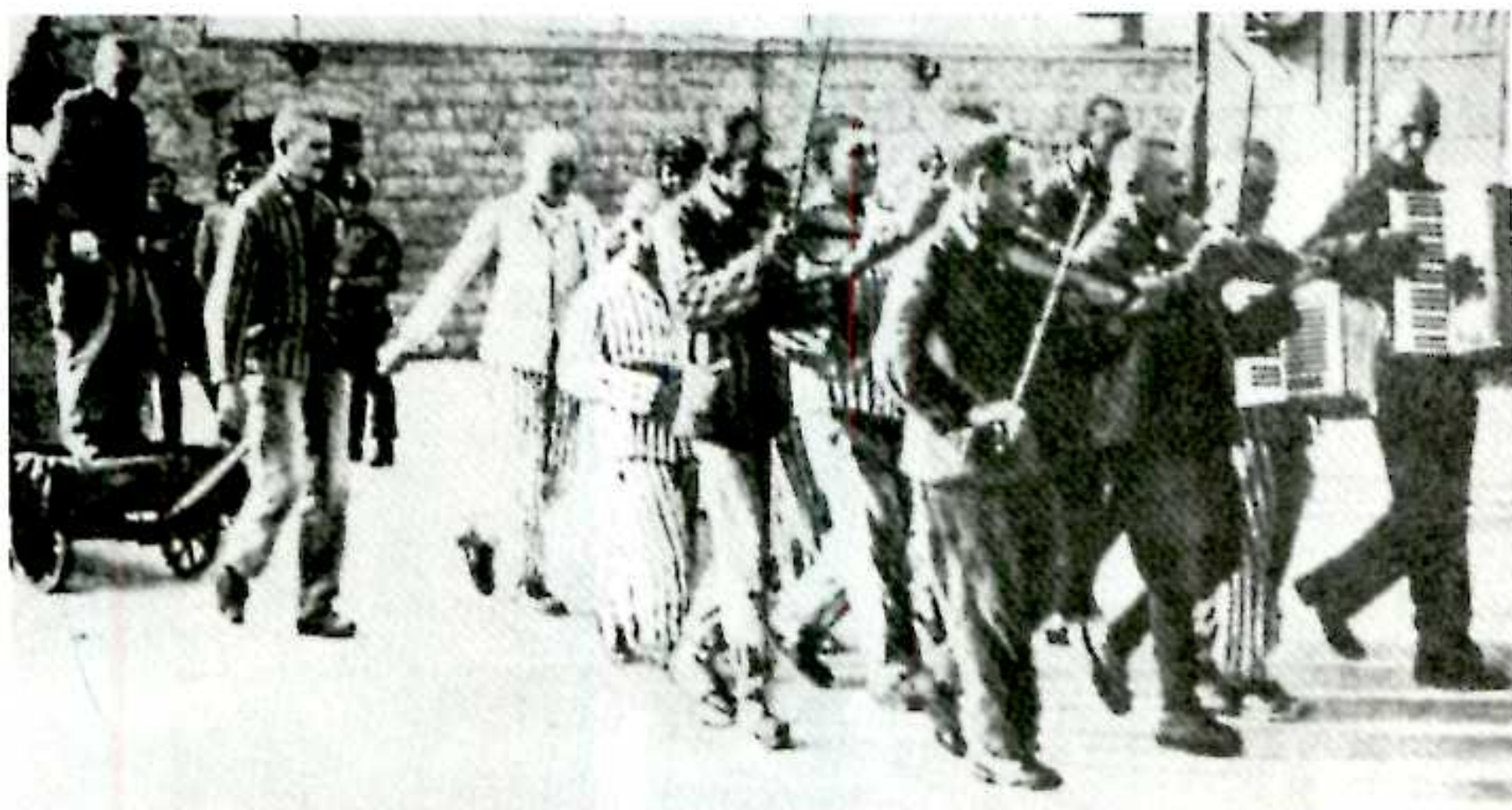
- زندانیان اردوگاه‌های کار اجباری: آنها مجبورند با ترانه "تمام پرندگان آنجا هستند" هم‌بندهای خودشان را با گاری به پای چوبه دار ببرند.