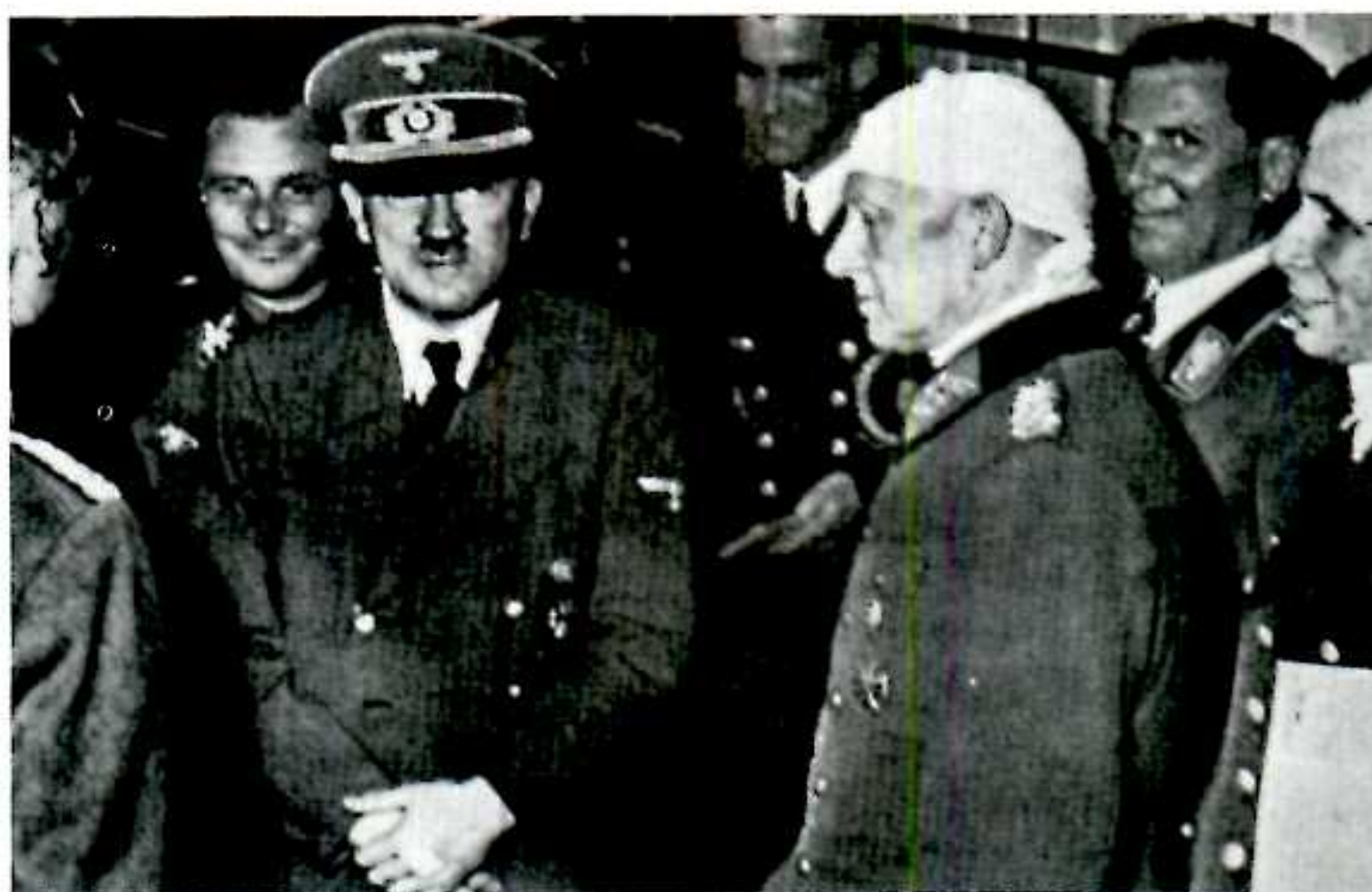
- (بیستم جولای) ۱۹۴۴: هیتلر از سوء قصد جان سالم بدر برد و فقط در ناحیه دست جراحی سطحی برداشت. جلو سمت راست: ژنرال یودل (Jodl) با پانسمان سر و عقب سمت چپ: مارتین بورمان (Martin Bormann)