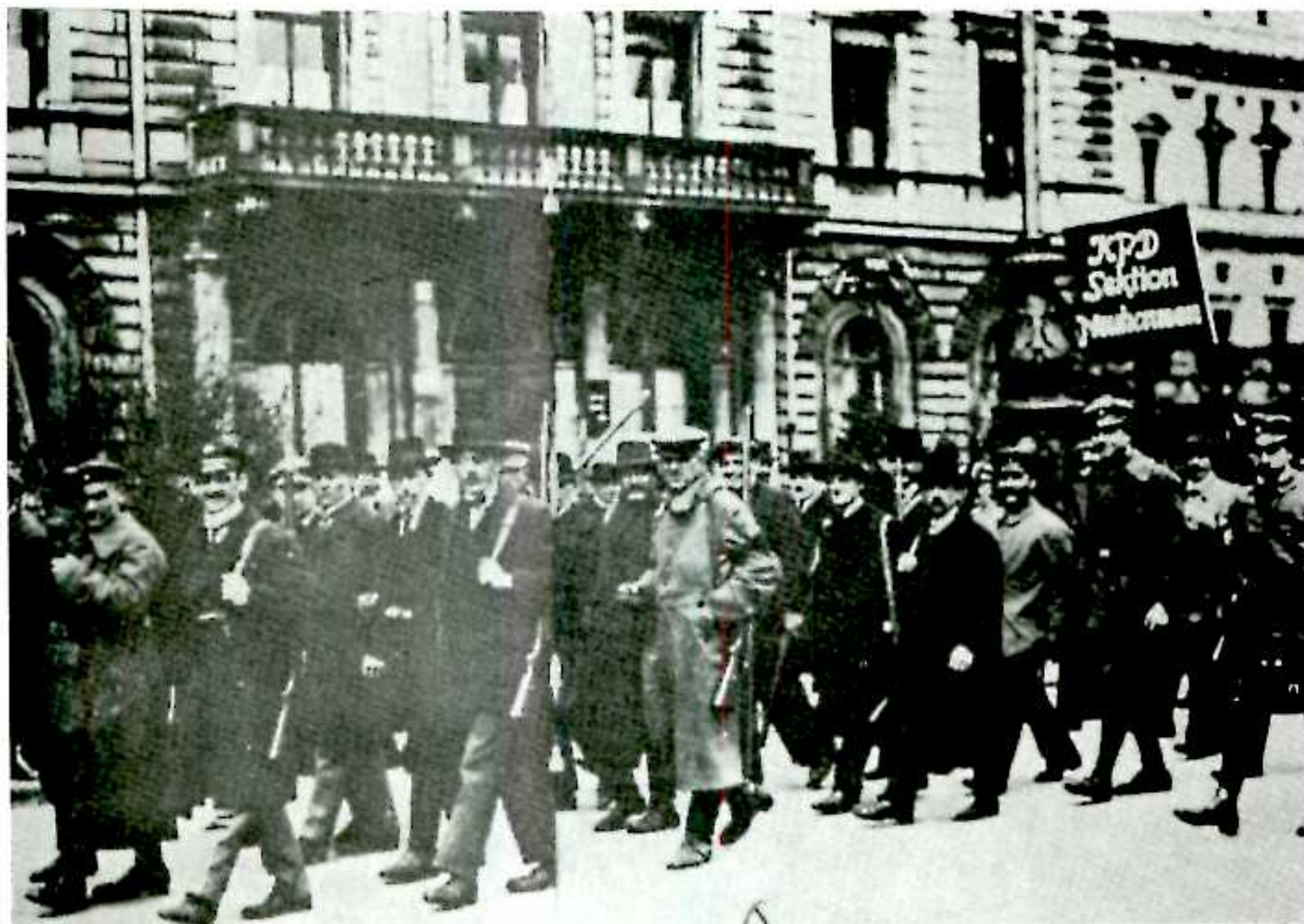
- رژه در خیابانهای مونیخ: هنگامیکه کمونیستها در سال ۱۹۱۹ در حمایت از اتحادیه جمهوری راهپیمائی کردند، هیتلر در سربازخانه ماند. چهار سال بعد سربازان داوطلب را به دور خود جمع کرده و کودتائی را طرح ریزی کرد.