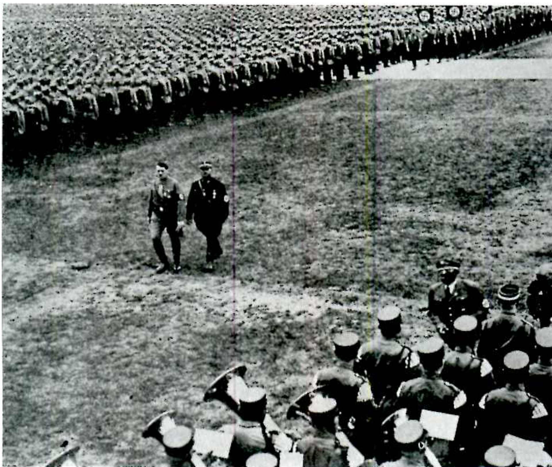
- نمایش قدرت: در "کنگره حزبی پیروزی" ۱۹۳۳ در نورنبرگ هیتلر و روم (Rohm) از رژه گروه یورش SA سان می بینند.