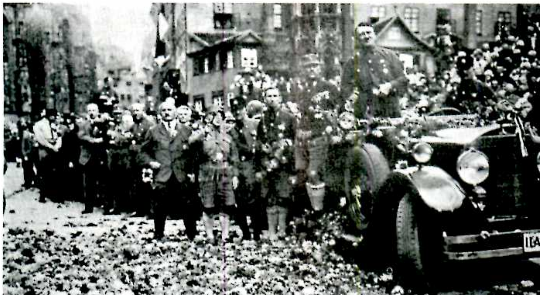
- اجتماع طرفداران و اعضای حزب: به هنگام کنگره غربی NSDAP، فرمانده ناحیه زولپوس اشتراشر (Julius Stricher) به پای پیشواگل ریخت.