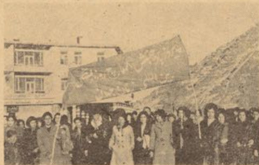
زنان باگرمی و شور انقلابی، روز همبستگی زنان یعنی هشتم مارچ را استقبال می‌نمایند

حافظه تاریخ مشحون از فداکاری‌های زنان - مملو از تمثیلات و ارزوهای هستی ساز آنها - سرشار از فراز و نشیب‌ها - قربانی‌ها و خودگذری‌های بی‌همتای زنان است . زنان پیکر جدا ناشدنی جوامع بشری بوده و در آهنگ تحولات اجتماعی سهیم میباشند . این زنان اند که علی‌الرغم دشواری‌ها و مشکلات زندگی تا متکا ملترین آن‌ها را در هزاره‌ها برای بشریت تحفه‌های خوبی به ارمغان آورده است - گردیده و توانسته است زندگی را برای بشریت سهولت بخشند . افتخارات همه به زنان تعلق دارند چه آنها بوده‌اند که با قبول مشکلات گونه