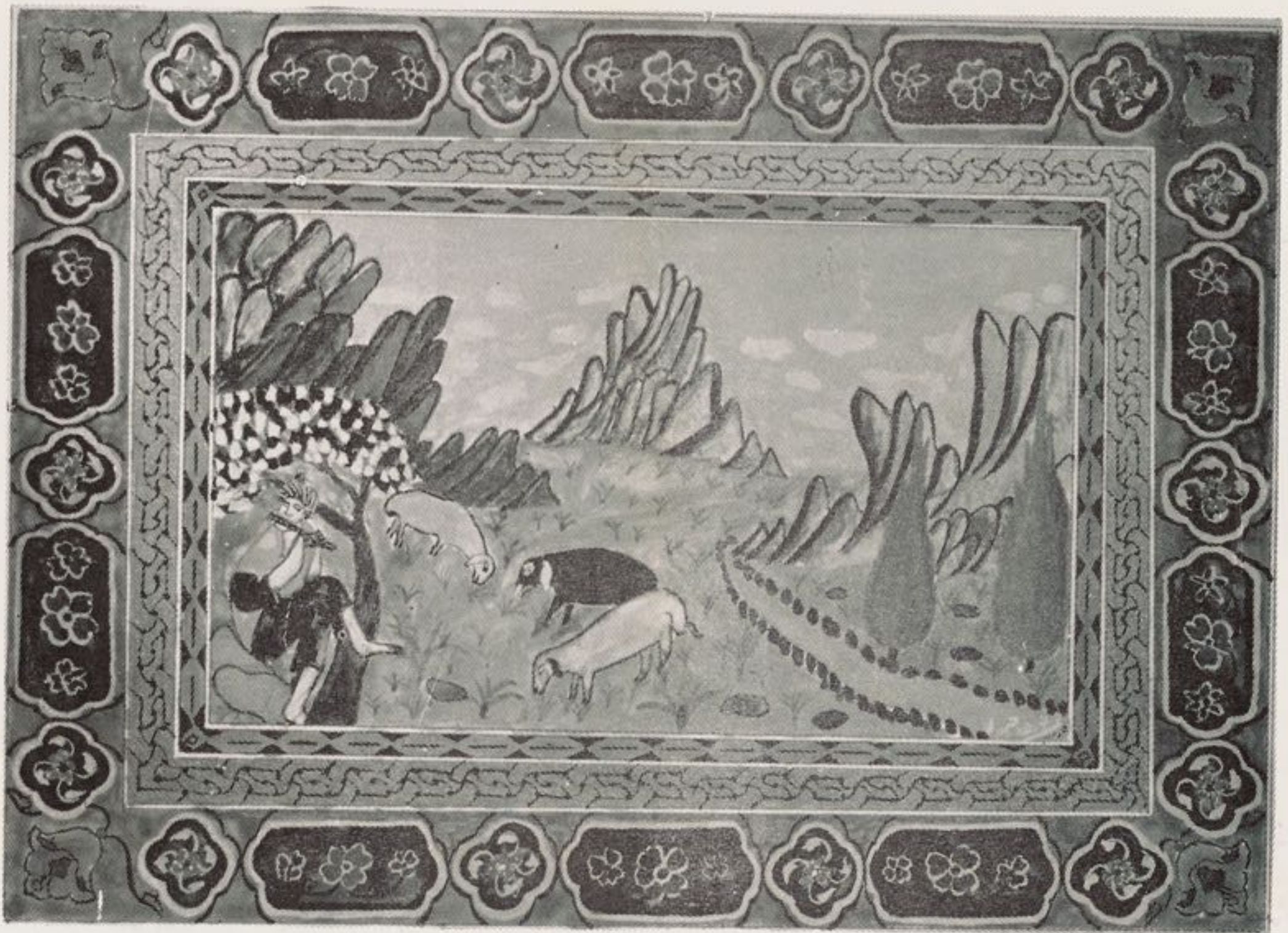
این تابلوی مینا توری نشان‌دهنده شبان بچه رو ستاندیست با رومه از توسفندان در فصل بهار