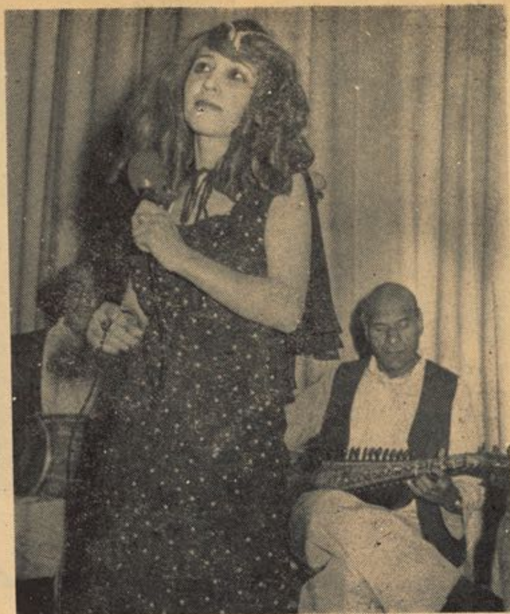
صحنه بی از نمایش رقص و آواز