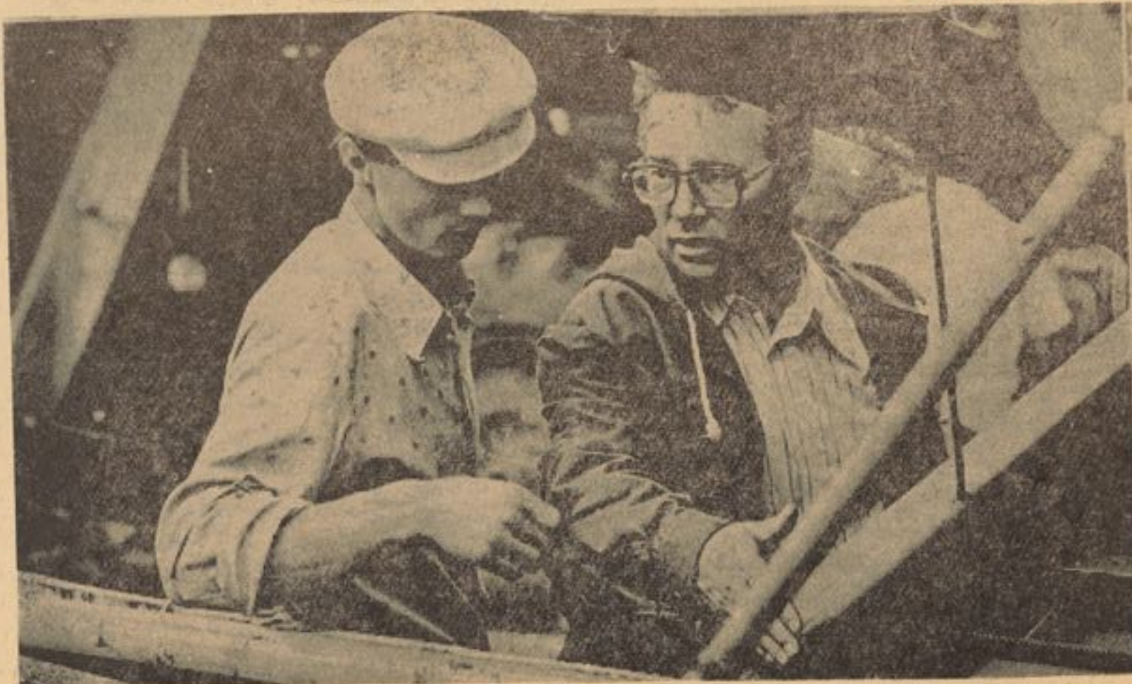
یکتن از اعضای اتحادیه های کارگری در اتحاد شوروی طرق استفاده بهتر از ابزار کار را به یکتن دیگر از اعضای اتحادیه مربوط نشان میدهد .