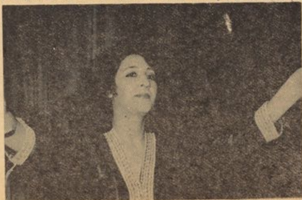
صحنه بی از نمایش رقص

ملالت بار به این جهت که نه تنها در این نمایش نگرنده با اثر بندگی و خلاقیت روبرو نبود و نه تنها هیچ چهره و استعدادی تازه بارور شده به شناخت نیابد ، بلکه اجرای همان پارچه آواز های بار ها تقلید شده و رقص گونه های تماشاگر فریب نیز حتی به موفقیت اجرای پیشین خود نبود و هیچ جلوه بی از يك دنبال روی و تقلید موزون در آن دیده نمیشد و نمایش بی زمینة نبود به این دلیل که در گشت خود هیچ سخنی برای گفتن نداشت اصالت بومی و محلی به شناخت نیامده و باکم به شناخت آمده بی دانشی شناخت نمیتوانست گامی در جهت معرفی آوازه ها ، رقص ها و لباس ها و نحوه آرایش بخشی از مردمان گوشه بی از کشور ما محسوب گردد و حتی تلاشی هم صورت نگرفته بود که دست کم