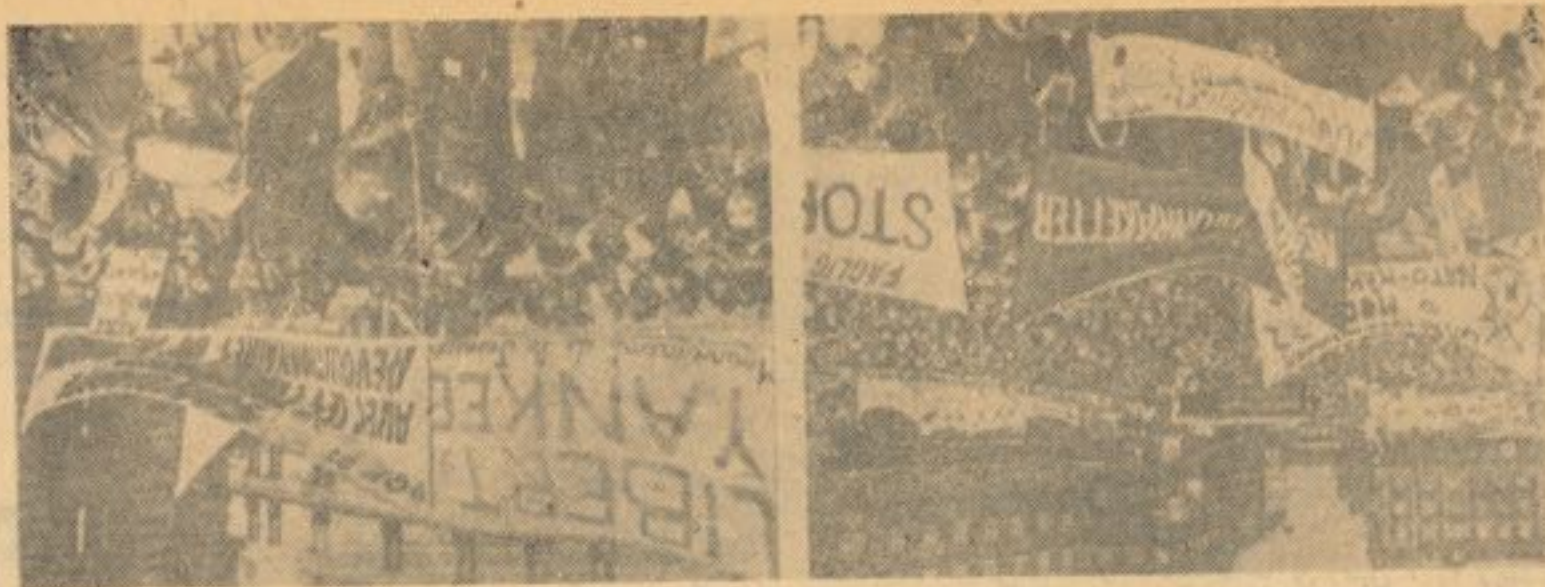
درقبال افزایش تشنج بین المللی و مساعی امپریالیزم مبنی برحولات تازه بر نیروهای صلح و پیشرفت اجتماعی ، کارگران در سراسر جهان بر وحدت و همبستگی بیشتر نیاز دارند .

۱۹۰ میلیون کارگر عضویت فیدراسیون جهانی اتحادیه های کارگری را داراست دومین فیدراسیون بزرگ در مورد عبارت از سازمان و وحدت اتحادیه کارگری آفریقا با (۷۰) الحاقیه در قاره آفریقا میباشند که همکاری فعالانه خویش را با فدراسیون جهانی اتحادیه های کارگری حفظ میکنند . سومین اتحادیه بزرگ عبارت از کانفدراسیون بین - المللی اتحادیه های کارگری آزاد میباشند که در سال ۱۹۶۹ تاسیس شده و اکنون ۵۵ میلیون عضو دارد این کانفدراسیون ۱۳۴ مرکز اتحادیه های ملی کارگری در (۸۰) کشور قلمرو را با هم متحد و مرتبط می سازد ، چهارمین سازمان بزرگ بین المللی در زمینه کانفد - راسیون اتحادیه کارگری اروپایی است که مرکب از انجمن های بقیه در صفحه ۴۴