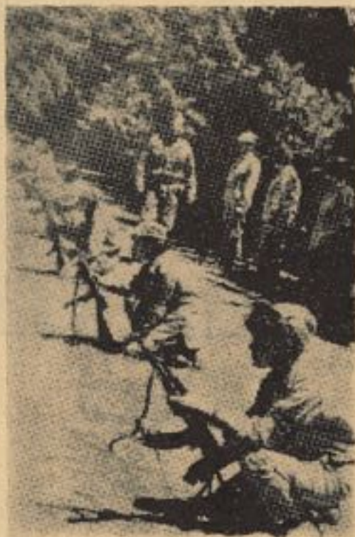
دیلی ولسوالی خوندي د تطبيق توبه حال کی

د فلسطین قهرمان ولس جسی بوره خلور دیرش کاله یی د صهیونیستی او امپریالیستی تیریو په وړاندی یخلو انقلابی مبارزو بوخت دی او دوینام خغه وروسته یی دامپریالیزم او صهیونیزم په مقابل کی خپلی انقلابی مبارزی تودی ساتلی دی . نارینه او بندخو یی د خپلی خاوری او ولس د آزادی او خپلواکی دپاره خانونه قربان کړیدی یو د هغو سترو انقلابی مبارزو بندخو خغه چی د خپل عمر زیاته برخه یی د خپلی خاوری او خلکو دپاره په مبارزو کی تیره کړیدی لیلی خالد ده .