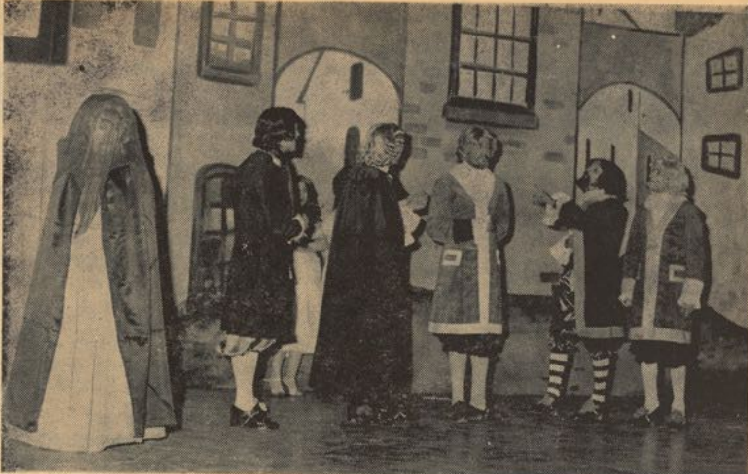
نقد و بررسی تیاتر

دایر کت زن ایده آل دایر کتی است عتوق که در آن کارگردان به تمام لحظات نمایش خود سلط است بازی هاو بالخصوص بازی شفاو بقیه در صفحه ۵۰