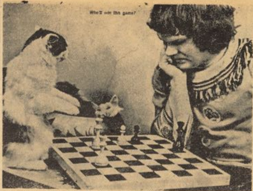
شطرنج یکی از بازی های خیلی دوست داشتنی است درین عکس یک جوان علاقمند به شطرنج میخواهد حرکت دانه ها را بیک لیشک بیاموزاند .

• بدین ترتیب که سبب را خوب سسته و تراش نموده و به اطفال داده شود ، سبب یک میوه فوق العاده مفید می باشد . میگویند هر روز یکدانه سبب بخورید تا سالم و صحتمند باشید .