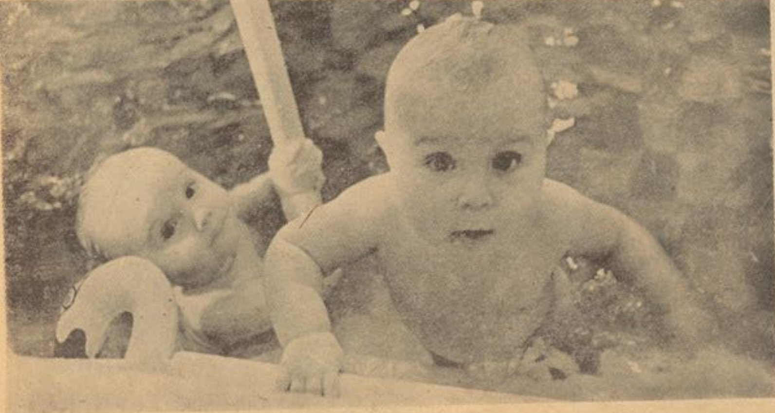
شیر مادر دارای موادی است که طفل را در مقابل امراض وقایه نموده و آنرا صحتمند و تنومند بار می آورد .

شیر مادر خالص و عاری از هر نوع آلودگی است و ضرورت به نگهداری در جایی سرد یا جوش دادن یا پاک نگهداشتن ندارد و همیشه آماده استفاده طفل در هر وقت و زمان است و احتیاج به تیار کردن شیرو یا شیر چوشک نیست و همین شیرمادراست که احساس محبت و علاقه بین طفل و مادر را تقویه میکند پس بهتر خواهد بود تا حد امکان الی شش ماهگی از شیر مادر استفاده به عمل آمده و طفل را از امراض خطر ناک مانند اسهال و استفراق و گلو دردی های شدید وقایه کرد .