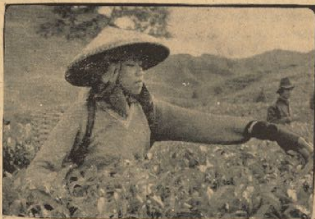
یکی از زنان دهقان از کشورهای جنوب شرق آسیا

بشمول تعلیمات عالی برای تمام افراد شهری و مدنی .