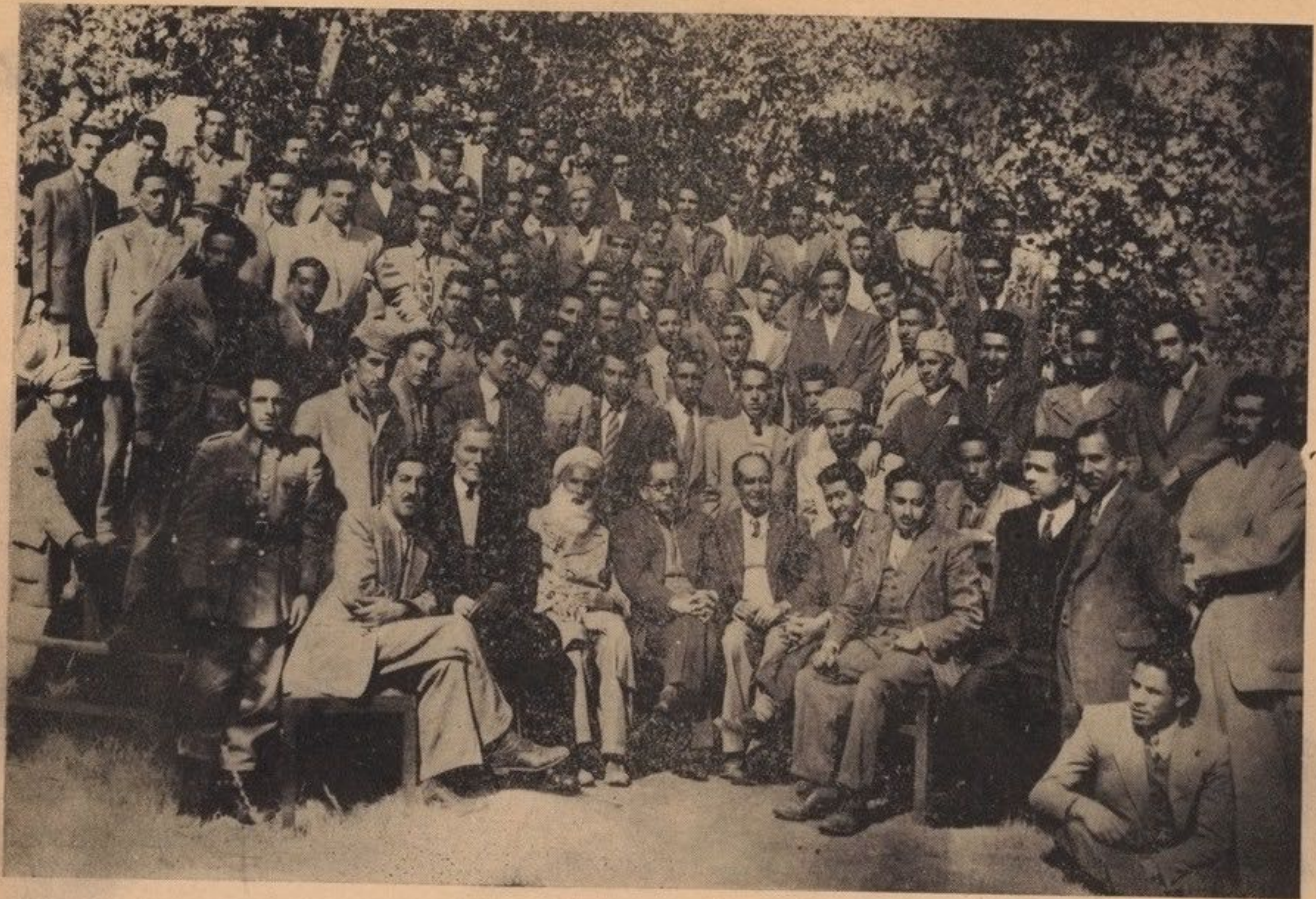
جمعیت استادان و محصلین فاکولتہ ادبیات