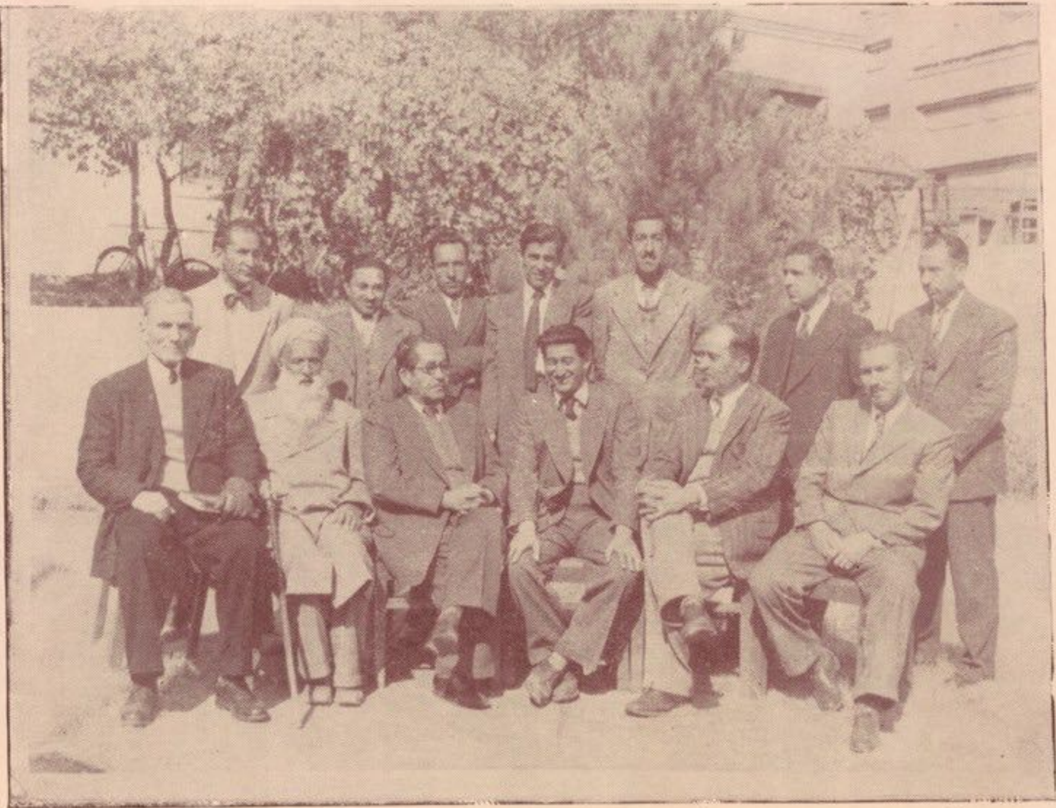
جمیعت ائمه اداان پوهنځی ادبیات در سال ۱۳۳۲