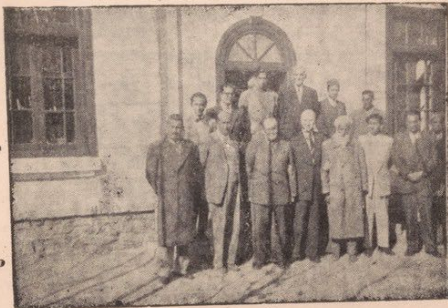
هیئت کلتوری شوروی بارئیس واستادان فاکولته ادبیات فوتوگرافی معتمدی