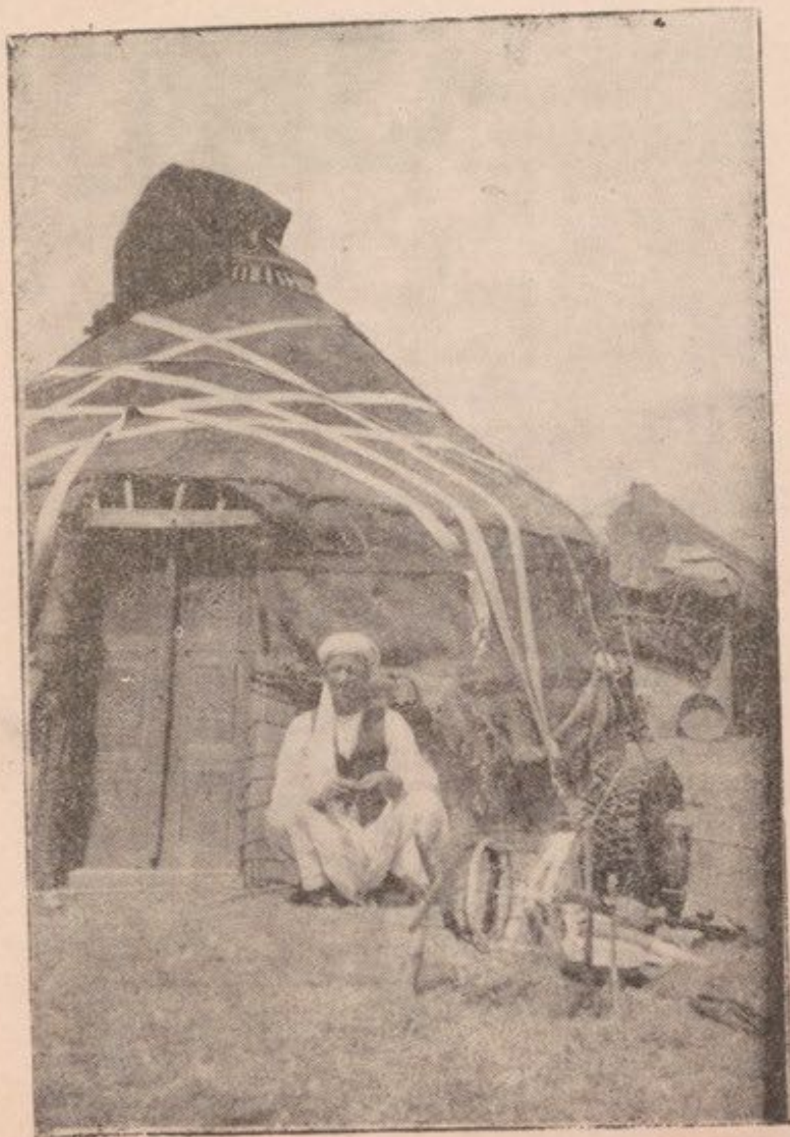
سنجک میمنه چادر نشین های قوم قه قه مربوط بمقاله ( در تجسس مغل )