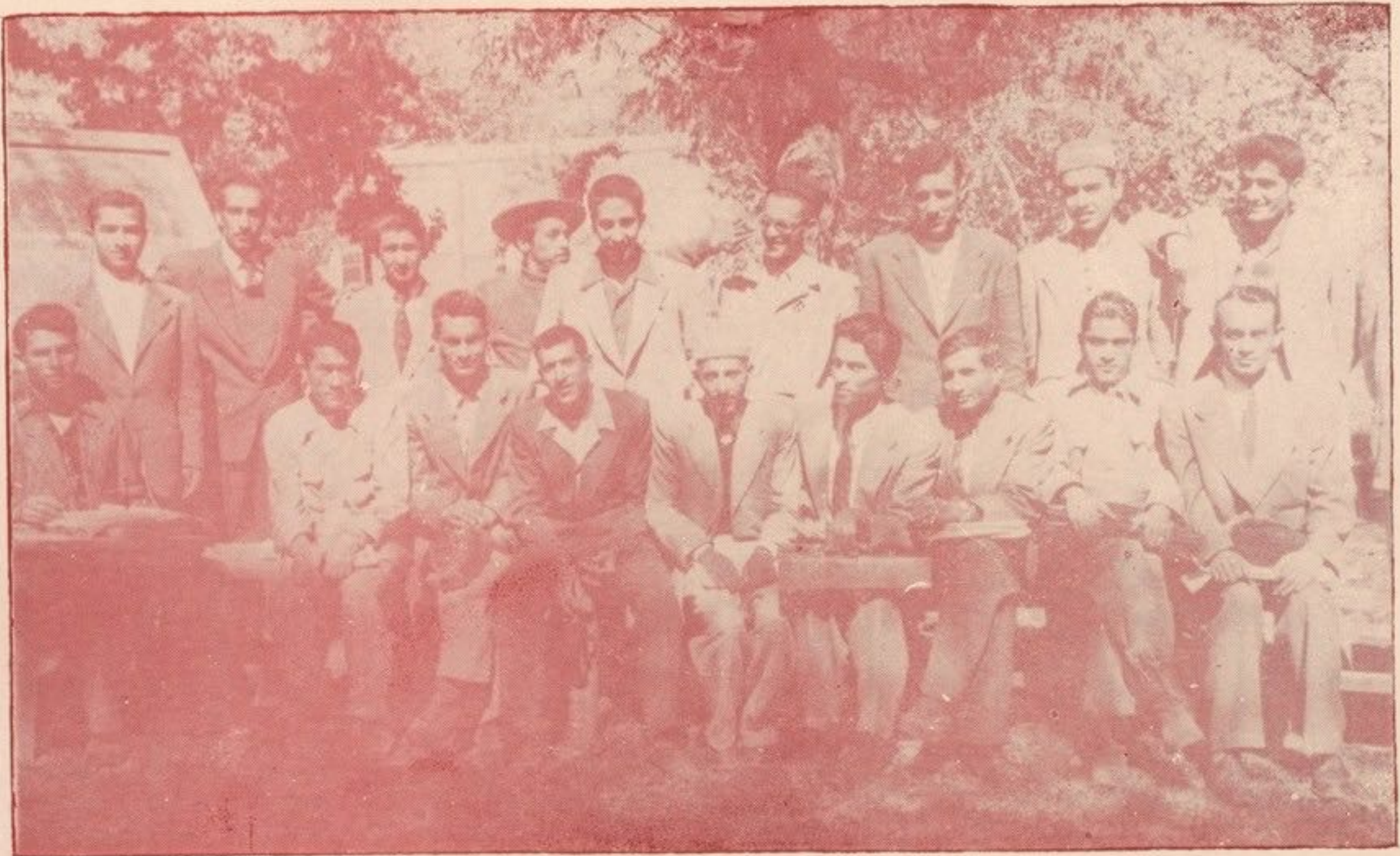
جمعیت محصلین شعبه انگلیسی پوهنځی ادبیات که در اول حمل سال ۱۳۳۵ افتتاح شد.