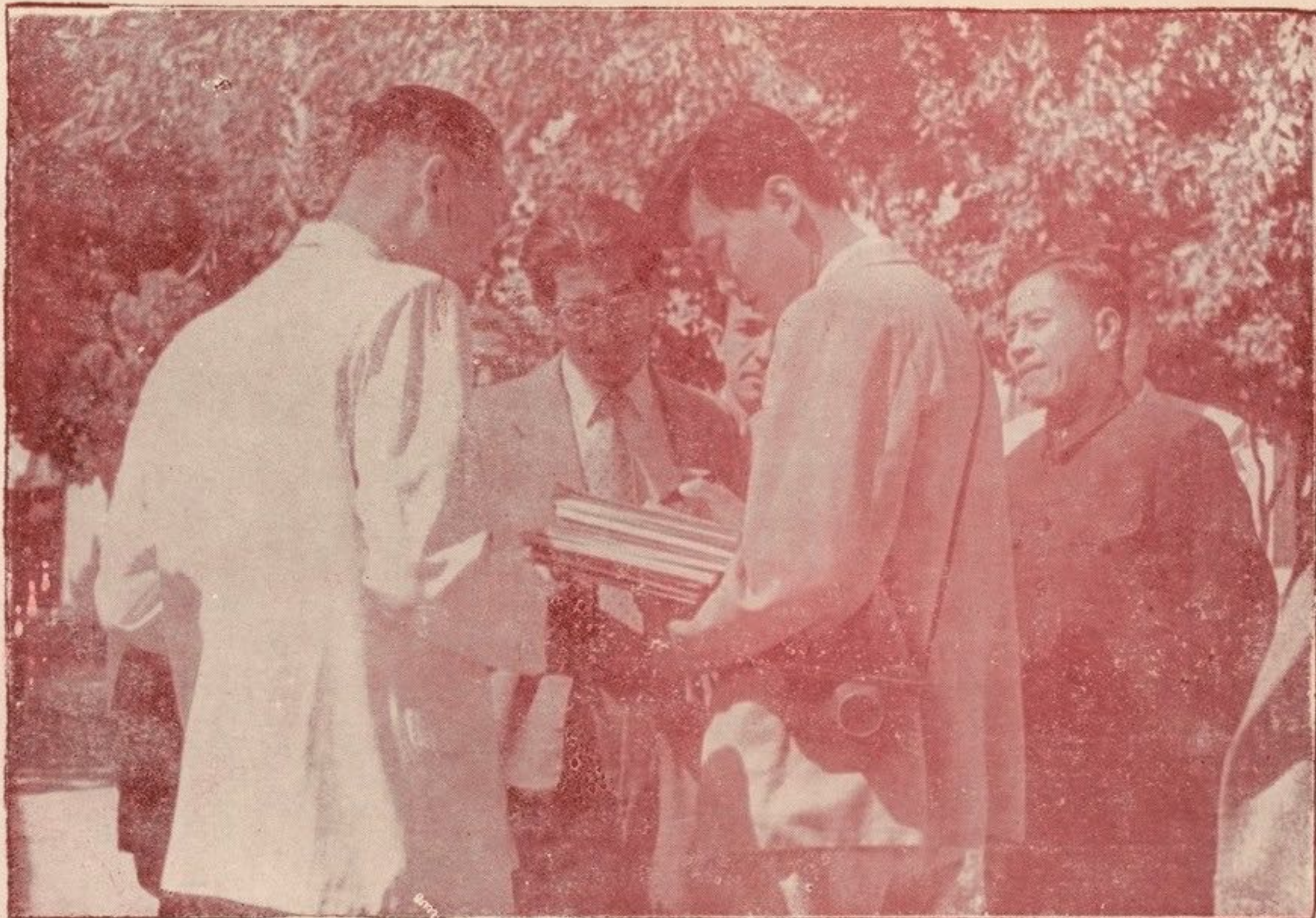
نماینده «نیوچاینا» اسمای نشرات اهدا شده پوهنخی ادبیات را از رئیس پوهنخی می‌شنود و بزبان چینی مینویسد .