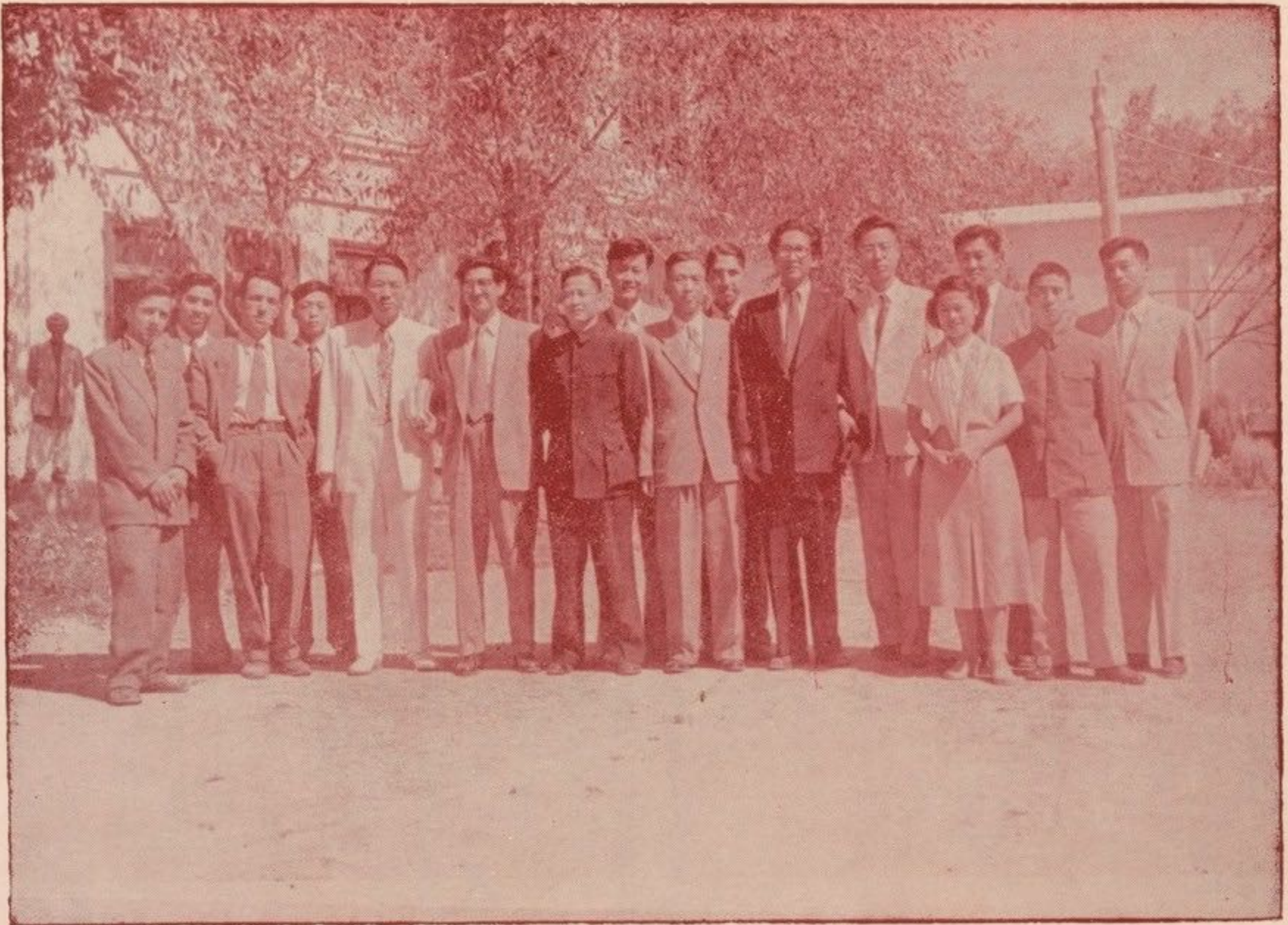
رئیس هیئت ثقافتی چین توده ویکعه از هنرمندان، آنکشور با رئیس و استادان پوهنځی ادبیات.