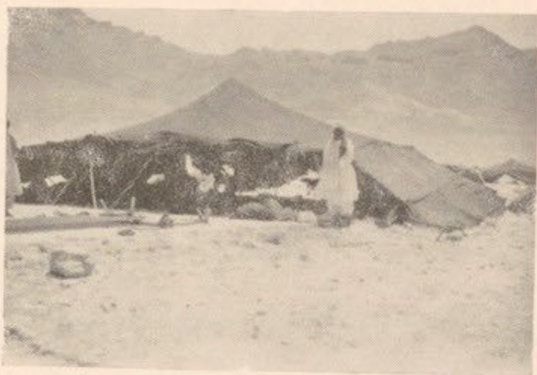
خانواده از چادر نشینان پښتون در یکی از دره های غوروات