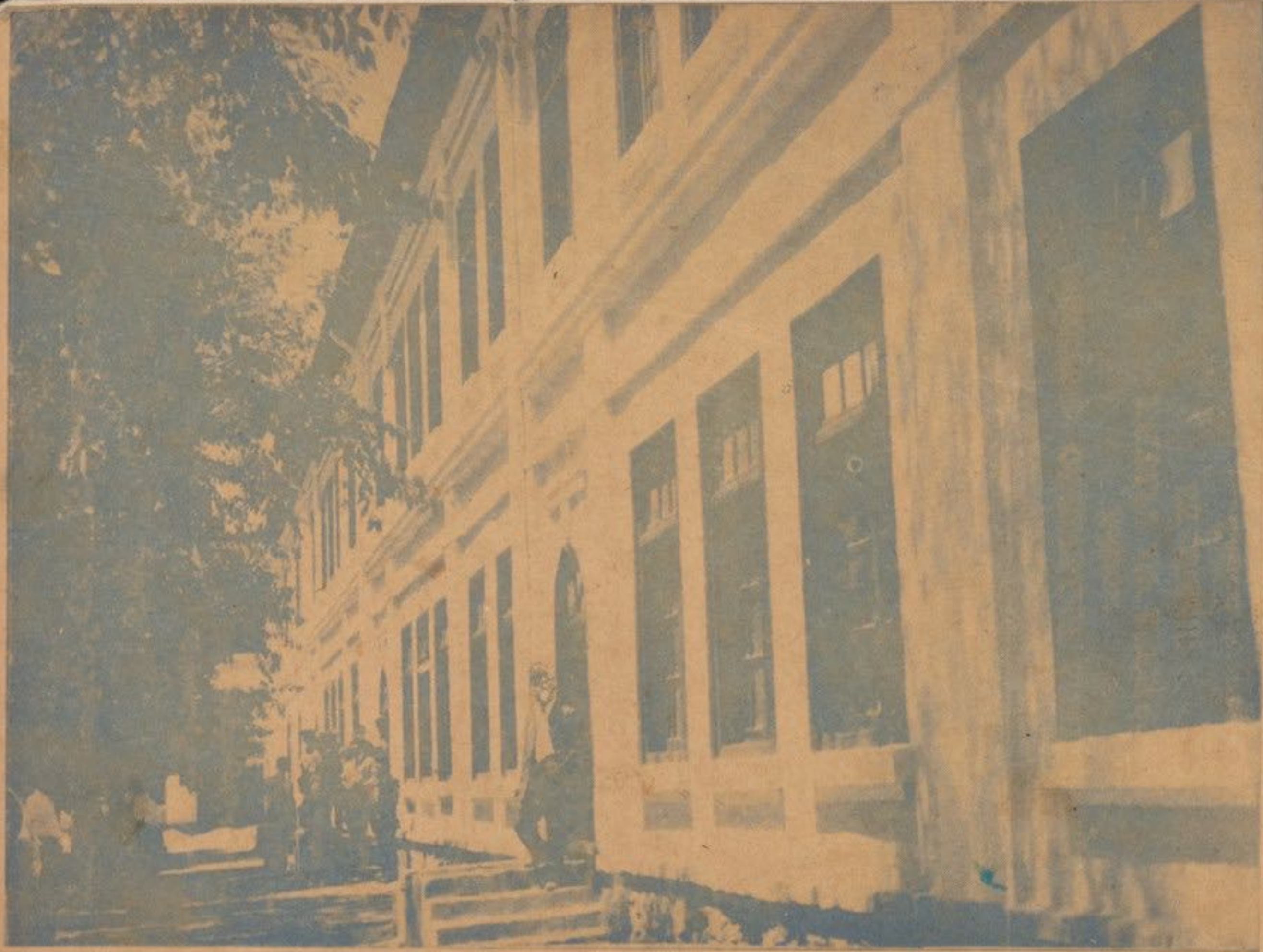
گوشه از عمارت پوهنځی ادبیات