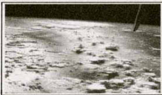
سوره آل عمران آیه ۱۹۰

جالب این است که مقدار اکسیژن مورد احتیاج جهت تنفس ، در هوا بصورت بسیار حساس ثبت و در حالت تعادل قرار گرفته اند . (( مایکل دنتون )) ۱ در این مورد می گوید : * آیا اتمسفر ما می توانست با در برداشتن اکسیژن بیش از اندازه به حیات خود ادامه دهد ؟ خیر ! اکسیژن عنصری است که عکس العمل های شدید از خود نشان می دهد . حد نصاب ۲۱ درصدی اکسیژن موجود در اتمسفر ، در مرزی ایده آل قرار دارد و نباید از این مرز تجاوز کند . اضافه شدن حد نصاب ۲۱ درصدی به این ۲۱ درصد ، باعث می شود ۷۰ درصد آتش سوزیهای جنگلها در اثر رعد و برق افزایش یابد .