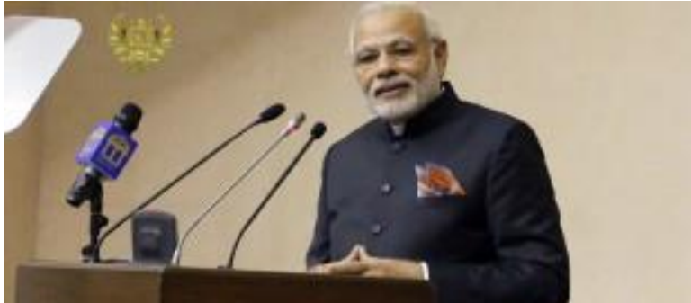
(د هند لومړی وزیر؛ نریندرا مودي)

کله چې پر (۱۳۹۴ل کال) د هند لومړی وزیر (نریندرا مودي) کابل ته راغی، نو د افغانستان د ملي شورا ودانۍ کې یې، چې د هند په مالي مرسته جوړه شوې وه، د ملي شورا دواړو جرگو ته یوه تاریخي وینا کړه. دا وینا د زیاتو افغانانو له هر کلي سره مخامخ شوه، خو د یو شمېر تنگنظرو کړیو په زړه اواره نه شوه. دا لیکنه د هند لومړي وزیر ته د مننې په توګه لیکل شوې او بیا وروسته هند سفارت ته لېږل شوې چې خپل لومړي وزیر ته یې ورسوي.