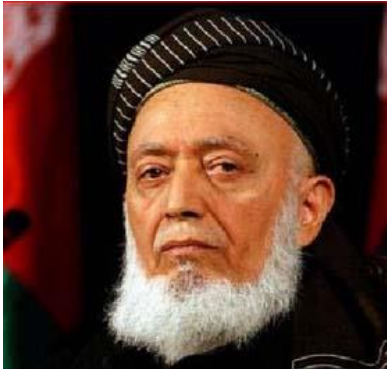
(برهان الدين رباني)

دا لیکنه پر (۱۳۹۵ ل کال) د یو شمېر هغو کړیو په ځواب کې لیکل شوې، چې په انتقاد کې له افراط څخه کار اخلي او په یو اړخیز ډول قضاوت کوي.