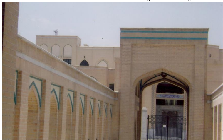
د ايران په لگښت د جوړې شوې يوې مدرسې يوه څنډه

خو د افغانستان مخلوع خارجه وزير له ايران سره د خپل ژبني پيوستون او تمايلاتو له امله دا تړون لاسليك كړې او د افغانستان نور قانوني او ارتباطي مراجعو، لكه اطلاعاتو او كلتور وزارت،