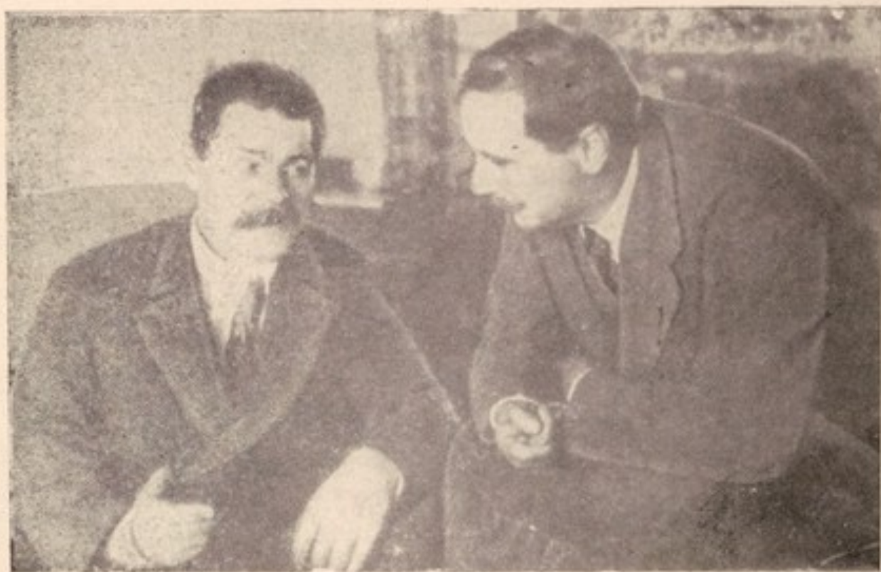
گورکی و اچ . جی . ولز - پتروگراد (۱۹۲۰)