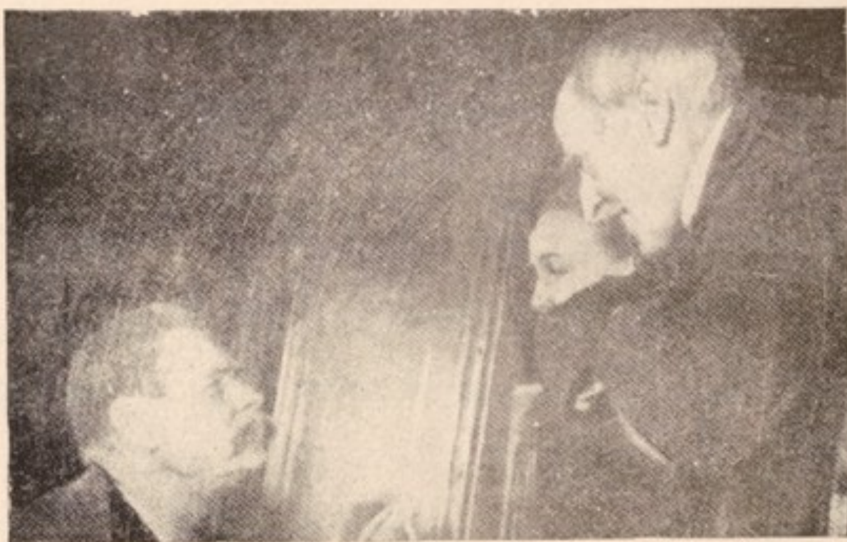
گورکی ، رومن رولان و خانمش در ایستگاه قطار آهن مسکو (۱۹۳۵)