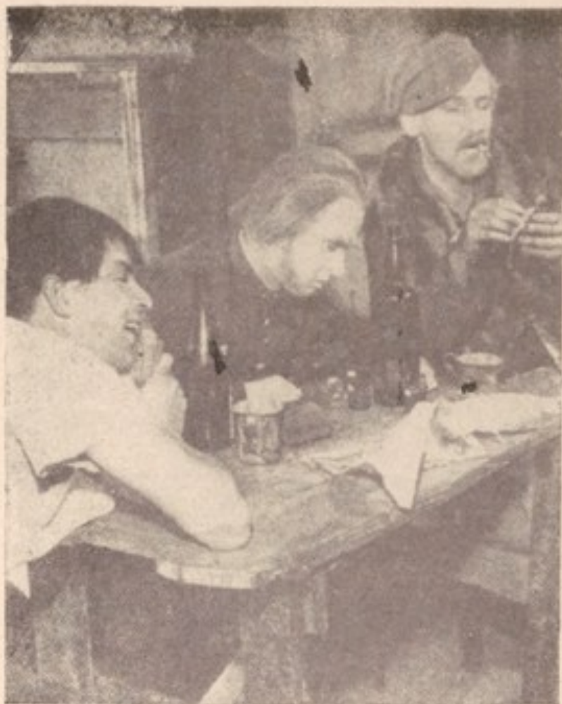
صحنه بی از نمایشنامه معروف (در اعماق اجتماع) در تئاتر شهری اسپالا (-ویدن)