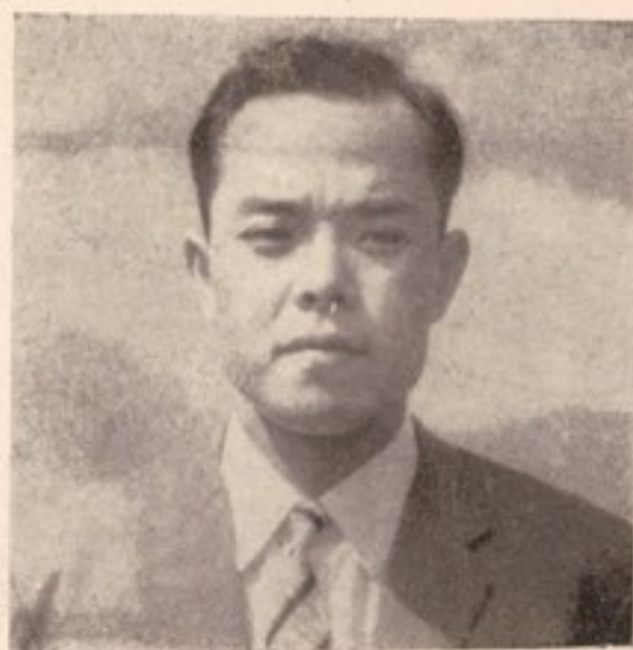
بناغلی تا کشی کتسو فوجی