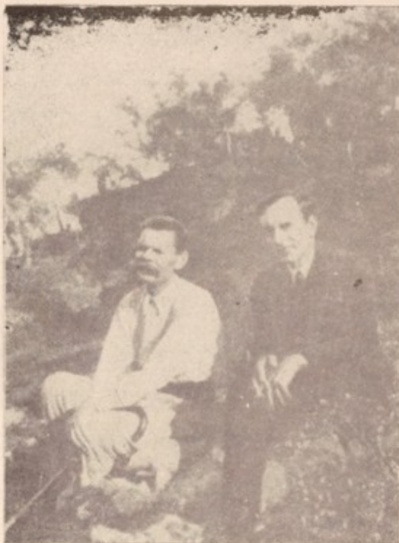
گورکی و فرانز هانتز نویسنده‌ی باژیکی در سورنتو (۱۹۲۷)