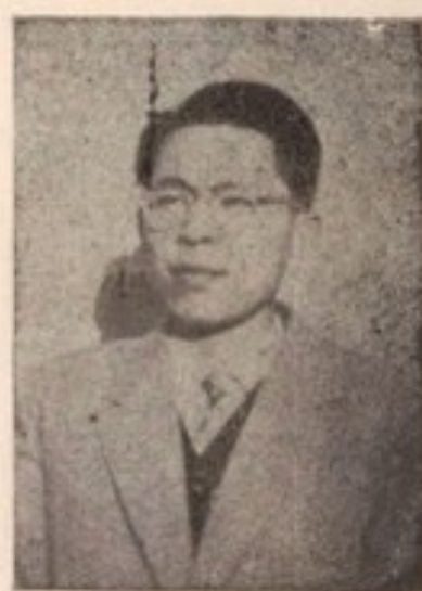
بناغلی چه هون - شای