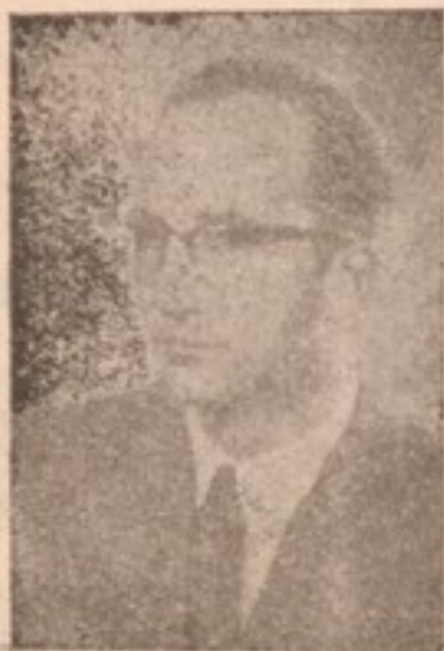
بناغلی دا کتر فیشرد

تحت پروگرام سکالرشپی (۱۹۵۲-۱۹۵۴) به مالک سیلون ، هندوستان ، نیپال ، پاکستان ، افغانستان ، ایران ، عراق و ترکیه برای مطالعه آرت دوره هند و اسلامیک مالک فوق مسافرت کرده اند .