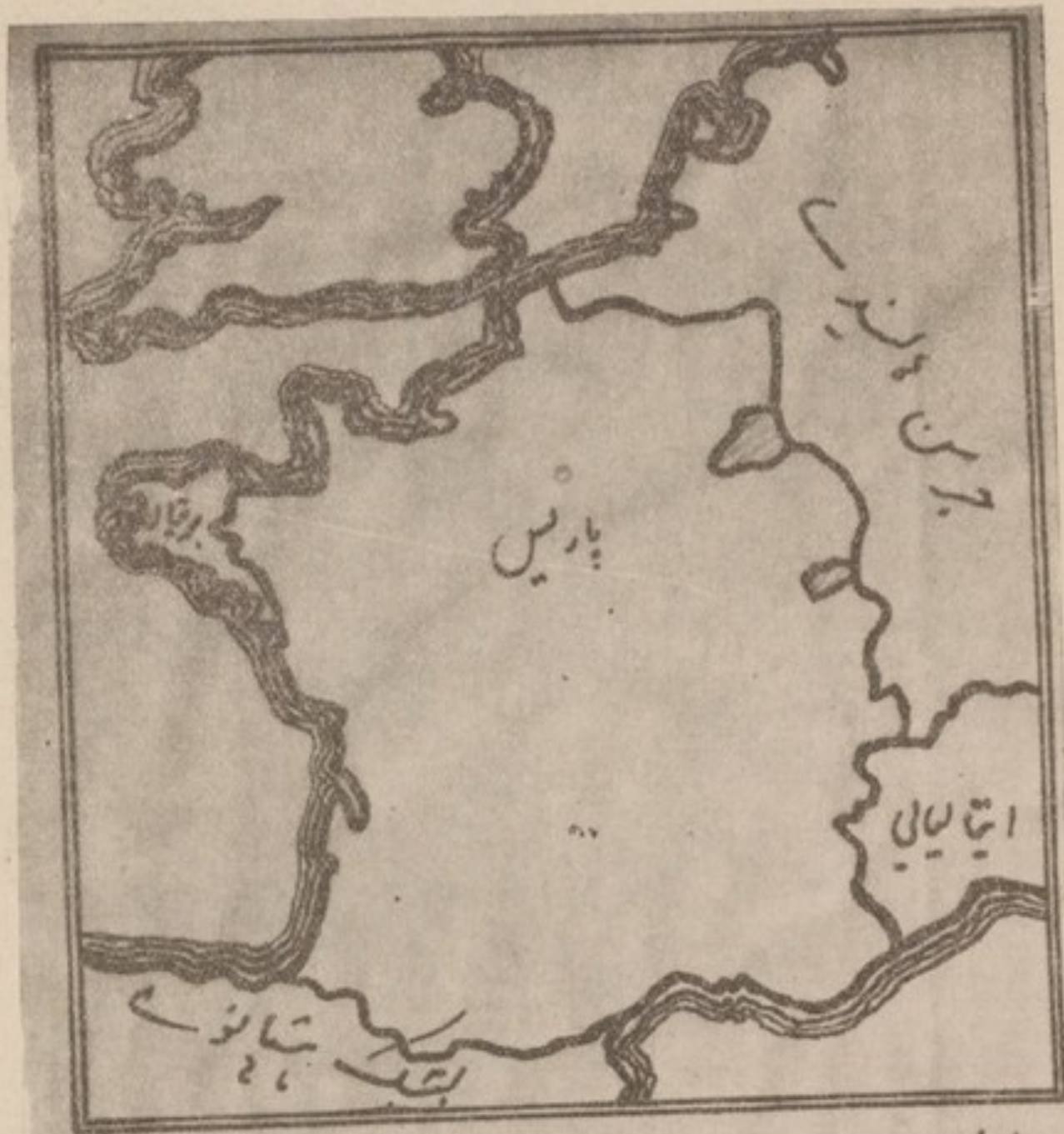
(شکل ۸) مقامی: (موسسه جغرافیای پوهنکشی ادبیات) پونتون کابل

اطلاعات مادر باب جغرافیای لهجی منحصر بشرایطی است که در حوزهای مسکون جریان داشته است. در هر بخش همچو حوزها موضوع متحدالشکل نبودن اشکال لسانی بمیان نمی‌آید. هر د هکده،