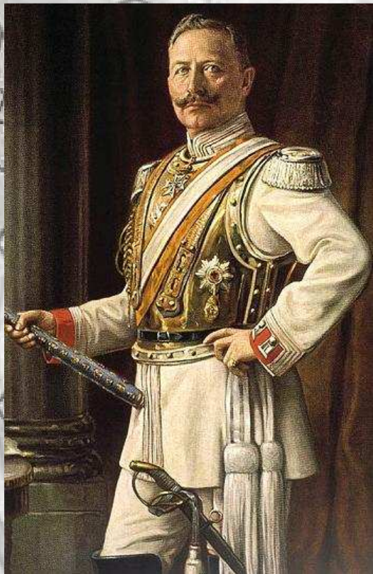
ویلهلم دوم، امپراتور آلمان

توافق کردند نمایندگی های سیاسی و اقتصادی خود را در پایتخت های یکدیگر دائر کنند. در همین سال آلمان نمایندگی سیاسی خود را در ایران به وجود آورد و «ارنست براون شوایگ» را به عنوان اولین فرستاده رسمی و نماینده سیاسی دولت آلمان به ایران اعزام داشت. کمی بعد «میرزا رضاخان مؤیدالسلطنه گرنامه» به عنوان اولین وزیرمختار ایران به برلین اعزام شد و «گراف فن برانشوایک» به عنوان وزیر مختار آلمان به تهران آمد.