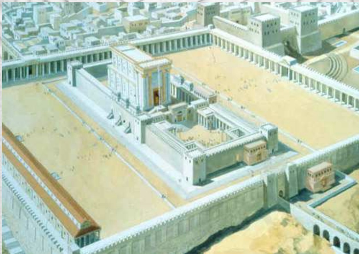
تصویری از هیكل سلیمان

دست دادند و تحت سلطه ی رومیان درآمدند و تا زمان "جنگ های صلیبی" در دست رومیان باقی ماند.