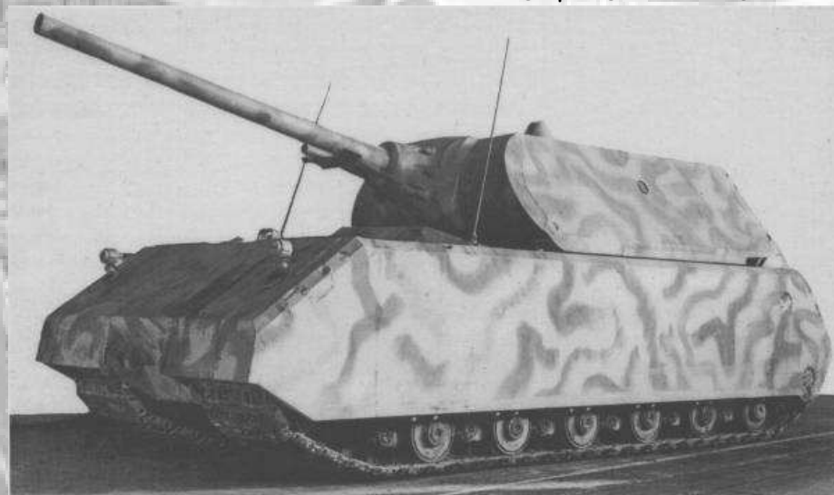
ابر تانک ماوس

نیازی به یاد آوری نیست که اگر این تانک واقعا بر روی جاده ای حرکت می کرد، در پشت خود ردی از آسفالت متلاشی شده بر جای می گذاشت. زره جلویی برجک، قطورترین زره در بیشتر تانک ها تقریبا یک چهارم متر ضخامت داشت و تقریبا در برابر تمامی جنگ افزار های ضدتانک آن زمان متفقین کاملا مقاوم بود.