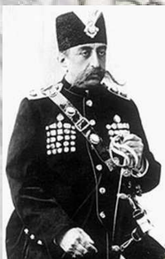
ناصرالدین شاه قاجار

امپراطوری آلمان مدتها بعد از امپراطوری های بریتانیا و روسیه در صحنه سیاسی و اقتصادی ایران ظاهر شد. در زمان صفویه و در دوران شاه عباس کوششی برای ایجاد روابط با آلمان به عمل آمد ولی به نتیجه نرسید. در نیمه قرن نوزدهم و