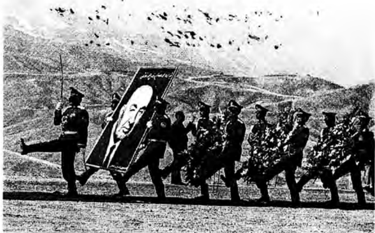
کابل، مارچ ۲۰۰۹: د ارواښاد محمد داود جنازه خاورو ته سپارلو یوه منظره