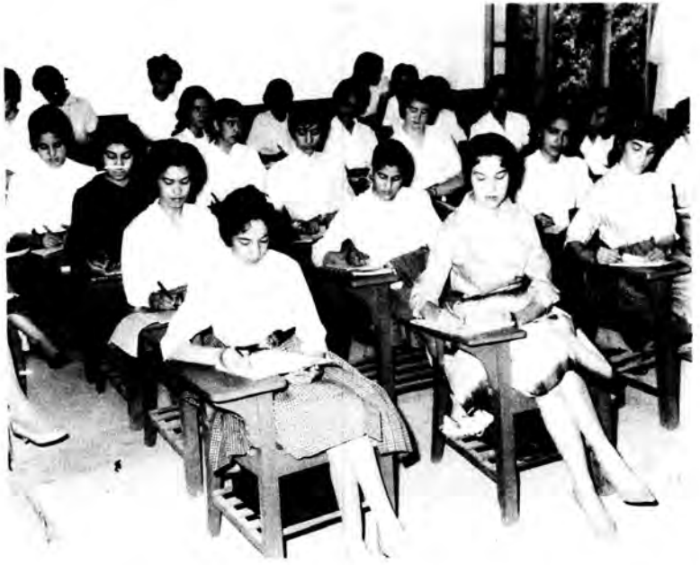
د کابل پوهنتون د ادبیاتو د پوهنځي محصلانې په کال ۱۹۶۰ کې