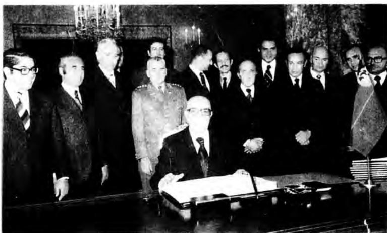
ولسمشر محمد داود دکابینې له غړیو سره