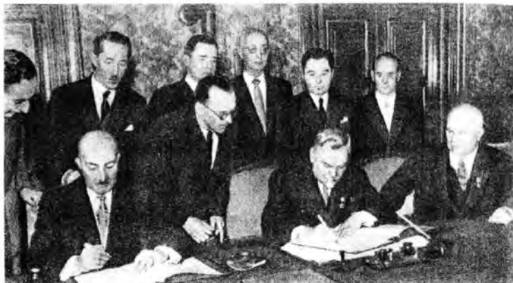
صدا اعظم محمد داود د شوروي اتحاد له مارشال بولگانين سره په ۱۹۵۵ کې د دو ستۍ د تړون د لاسليک په حال کې، له خرو شچف او محمد نعيم او نورو لوړو چارواکيو سره