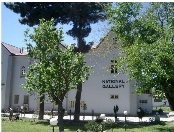
د ملي گالری انځور

گالري یوه فرانسوي کلمه ده. په افغانستان کې هغه ځای ته ویل کېږي چې د نقاشی او میناتورې ارزښتناک کلاسیک او معاصر آثار پکې ساتل کېږي. د موزیم تابلوگانې او نور نقاشي شوې آثار د څېړونکو د څېړنې لپاره ډېر زیات ارزښت لري. په هر حال لرغوني آثار چې په ملي موزیم، ملي ارشیف او ملي گالری کې ساتل کېږي، د ټولني د سیاسي، اقتصادي او فرهنگي، پوځي او ټولنیزو حالاتو د درک لپاره د څېړونکو او تاریخپوهانو د مطالعې او څېړنې لپاره اصلي منبع بلل کېږي. ملي گالري د کابل ښار په آسمایي واټ کې موقعیت لري.