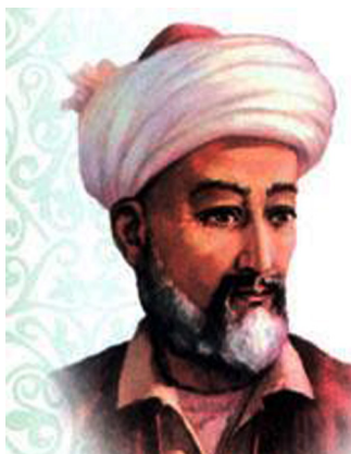
امير علي شير نوايي

نوايي په خپله ليکوال او شاعر و، د عالمانو او ادیبانو درناوی به يې کاوه او د علم د خاوندانو په خدمت کې يې له هېڅ کاره مخ نه اړاوه.