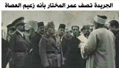
المفتي يستقبل موسوليني ويصف المجاهدين بالخوارج