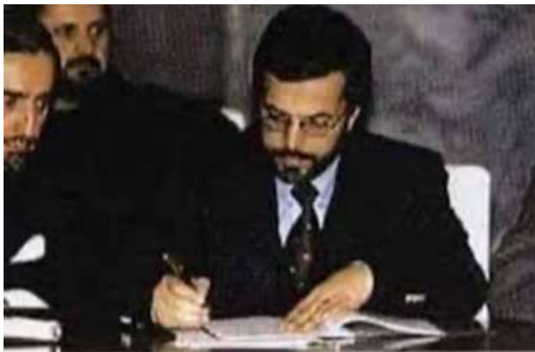
Der Innenminister Junus Kanuni (Bildmitte) unterstützt im Beisein von Außenminister Abdullah Abdullah und Verteidigungsminister Kasim Fahim (rechts) den Vertrag zur Zusammenarbeit der Streitkräfte auf dem Gebiet Afghanistans.

مجاهدینو او یو شمېر نورو فسادګرو یو ګډه ترکیب رامنځته کړ او دې ته یې د ((ملي وحدت)) د حکومت نوم ورکړ. د دې حکومت مشر اشرف غني بیا خپل واک ته دوامه تېری و، چې له کوم دقت او ځنډ پرته یې له امریکا سره امنیتي تړون لاسلیک کړ