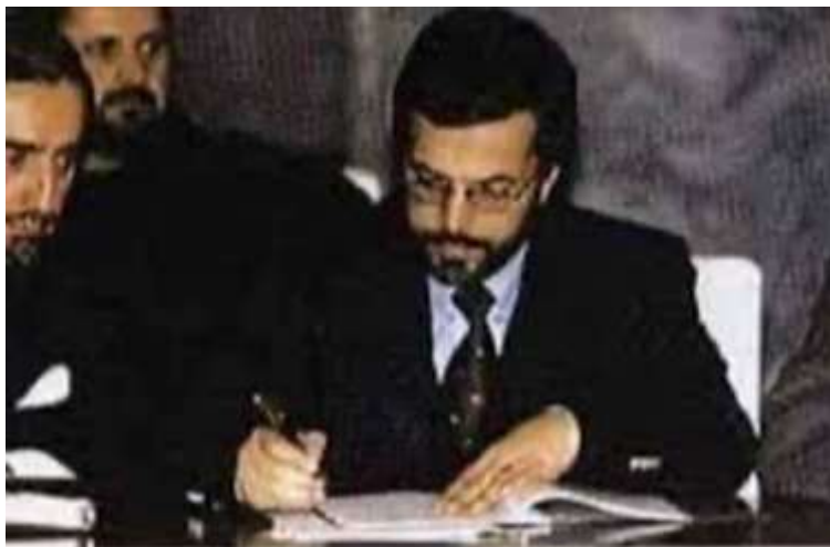
Der Innenminister Junus Kanuni (Bildmitte) unterstützt im Beisein von Außenminister Abdullah Abdullah und Minister Kasim Fahim (rechts) den Vertrag zur Entsendung von Streitkräften auf dem Gebiet Afghanistans.

مجاهدینو او یو شمېر نورو فسادګرو یو ګډه ترکیب رامنځته کړ او دې ته یې د ((ملي وحدت)) د حکومت نوم ورکړ. د دې حکومت مشر اشرف غني بیا خپل واک ته دوامه تېری و، چې له کوم دقت او ځنډ پرته یې له امریکا سره امنیتي تړون لاسلیک کړ