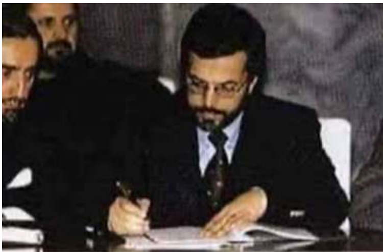
Der Innenminister Junus Kanuni (Bildmitte) unterstützt im Beisein von Außenminister Abdullah Abdullah und Verteidigungsminister Kasim Fahim (rechts) den Vertrag zur Entsendung von Streitkräften auf dem Gebiet Afghanistans.

مجاهدینو او یو شمېر نورو فسادګرو یو ګډه ترکیب رامنځته کړ او دې ته یې د ((ملي وحدت)) د حکومت نوم ورکړ. د دې حکومت مشر اشرف غني بیا خپل واک ته دوامه تېری و، چې له کوم دقت او ځنډ پرته یې له امریکا سره امنیتي تړون لاسلیک کړ