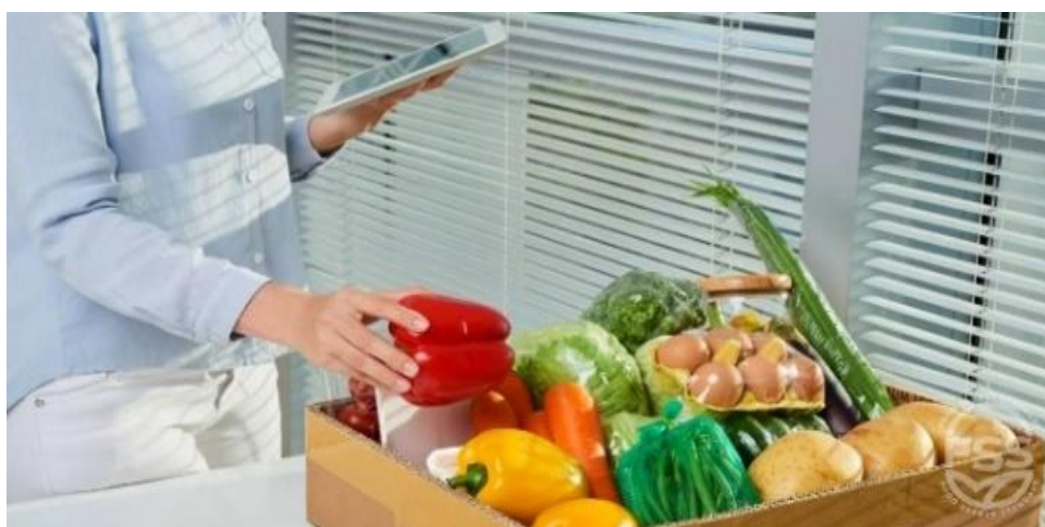
انځور- ( 18 )، صحیح ډول د خوړو پېرودل.