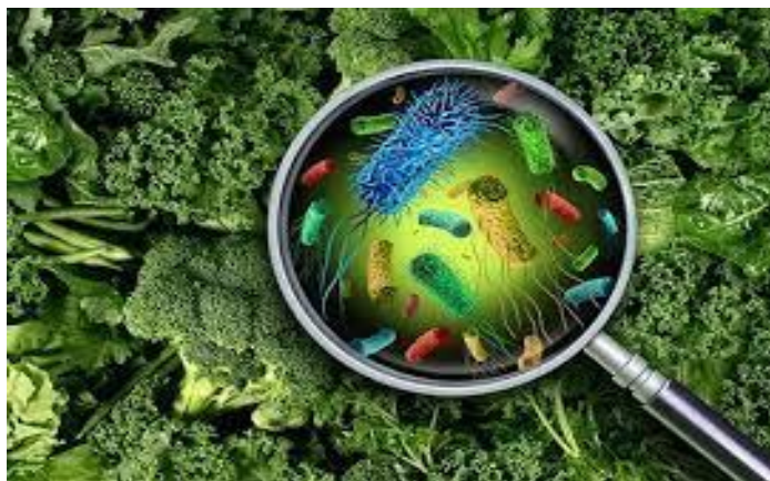
انځور- ( 6 ) ، په خوړو کې مختلف مايکرو اورگانيزمونه.

د خوړو څخه پيدا شوي ناروغی خورا عام دي او دا اړينه ده چې د دې ناروغیو د مخنيوي لپاره لاملونه او لارې وپيژنی ترڅو د دې ناروغیو له امله رامینځته شوي رنځ څخه ځان لرې وساتی. نو، راضي چې د دې ناروغیو د مخنيوي لپاره لارښوونې وپيژنو