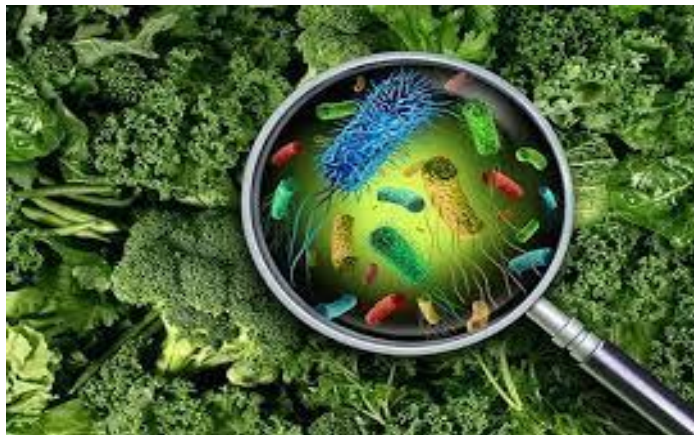
انځور- ( 6 ) ، په خوړو کې مختلف مايکرو اورگانيزمونه.

د خوړو څخه پيدا شوي ناروغی خورا عام دي او دا اړينه ده چې د دې ناروغیو د مخنيوي لپاره لاملونه او لارې وپيژنی ترڅو د دې ناروغیو له امله رامینځته شوي رنځ څخه ځان لرې وساتی. نو، راضي چې د دې ناروغیو د مخنيوي لپاره لارښوونې وپيژنو