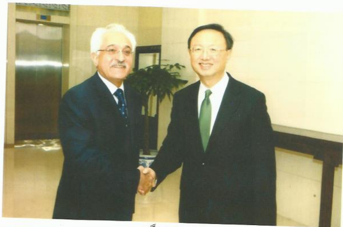
دیدار با یاگیشی، وزیر خارجه‌ی جمهوری مردم چین، بیجنگ.