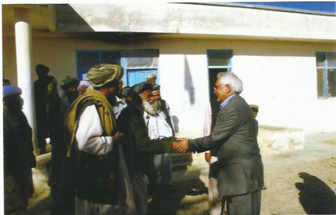
مصافحه با مردم، ولسوالی گرمسیر، ولایت هلمند، ۲۰۰۷.