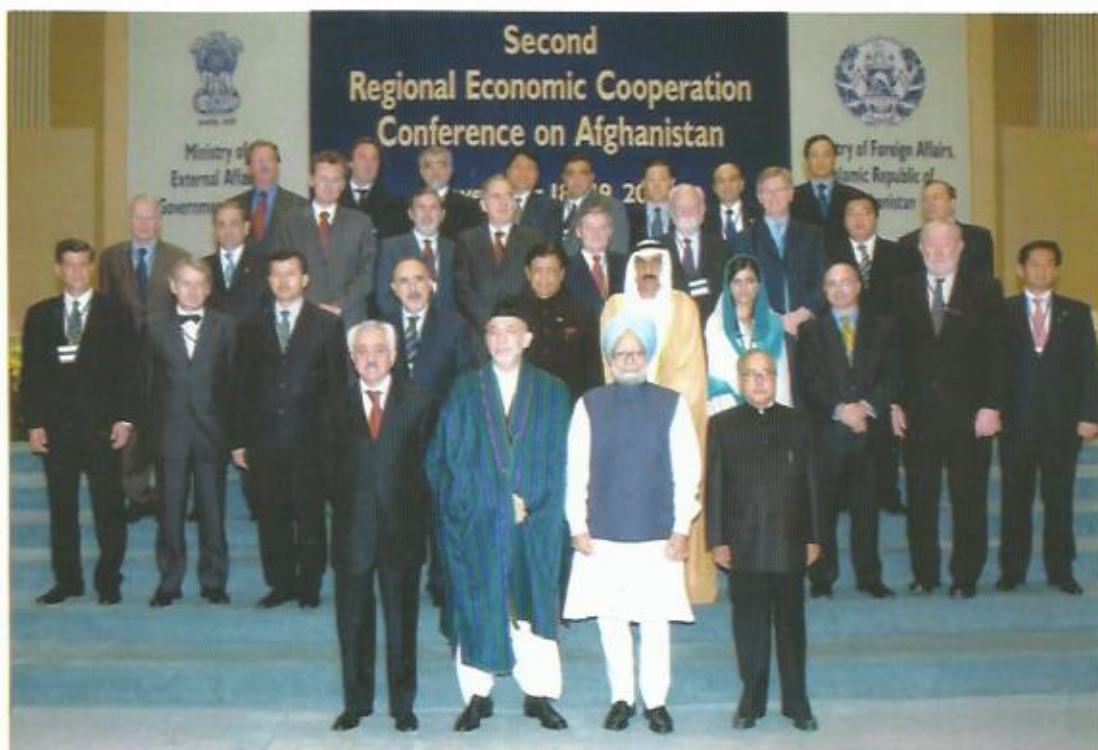
دومین کنفرانس همکاری‌های منطقه‌ای برای افغانستان، دهلی، هند، ۲۰۰۷.