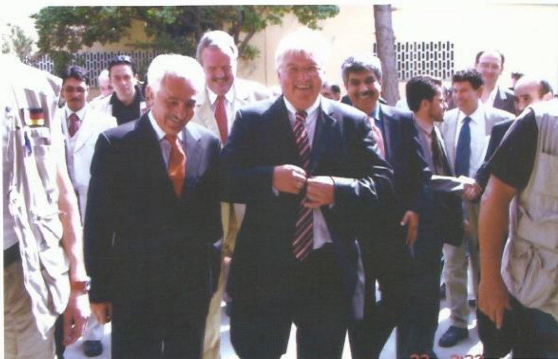
دیدار با فرانک اشتاین مایر وزیر خارجه‌ی پیشین و رییس جمهور کنونی آلمان، ۲۰۰۷.