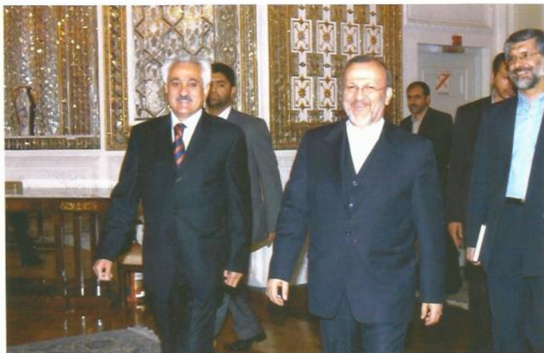
دیدار با منوچهر متکی، وزیر خارجه‌ی جمهوری اسلامی ایران،