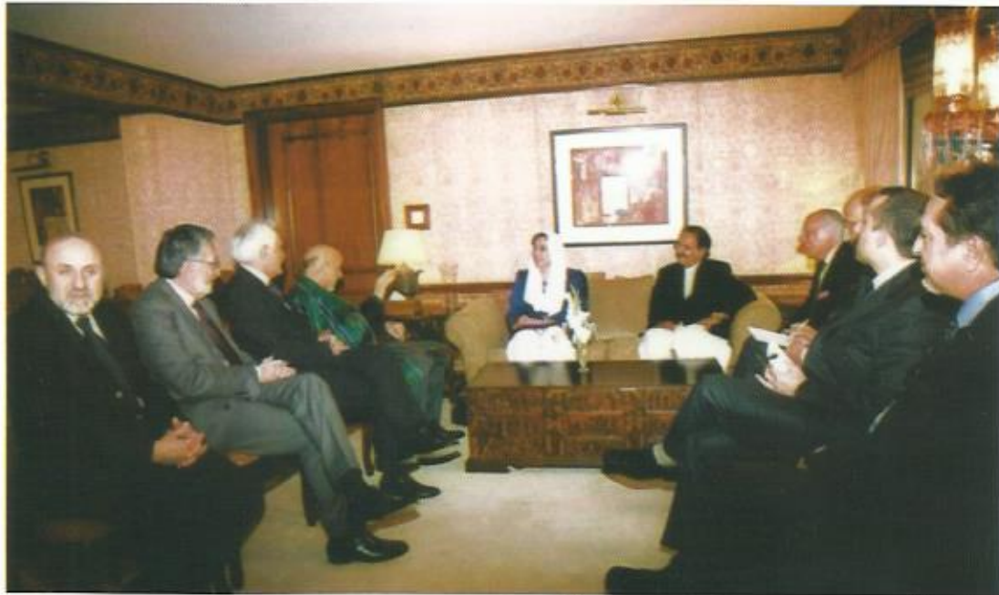
دیدار با خانم بینظیر بوتو، هتل سرینا، اسلام آباد، پاکستان، ۲۰۰۷. (بینظیر بوتو دو سه ساعت پس از این ملاقات کشته شد.)