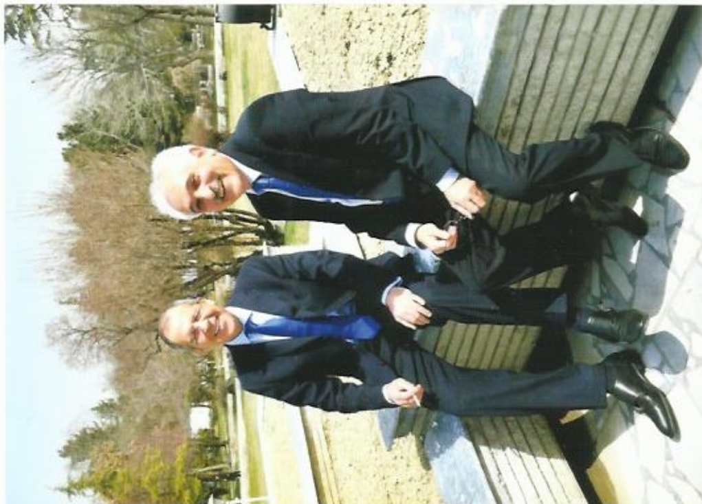
با سرگی لاوروف وزیر خارجه ی فدراتیف روسیه، وزارت خارجه افغانستان، ۲۰۰۸.